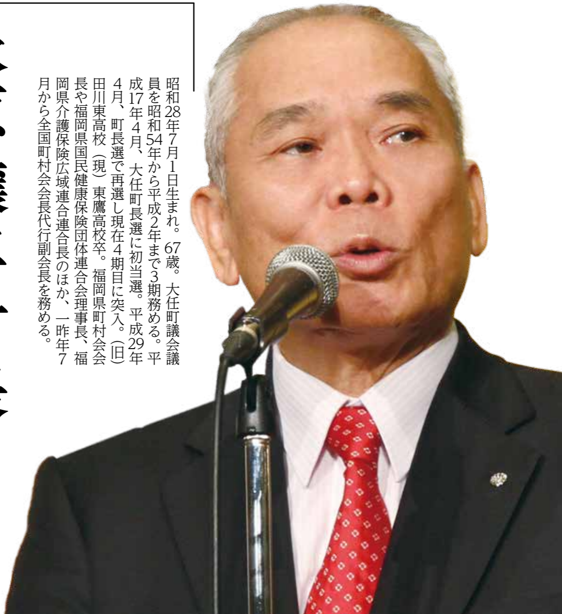
昭和28年7月1日生まれ。67歳。大任町議会議員を昭和54年から平成2年まで3期務める。平成17年4月、大任町長選に初当選。平成29年4月、町長選で再選し現在4期目に突入。(旧)田川東高校(現)東鷹高校卒。福岡県町村会会長や福岡県国民健康保険団体連合会理事長、福岡県介護保険広域連合連合長のほか、一昨年7月から全国町村会会長代行副会長を務める。