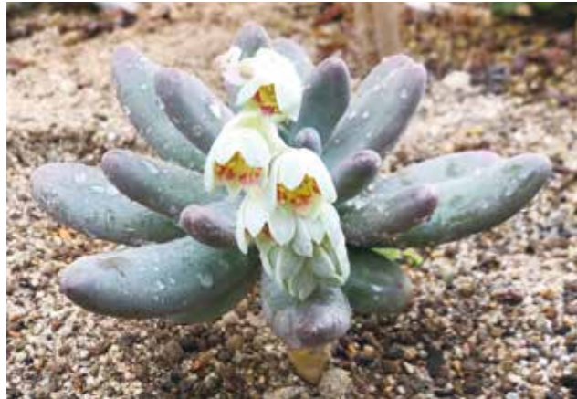
▲白く、雪のような花が咲いていました

このサボテンは、「パキフィツム オビリデ」といい、メキシコの高原を中心に分布し、ぷっくりとした葉をもつことが特徴の多肉植物です。また、大型の交配種で、花が連なって咲き、葉の色もやわらかいため、とても人気のある品種です。サボテンハウスに来館した際には、ぜひご覧ください。