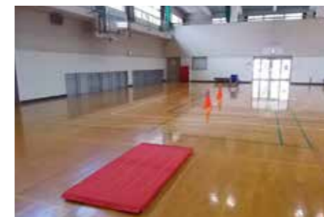
▲車イスの体験授業