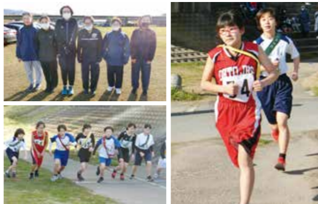
▼全力を出し切る生徒たち

マンゴーを道の駅おおう桜街道に出荷するのは、5月中旬の予定です。甘くておいしい大任産マンゴーをぜひご賞味ください。