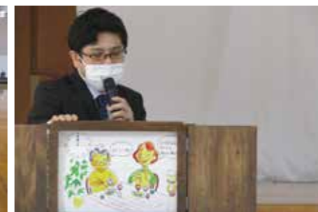
▲認知症サポーター養成講座