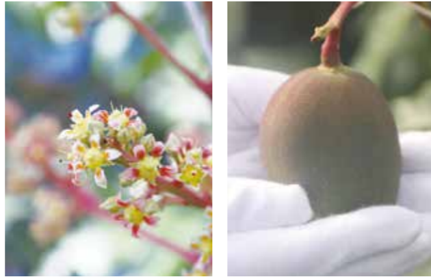
▼満開に咲くマンゴーの花(左)と春を待つ実(右)