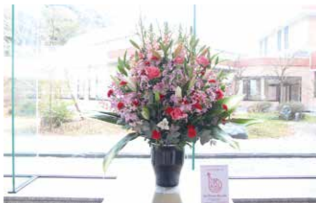
▲一週間毎に様々な花が設置されます

大任町でも、2月中旬から3月中旬まで役場ロビーや窓口に花を設置しています。来庁された際には、ぜひご覧ください。