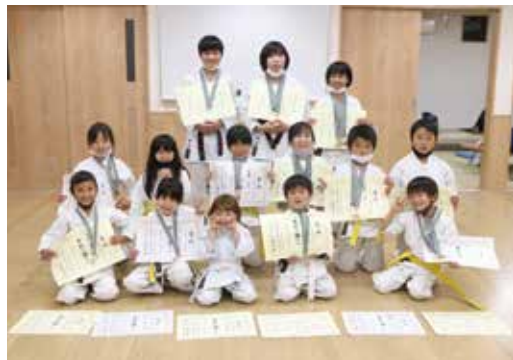
▼今回も多くの選手が好成績を残しました

昨年11月22日に飯塚市庄内小学校体育館で第6回嘉飯山空手道大会が、12月20日に田川市総合体育館で第18回筑豊地区新人空手道大会が行われ、大任町の峰集会所で練習をしているNPO法人日本空手松涛連盟の選手が上位入賞を果たしました。