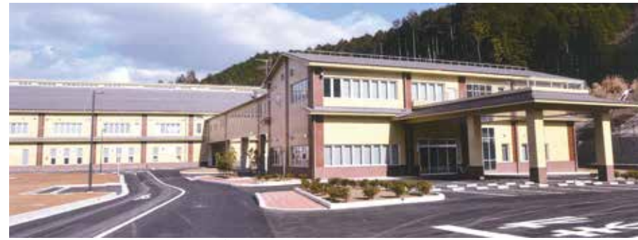
▲完成した田川地区クリーンセンター

「所管事務、諸般の報告」 内容は、総務常任委員会と同じですので21ページを参照願います。 以上で、地域振興常任委員会を閉会しました。