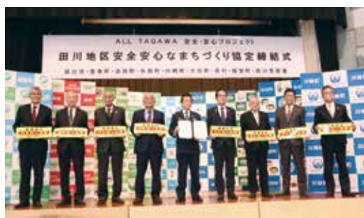
▼田川市郡8市町村長と田中田川警察署長(中央)

昨年12月7日、田川署と田川市郡8市町村が、犯罪被害者支援、暴力団排除、防犯活動を3本柱とする「ALL TAGAWA 安全・安心プロジェクト」を確実に進めるため、指針となる「田川地区安全安心なまちづくりに関する協定」を締結しました。この協定は「犯罪被害者に優しく、暴力団のいないまちづくり」「犯罪の未然防止」の実現を目指します。