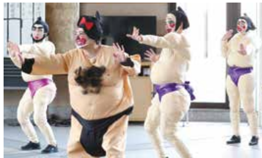
▼迫力あるダンスを披露しました