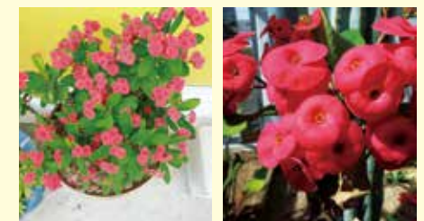
花 麒 麟