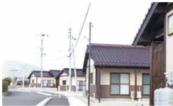
▲建替えが完了した皿山町営住宅

○ 永原町長 福岡県では今のところ100人くらいで何とか抑え込んでいますが、感染