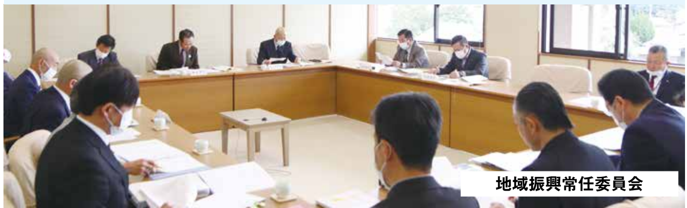
地域振興常任委員会

審査内容 ・ 議案第50号 大任町国民健康保険条例の一部を改正する条例について 内容は、地方税法施行令の一部改正に伴う個人所得税の見直しにおいて、給与所得控除や公的年金控除から基礎額へ10万円の振替え等を行うことで、7割・5割・2割の軽減判定に不利益が生じないように必要の改正を行うものです。 質疑&回答 (質疑・討論なし、採決の結果、全員異議なく可決) ・ 議案第51号 大任町営住宅設置及び管理条例の一部を改正する条例について 内容は、町営住宅皿山団地の建て替えに伴う位置の変更です。 質疑&回答 (質疑・討論なし、採決の結果、全員異議なく可決) ・ 議案第55号 令和2年度大任町し尿処理・じん芥処理・埋立処分施設建設事業特別会計補正予算 内容は、既定の歳入歳出予算の総額に歳入歳出6百19万7千円を追加し、歳入歳出97億8千5百42万1千円とするもので、歳入については、各市町村からの負担金を増額、歳出については、人件費及び12月24日の汚泥再生