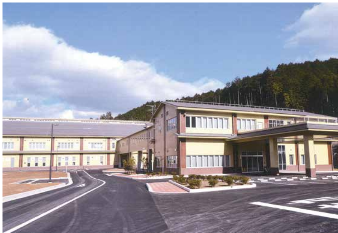
田川地区クリーンセンター（写真手前が管理棟、奥が処理棟）

汚泥の処理には水処理方式の標準脱窒素処理方式を採用し、さらに活性炭吸着による高度処理を行います。この方式は周辺環境の保全と資源の再利用に優れていて、安定した処理が行えます。