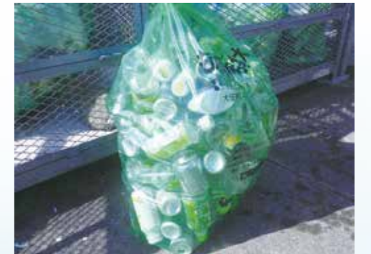
▲可燃ごみの袋にカンやペットボトルが混じり全く分別がなされていないごみ。このようなごみは回収できずにごみ籠に置れたままになります。