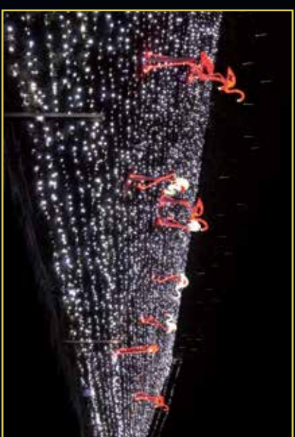
▲側面には光のフラミンゴが優雅に佇む