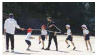
【どれだけとべるかな?】

もうひとつ新型コロナウイルス感染防止のため、今年度の体育会は残念ながら中止になりました。しかし、それに代わるスポーツイベントとして、11月27日(金)に「大任小学校スポーツ集会」を実施します。低・中・高学年に分けて各1時間の取組です。内容は走競技と大縄飛びを行います。各学年で練習が始まりました。グラウンドに子どもたちの声が響き始めています。