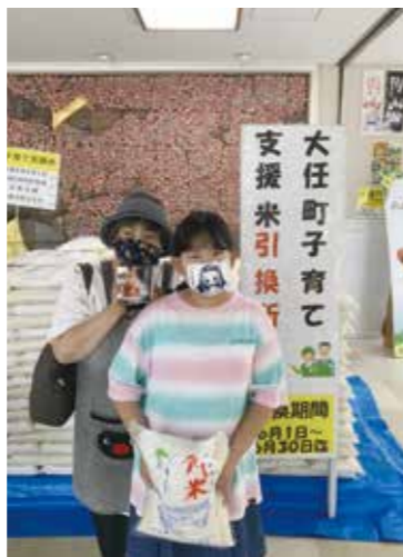
大神さん (つばき団地)

大任町さんありがとうございます！5歳と3歳になる子どもがいて、2人とも納豆が大好きなので喜