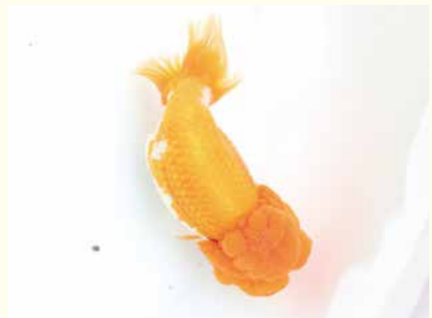
クローズ・アップ Close-up! らんちゅうブリーダー

最後に、金魚のおもしろさについて聞いてみると「なかなか思い通りの金魚になってくれないことです。10年に1匹くらいです。その分思い通りの金魚に育ってくれたときは、なにより嬉しいですね」と思いを語ってくれました。