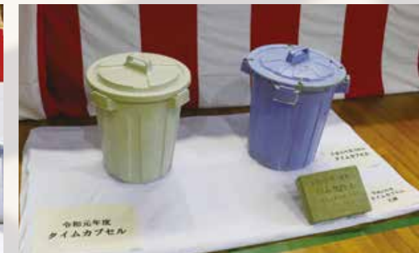
▲封入されたタイムカプセル（左）と開封されたタイムカプセル（右）