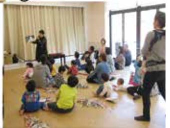
2月2日(日)子育て講座 豆まき大会のお知らせ