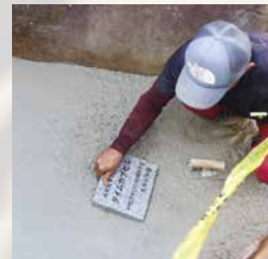
▲タイムカプセル封入の様子

「タイムカプセル」開封・封入式典 —タイムカプセルにのせて受け継ごう夢を過去から未来へ—