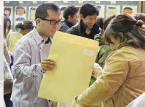
▲自身の作品を受取る当時の在校児童