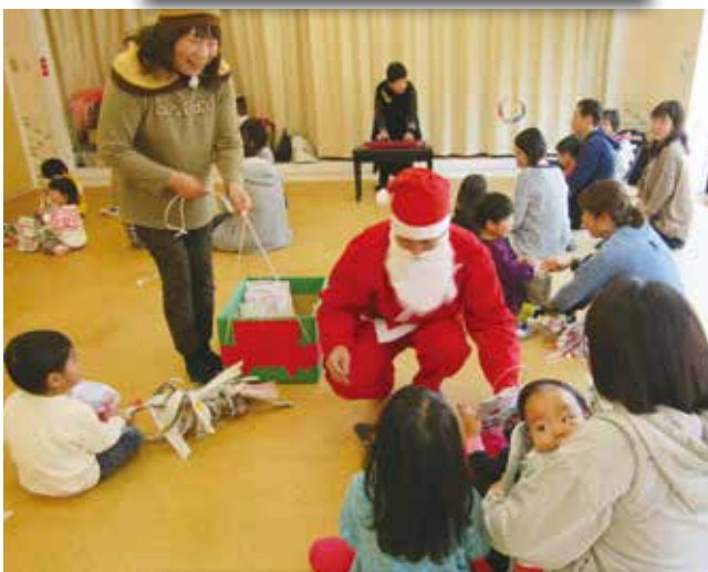
12月15日(日)子育て講座 クリスマス会の様子