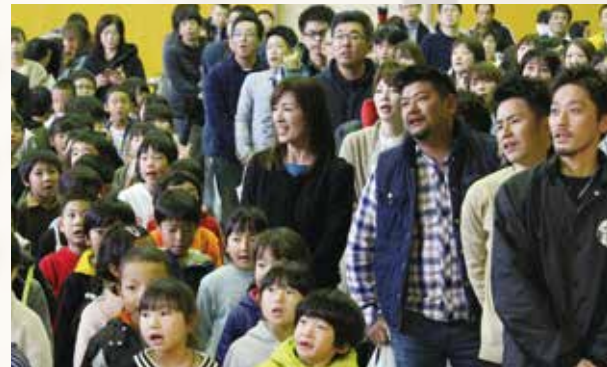
▲参加者全員による校歌斉唱