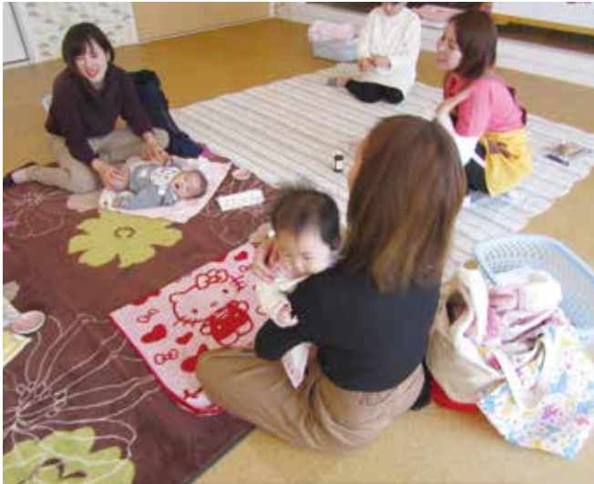
11月～12月全6回 わかばちゃん Dayの様子