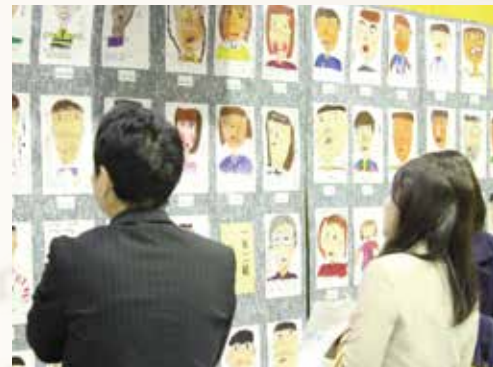
▲懐かしみながら作品を見る当時の在校児童