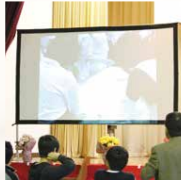
▲平成元年当時のビデオ映像