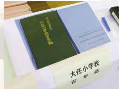
▲埋蔵当時の百年誌