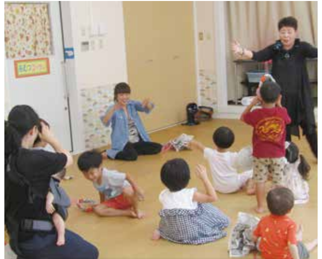
10月6日(日)子育て講座 親子遊びの様子