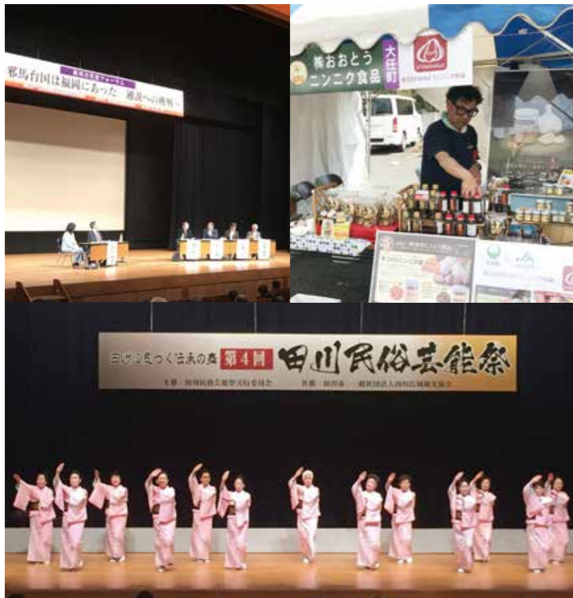
▲大任町を代表してステージに上がったおおとう音頭保存会は、一体感のある踊りを披露しました