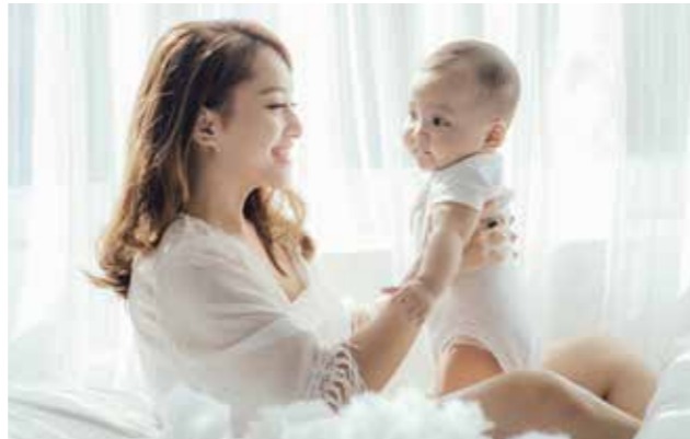
▼大任町が先駆けとなり、県内では田川市と赤村も実施しています

3月21日、田川青少年文化ホールで「田川民俗芸能祭」「田川古代史フォーラム ～邪馬台国は福岡にあった 通説への挑戦～」 「ぐるっと田川グルメ大熱戦」が開催されました。田川民俗芸能祭では大任町から「おおとう音頭保存会」が出演し、見事な踊りを披露しました。また、田川古代史フォーラムでは、近隣の赤村で発見された「赤村前方後円型地形」などについて専門家の先生たちが講演しました。そして、田川グルメ大熱戦では、町内から憐おおとうニンニク食品をはじめとする6店舗が自慢の商品を販売しました。