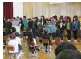
▲6年生、立派な学校紹介でした