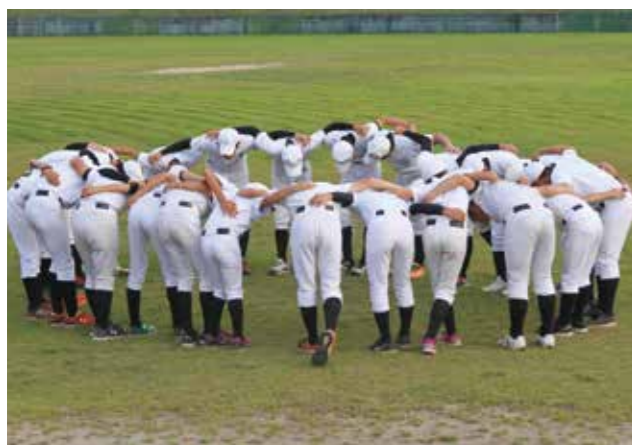
▲部員たちは感謝の気持ちを忘れず、何事も真剣に取り組んでいました

この寄付金は、こういったチーム活動の意志を汲んだかたちで町内児童・生徒の健全育成に役立てられます。