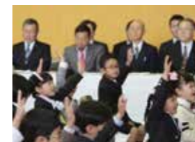
▲手を挙げて大きな声で「はい!」