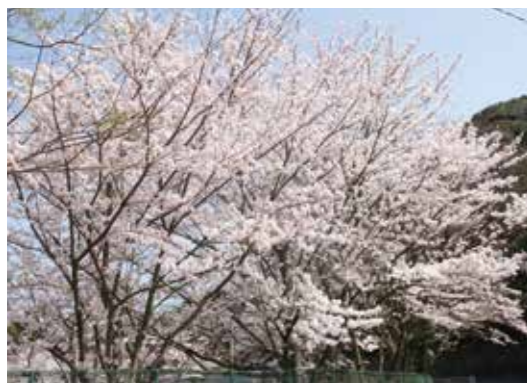
大任町民野球場(今任原 107-1)

毎年見事な一本桜が咲き、花見スポットとして高い人気を誇る大任中央公園。敷地内には、レインボーの滝や全長90メートルの滑り台があり、住民がボランティアで植えた4色のチューリップなどが咲いている。