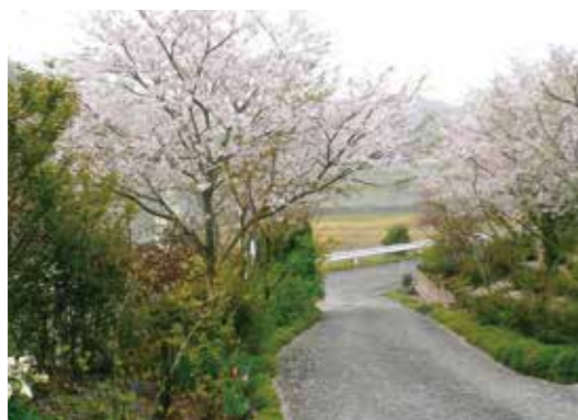
城乃越焼建窯付近(今任原 538)

小さな桜の木が立ち並ぶ自然の森キャンプ場。宿泊棟となるバンガロー(8人用)は1泊8,000円で利用することができる。春には、花見をしながらバーベキューを楽しむこともできる。