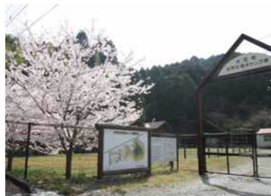
自然の森キャンプ場(今任原 139)

野球に取り組む子どもたちの声が鳴り響く大任町民野球場。駐車場も設置されていて、グラウンドの周りを囲むように満開の桜が咲き誇るが、花見のスポットとしてはあまり知られていない。