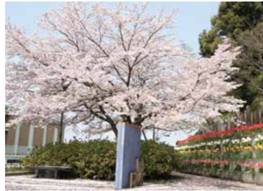
大任中央公園(大行事 1668)

鮮やかなピンク色の桜のトンネルが美しい大任町の名所。春には町内外から多くの人々が訪れウォーキングや花見を楽しんでいる。この桜のトンネルは春にしか見れない絶景スポット。