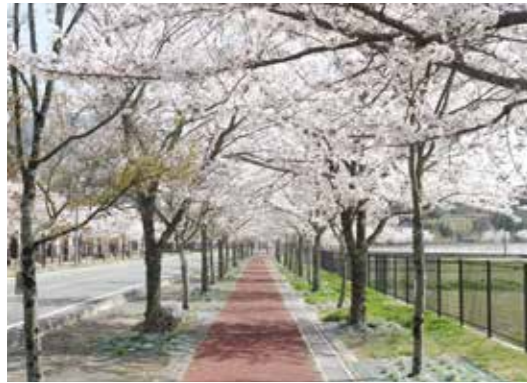
成光町営住宅前の桜街道

鮮やかなピンク色の桜のトンネルが美しい大任町の名所。春には町内外から多くの人々が訪れウォーキングや花見を楽しんでいる。この桜のトンネルは春にしか見れない絶景スポット。