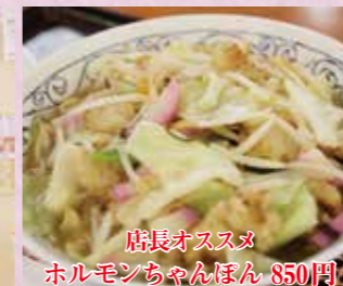
店長オススメ ホルモンちゃんぽん 850円