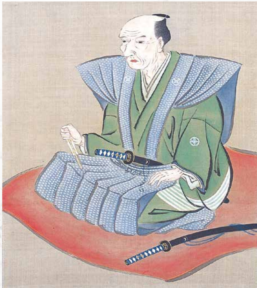
▶伊能忠敬は江戸時代中期の測量家。1745年に上総国(現千葉県九十九里町小関)に生まれる。下総佐原の伊能家を継ぎ、造酒業、米穀の取り引きなどを手がけ、名主や村方後見として郷土のために尽力。49歳で隠居後、江戸に出て天文学者の高橋至時の弟子として天文学を学び、のちに全国測量を成し遂げ、日本最初の実測地図を作成した。(伊能忠敬像)