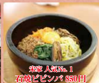
栄家 人気No.1 石焼ビビンバ $50円