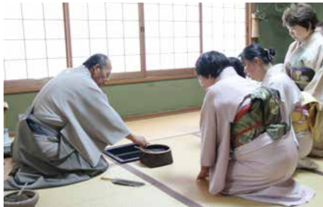
▲手本となる先生の作法や手順などを拝見するお弟子さんたち