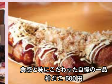
食感と味にこだわった自慢の一品 神だこ 500円

だしなどを調合した生地で焼き上げた当店のたこ焼きは、中はトロトロ、外はサクサクで厳選したタコがほの甘く身を弾ませる仕上がりに。焼き上げた後に、油で揚げるといった独自の手法なので熱々のたこ焼きを提供できます。おすすめメニューは、神だこ、明太マヨ、ねぎ醤油です。それに加え2年前に「道一グランプリ2017」のスイーツ部門で1位を獲得した石炭ソフトも欠かせません。この商品は、チョコレートに竹の炭を練り込むという手法で、店長が何度も試行錯誤を繰り返して生み出したものです。