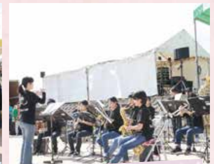
大任中学校 brassバンド演奏