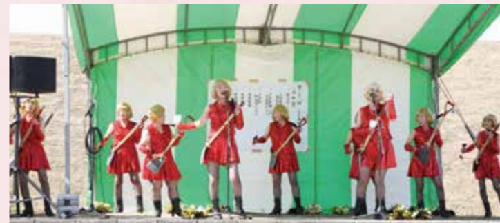
Big Sisters OTO 姫 (大任町商工会女性部)

今年で32回目を迎えた町の伝統を誇る秋の祭り。この祭りの恒例となったラムネ早飲み大会やわくわく抽選会などでは大人や子どもの笑顔があふれた。