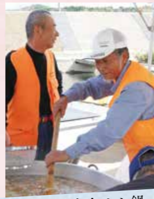
大任町猟友会 シシ鍋