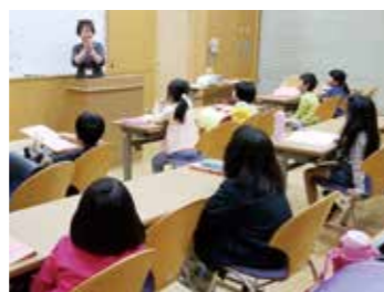
月曜日クラスの様子

大任町では、生涯にわたる人格形成の基礎を培う幼児教育の充実をはじめ、学びを通じて自立・協働型の地域づくりを推進していくことを目的に「大任町教育施策大綱」を策定しています。現在、大綱に基づき「大任の子が30歳になったときに、精神的にも経済的にも自立した大人になる10年計画(就学前年～中学3年)」を中心に「おおとう未来塾」の充実化などを掲げています。「おおとう未来塾」