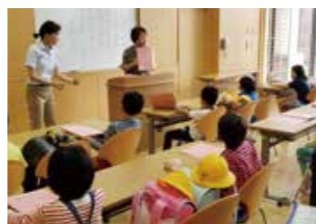
火曜日クラスの様子

では、子どもたちの学力向上を第一に、規律(ルール)を遵守することにも力を入れています。まわりの友達と遊びたい盛りの児童たちを勉強に集中させるのは大変ですが、授業づくりの工夫を重ね、子どもの心理を読み取り、学習することの楽しさや充実感を教えています。