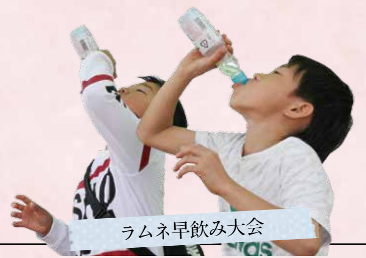
ラムネ早飲み大会