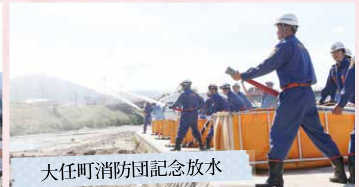
大任町消防団記念放水