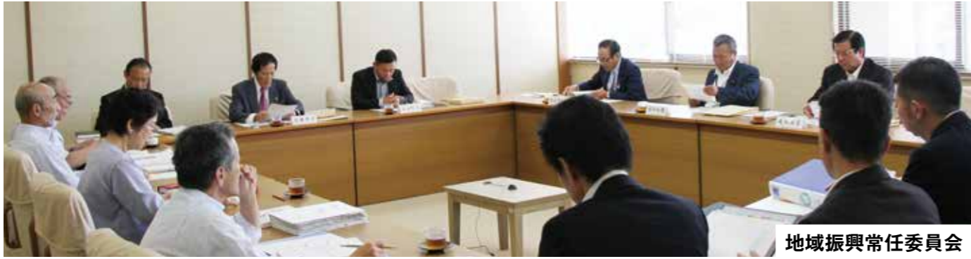
地域振興常任委員会

審査内容 ・議案第31号 福岡県介護保険広域連合の処理事務の変更及び福岡県介護保険広域連合規約の変更について 内容は、介護保険法の一部改正により県から保険者へ指定権限が委譲されたことに伴い、福岡県介護保険広域連合の処理事務を変更する必要があるもの。あわせて、福岡県介護保険広域連合の執行機関等の組織の見直しに伴い、福岡県介護保険広域連合規約を変更する必要があるため、地方自治法第291条の11の規定により議会の議決を求めるものであります。 質疑&回答 結果、全員異議なく可決 ・議案第33号 平成30年度大任町国民健康保険事業特別会計補正予算について 内容は、既定の歳入歳出予算の総額に歳入歳出それぞれ2千9百13万6千円を減額し、歳入歳出予算の総額を6億5千3百29万8千円とするものであります。 質疑&回答 結果、全員異議なく可決 ・議案第34号 平成30年度大任町後期高齢者医療特別会計補正予算について 内容は、既定の歳入歳出予算の総額に歳入歳出それぞれ