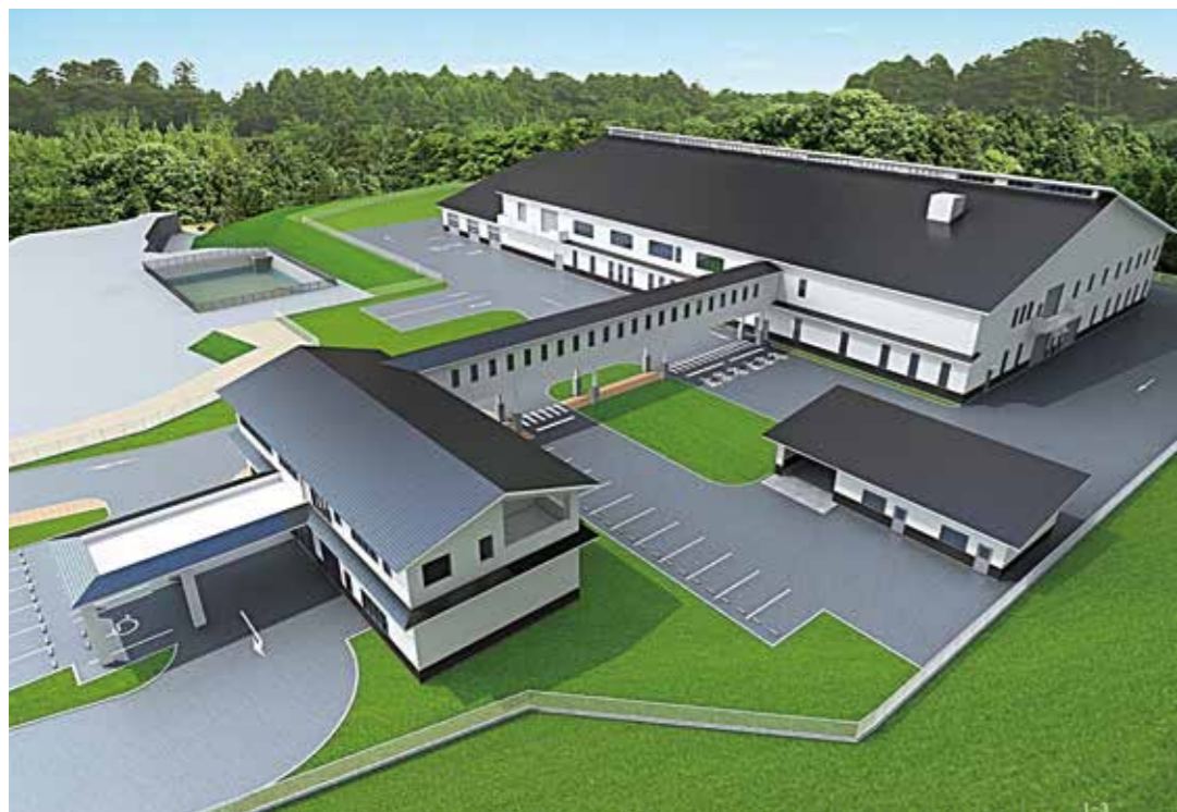
大任町汚泥再生処理センターの完成予想図（左が管理棟、右が処理棟）

これに伴い、東部縦幹2号線道路をはじめ、成光地区、東白土地区、柿原地区で運搬用道路の整備もあわせて行っています。起工式では、地鎮祭や工事の安全