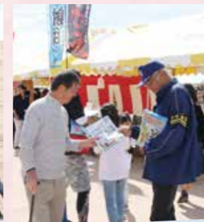
大任・添田少年補導員