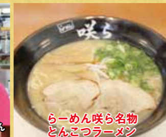
らーめん咲ら名物 とんこつラーメン

当店の一番のこだわりは、国産豚骨だけを8時間じっくりと煮込んでとった臭みのないあっさりとした豚骨スープです。コクのある優しいスープが麺とよく絡み、食べやすい一品となっています。看板メニューである「とんこつラーメン」を筆頭に、ボリュームのあるセットメニューなどは多くの人からの支持を得ています。そのほか炒飯や餃子などメニューも豊富です。また、当店は従業員全員が女性という特徴あるスタイルで力を合わせて頑張っています。らーめん咲らにぜひ、一度お越しください。