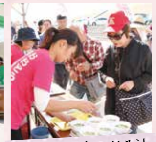
大任町商工会 しじみ汁