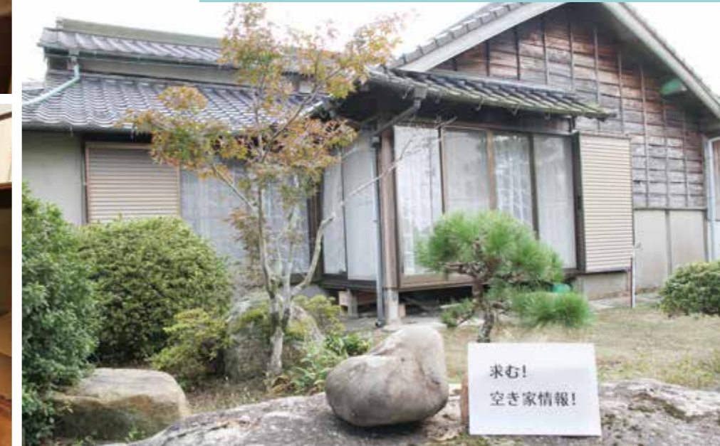
↑大任町にある空き家の様子