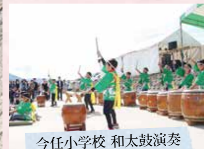
今任小学校 和太鼓演奏