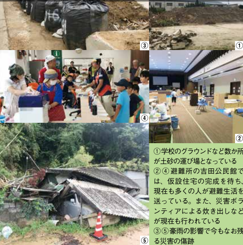
①学校のグラウンドなど数か所が土砂の運び場となっている ②④避難所の吉田公民館では、仮設住宅の完成を待ち、現在も多くの人々が避難生活を送っている。また、災害ボランティアによる炊き出しなどが現在も行われている ③⑤豪雨の影響で今もなお残る災害の傷跡