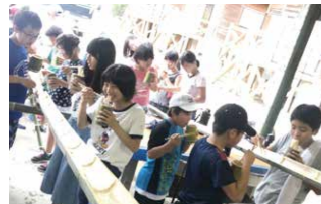
▲自然体験活動として流しそうめんや水上スキー体験などを行いました