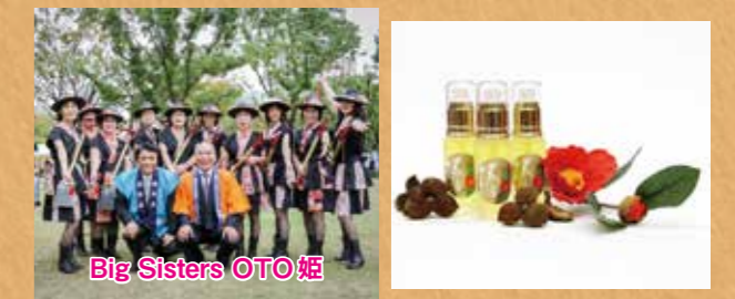
Big Sisters OTO姫

大任町商工会女性部は、町の花木である椿を利用した「ツバキ油」や国内産しじみを活用した「大ちゃん味噌汁」などを商品化しています。また、平成29年8月に町のPRを目的に活動するパフォーマンスユニットとして「Big Sisters OTO姫」を結成しました。このユニットの特徴は、手作りのスコップ三味線を持ち、自分たちで作詞した地元愛あふれる曲を町のイベントや町村フェアなどで披露しているところです。今後も大任町の知名度をより一層高められるよう、みんなで協力して頑張っていきます。