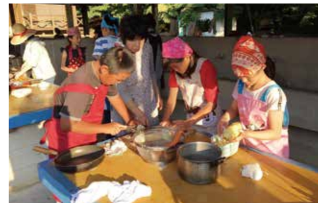
▲児童たちは飯ごう炊さんに挑戦し、カレーライスを作りました