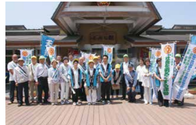
▲ふれあいと対話を大切にし、皆さんのチカラで社会を明るくしましょう

7月20日、犯罪や非行を防止し、罪を犯した人の更生に地域で取り組むことを目的とした社会を明るくする運動が行われました。大任町と添田町の参加者が合同で道の駅など3か所をまわり街頭広報活動を実施。大任町からは大任町更生連絡協議会が参加しました。道の駅おおう桜街道では、訪れた人にチラシやティッシュを配布し、非行や罪を犯した人たちが立ち直るための社会づくりに協力を呼びかけました。参加者は「この活動が少しでも犯罪のない地域社会づくりにつながればうれしいです」と話していました。