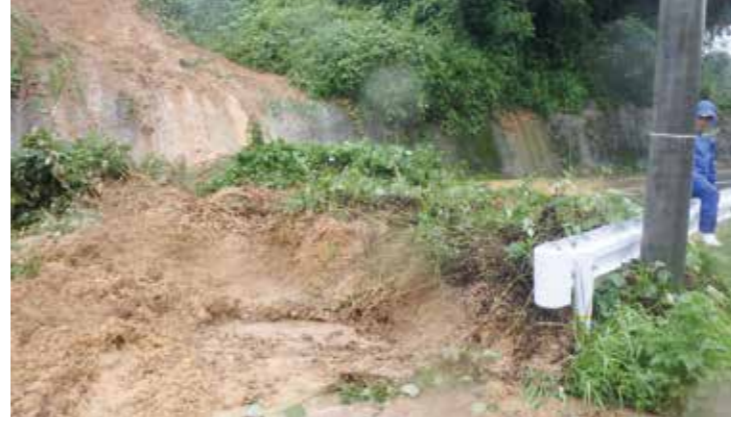
▲道善・玉川線の一部が土砂で寸断。通行止めを余儀なくされた

7月5日から6日にかけて、ゲリラ的豪雨が西日本全域を襲い、町内の数か所で被害が発生しました。今回は、災害発生後の状況と防災に役立つ情報をお伝えします。