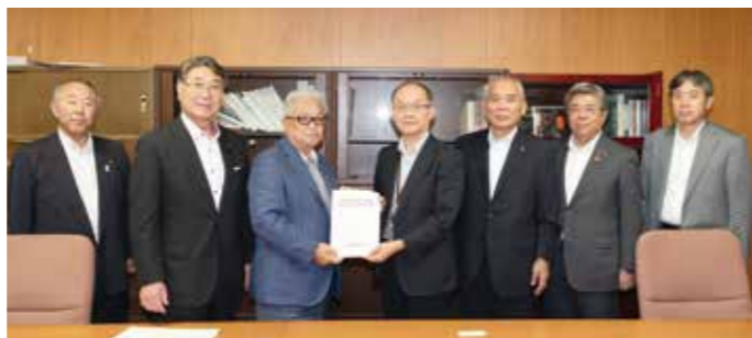
▲蒲原基道 事務次官（右から4番目）に要望書を提出