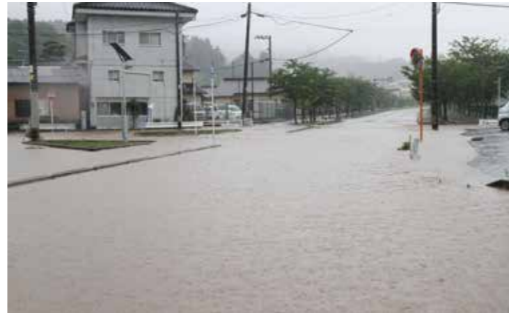
▲7月6日の豪雨で大任中央線の一部が冠水

【西日本豪雨】平成30年7月5日から6日にかけて激しい雨が降り続きました。その結果、町内では土砂崩れ4か所に加え、道路の冠水や側溝の氾濫などの被害も発生。近隣の飯塚市では、仁保の筑豊ハイツ付近にある国道201号線の一部が陥没する被害も発生した。