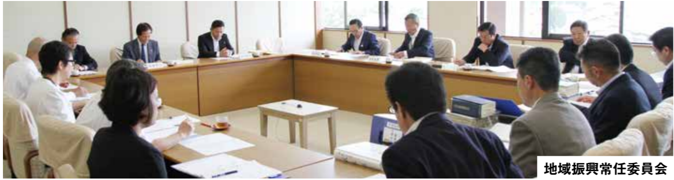
地域振興常任委員会