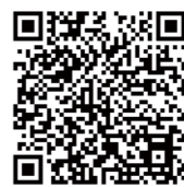
※福岡県ホームページ(防災メール・まもるくん)

●防災メール・まもるくん 福岡県では、「防災メール・まもるくん」を利用して、台風や地震などの防災気象情報などをメールでお知らせしています。登録は無料です。