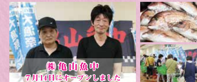
株 亀山魚中 7月14日にオープンしました

福岡県内に9店舗を構える「株亀山魚中」は、7月14日に道の駅にオープンしました。当店の看板は厚切りに切った本マグロやかんぱち、ウニやイクラなど7種類の具材が贅沢にのった海鮮丼です。また、こだわりとして行橋の箕島からできるだけ多くの新鮮な魚を入荷しています。さらに8月上旬から毎週土曜日に、九州産のマグロを使った解体ショー、鹿児島産の一级品うなぎを使った炭火焼きの販売なども予定していますので、ぜひ、お越しください。