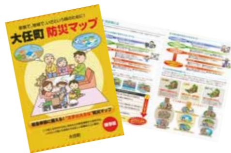
※自然災害時などの緊急事態に備えた情報が満載

町では、災害に強いまちづくりを目指して、防災マップを作成し、配布しています。この防災マップには、町内の災害危険箇所や避難所、防災機関位置などを掲載しています。最寄りの避難場所や緊急連絡先などを確認して災害時には迅速に避難できる準備をしておきましょう。