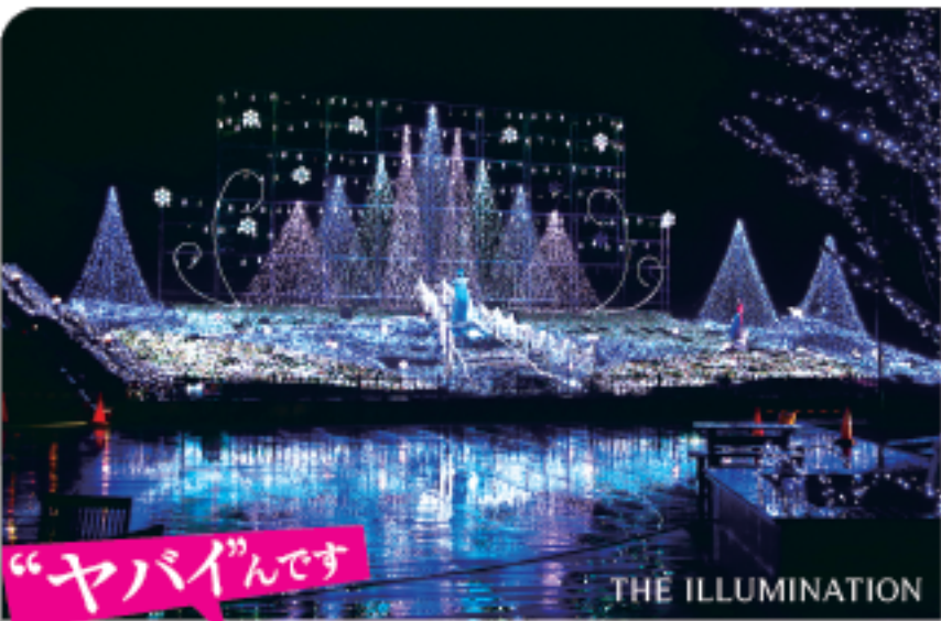
“ヤバイ”んです THE ILLUMINATION