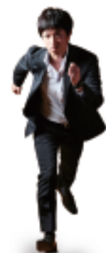
EVENT & FESTIVAL