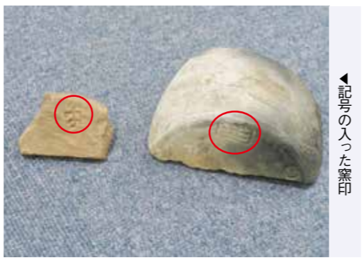
記号の入った窯印

字を刻んだものには、「田香」、「清」、「良」、「宇」などがあり、記号は文字を象形化あるいは簡略化したものがあります。ほとんどが、