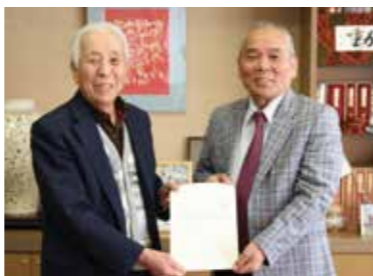
▲永原町長に答申を手渡す西藤嶺会長