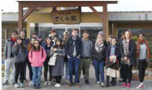
▼道の駅の温泉(さくら館)を訪れた北九州市立大学の留学生

1月21日、道の駅おおとう桜街道さくら館(温泉館)に、ホストタウン推進調査の一環として北九州市立大学の留学生計23人が訪れ、温泉を体験しました。今回の調査では、観光地や企業を巡り、携帯電話やカメラで撮影した写真をSNS(ソーシャルネットワークサービス)を通じて海外の知人に向けて投稿し、田川地区の魅力を海外に伝えました。