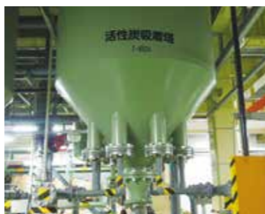
▲残った有機成分、色度成分の除去を行う