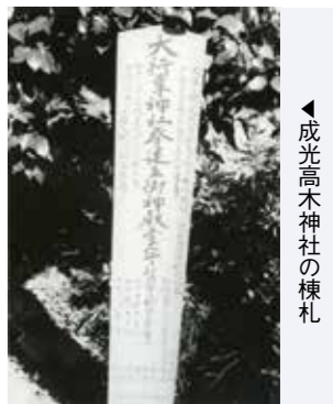
◀成光高木神社の棟札

木に刻まれた内容を見ていくと、次のようなことが分かります。①白土天満宮(現在の西白土菅原神社)が建てられたのが、鎌倉時代の承久年間(1219～1222)で、当初建物が草造りで、天神山(東白土)にあったこと、②応永5年(1398)の兵火によって焼失し、長年にわたり衰退したとのこと、③天文22年(1553)に神社の荒廃を憂えた白土城主であった原田義貫が無田山(現在地)に神社を遷し、再建したこと、④義貫の孫である城主の原田義忠が、慶長5年(1600)8月25日に神像を新調して奉納したことが刻まれています。刻まれている内容だけでは、断片的なこと、資料も少なく、裏付けることも困難ですが、地域や建物の歴史を知るうえで貴重なものです。ふるさと館まで問い合わせください。