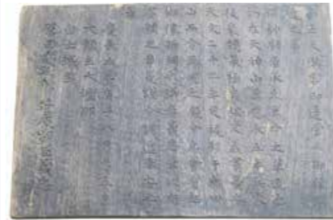
▶棟札と思われるもの

棟札は寺社や家などの建物を建築や修繕した際に、棟木や梁などの建物内部の高所に取り付けられた札のことです。通常、札に建物の由緒や関係者、建築年月日などを記入します。縦長の木の板で上部を山形にしたものが多くあります。平安時代の中尊寺のものが最古で、鎌倉時代以降普及しました。建物の歴史やいきさつを知るうえで貴重な資料となっています。それまで建造物がいつ建てられたかわからない場合でも、建物の改築や建て替えの際、見つかることが多く、それによって分かる新事実もあります。今回紹介するのは、縦19cm、横28cm、厚みが1.5cm～2cmほどの横長のものです。通常のものとは形状が異なるため棟札が微妙なものです。杉板に刻まれていることから、それに近いものと思われる。神社建て替えか、修繕の際、建物から取り外され、神社を管理していた神主の家で大事に保管され、町に5年ほど前に寄贈されたものです。