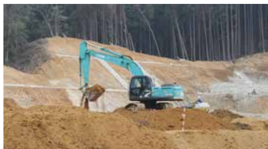
▲施設建設の土地を造成するための作業を行う様子(成光)