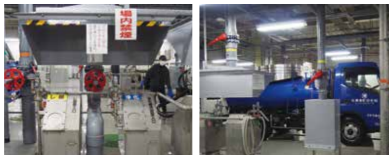
▲し尿・浄化槽汚泥を受入口から投入し、次の過程につなぐ役割をしている