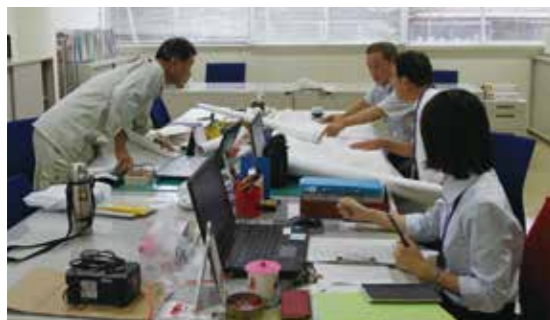
▲9月から大任町公民館に設置され、今回の建設を担当