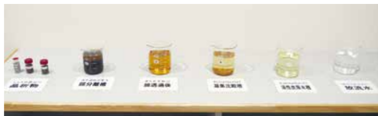
▲上記のような作業過程を経て、最後は右端のような放流水となるしくみ 左から、晶析槽、膜分離槽、膜透過後、凝集沈殿槽、活性炭原水槽、放流水 ※施設設備の紹介は紙面の都合上、一部のみとなっています。