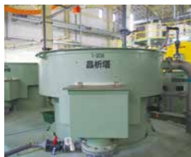
▲膜ろ過水を上向流で接触させリンを回収