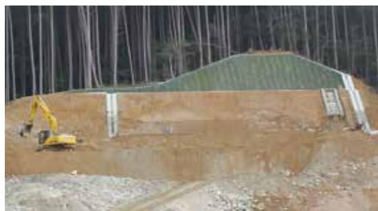
▲平成29年度1月現在の施設建設の土地造成状況(成光)