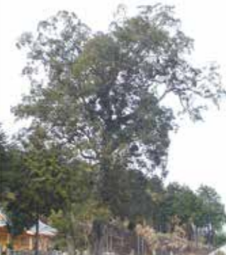
菅原神社のイチイガシ(西白土)