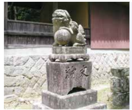
町指定有形文化財狛犬(上今任)