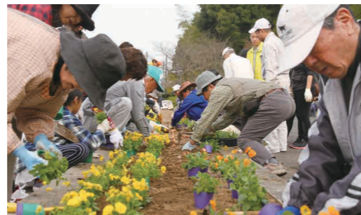
▼町を明るくしようと町内から多くの方が花植えに参加

11月20日、レインボーホールと中央公園で花植えのボランティア作業が行われました。