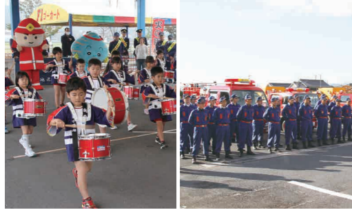
▼今任保育園の園児による演奏 ▼町のために取り組む消防団