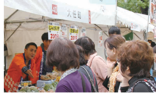
▼町のブランド品のニンニク球や新鮮な野菜などを販売

10月22日、23日の2日間、天神中央公園で平成28年度町村フェアが開催され、役場職員や大任町商工会から約20人が参加しました。