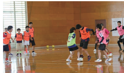
▼小学生から高齢者までが参加し、共に汗を流しました

10月29日、B & G 体育館でアビスパ福岡の協力を得て、健康づくり地域交流フェスタが開催されました。参加者は高齢者が19人、小中学生36人、子どもたちの保護者など大人11人の計66人。子どもから高齢者まで、誰でも気軽に参加できる10種類のミニゲームをとおして、いい汗を流すとともに、地域間、世代間の交流を深めました。