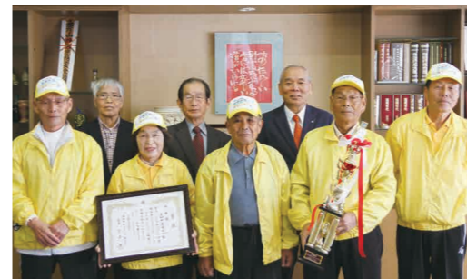
▼42チームが参加した大会で準優勝を果たした大任町老連

10月25日、大野城総合公園で第38回福岡県老人クラブゲートボール大会が開催されました。