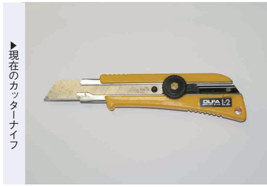
現在のカッターナイフ

刀子とは、今風に言えば、ナイフや小刀のことです。武器としてではなく、木を削る加工用の道具として使われたと考えられています。その歴史は古く、縄文時代(今から3000年前)にまでさかのぼります。青銅(銅と錫の合金)や鉄、石製があり、このうち多くみられるのは、鉄製と石製のもので、今回は紹介する町内の古墳から出土している刀子は全て鉄製です。