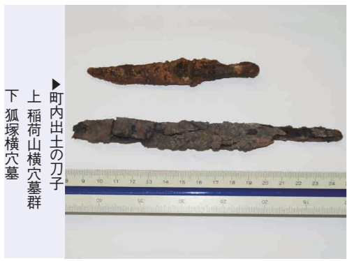
町内出土の刀子 上 稲荷山横穴墓群 下 狐塚横穴墓

町内では、狐塚古墳・横穴墓群(安永)、大行事横穴墓群(小林)、稲荷山横穴墓群(西白土)、建徳寺2号墳(上今任)など主要な古墳のほとんどで出土しています。古墳時代中期(今から1600年前)以降になると、鉄製の武器や農具、工具が多く見られますが、鉄製の刀子もそのうちのひとつです。長さが12cm~18cmくらいの大きさです。刀子は、ものを削る刃の部分と柄をつける部分に分かれています。柄の部分は、木を装着していたことが考えられ、刃の部分も同じように木製の鞘があつたものと想定で