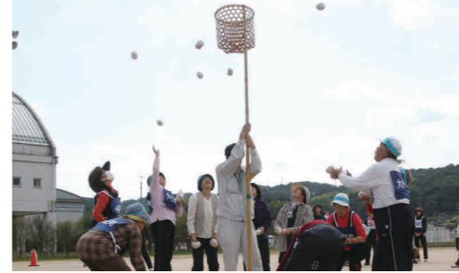
▼チームで助け合いながら競技し、つながりの1ページが完成

10月30日、そえだサンスポーツランドで第52回身体障害者体育大会が開催されました。この大会は、障害者同士の交流や親ばくを深めることを目的として、毎年行われています。