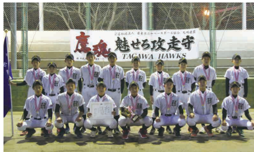
▼チーム一丸となって支え合い、強さを魅せたホークスライン

11月6日、田川市民球場などで開催された、第3回ポニーリーグ九州連盟杯争奪トーナメント大会に田川ホークスが出場し、見事準優勝を果たしました。