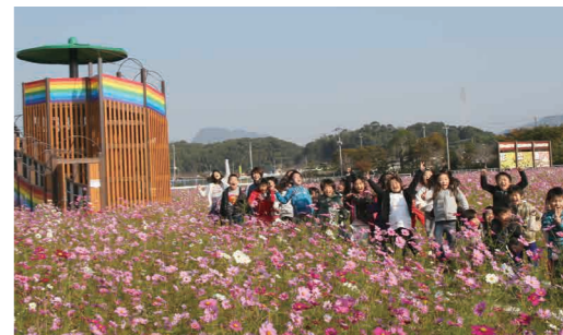
▼花公園を訪れた大任小1年生が元気いっぱいジャンプ

11月4日、コスモスが満開に咲いた花公園に大任小学校の1年生約30人が訪れました。