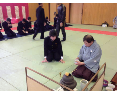
▲先生が一杯ずつ丁寧にたててくれました