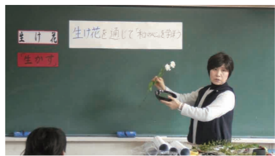
▲生け花を通じて相手を思いやる「和の心」を学びました