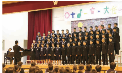
▼3学年が日々の練習を積み重ね、本番では最高の合唱を披露

10月23日、大任中学校で文化祭が行われました。合唱コンクールでは、学年合唱、学級合唱、ブロック合唱の3つの部門が行われ、生徒たちは気持ちのこもった合唱を披露しました。