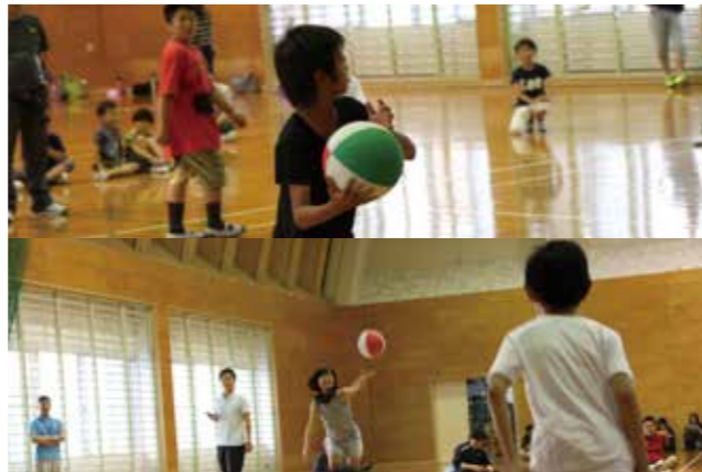
▼力強いボールを投げる様子で笑顔で溢れる子どもたち