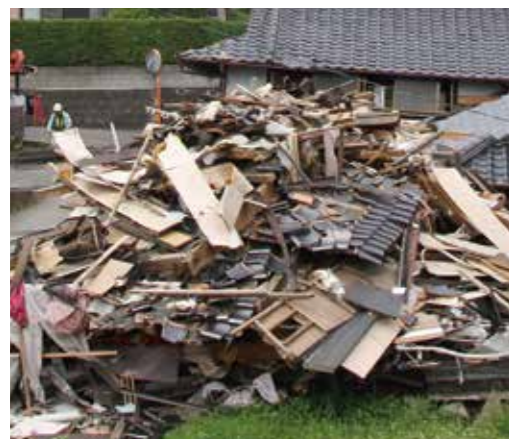
▲被害の大きさを感ずる家屋倒壊(西原村)