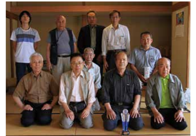
▼個人の技術を披露し熱戦を繰り広げた参加者たち

両ブロックの生徒たちは、苦しい日々の練習を積み重ねる中で心が一つとなることができ、体育会本番では最高の演技ができたようでした。また、3年生にとって心に残る体育会となり、ここまで支えてくれた人に成長した姿をみせられたのではないのでしょうか。今後も、残りの学校生活を楽しみつつ、受験に向け頑張してほしいと思います。