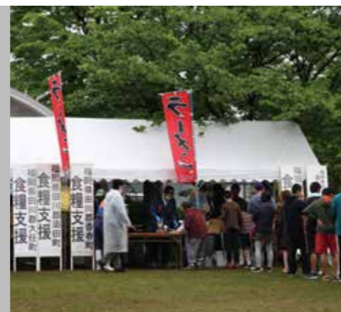
▲熊本県内でラーメンの炊き出しを実施