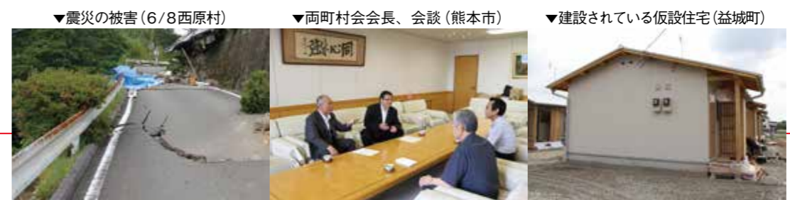
▼震災の被害(6/8西原村) ▼両町村会会長、会談(熊本市) ▼建設されている仮設住宅(益城町)