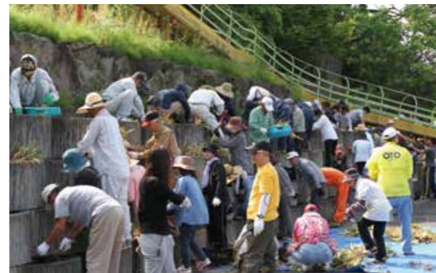
▲暑い中熱心に作業に取り組む参加者たち

花壇にはポーチュカとメランポジウム、合計4,300本の花が植えられました。今年も多くの方の協力で作業は1時間足らずで終わることができ、町は花で満たされ道行く人の目を楽しませてくれることでしょう。