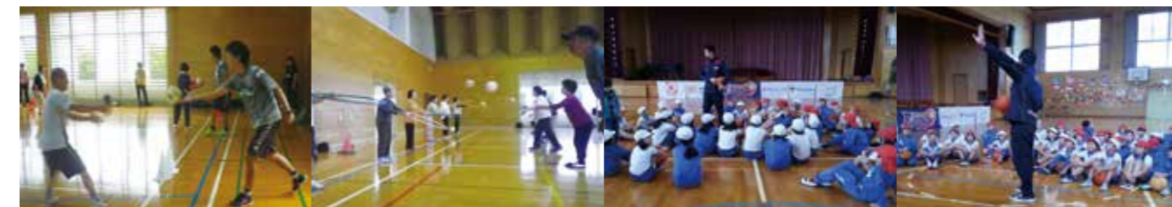
▲アビスパ福岡の活動の様子