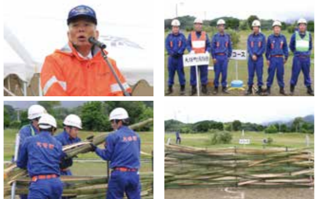
▼仲間と協力して頑丈な竹柵を作成した大任町消防団

会場は笑顔と笑い声につつまれ、どのチームも力を合わせて楽しくプレーし、親子のきずなを深めているようでした。