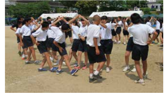
▲男女仲良くフォークダンス