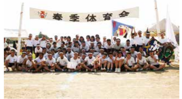
▲最後まで全力を尽くした白組