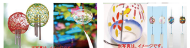
※写真は、イメージです。

☆7月13日(水)13:30~15:30 つくっCiao!(^^)! 夏といえぱ・・・あつい!!その暑さを安らぎに変えませんか?♥今回は、昨年同様『風鈴』を作ります (>V<*)一緒に楽しみませんか?♪当日は、託児付の材料費として、200円頂いております。参加申し込みは、来館の際かお電話でお願いいたします。 締切7/10(日) 63-4828