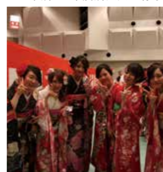
▼平成28年度成人式の様子

☎63・3110 ☎63・3110 意ください。 ☎63・3110 ☎63・3110 ☎63・3110 ☎63・3110