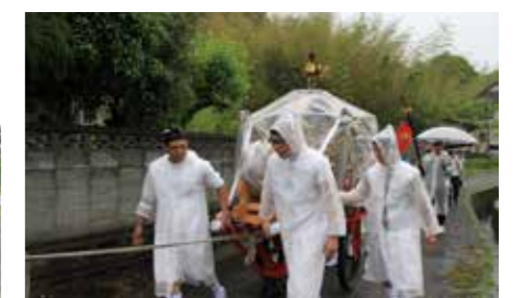
▲秋永・島台・梅田