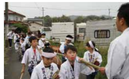
▲上今任 (子ども15年ぶり)