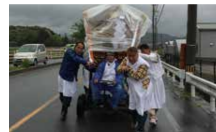
▲灰ノ木・安高・西白土