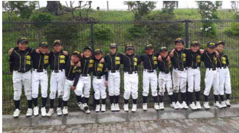
▲仲間との絆の深さが伝わります

監督、コーチが責任を持って指導させていただきますのでご安心ください。6月には低学年(4年生以下)の試合もありますので、興味のある方は見学などお気軽にお越しください。