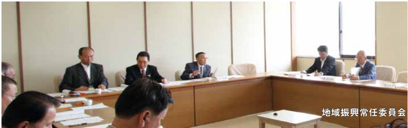
地域振興常任委員会

●特産品開発課長 9名から12名位で検討しています。給食センターと併設していますので、午前中は給食センター、午後からローテーションを組みまして、納豆、豆腐等の製造に取り組みます。 (討論なし、採決の結果、全員異議なく可決) ●議案第16号 大任町国民健康保険条例の一部を改正する条例について