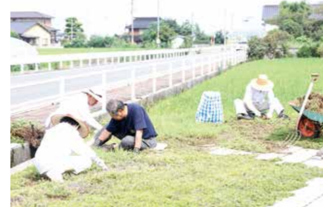
▲花壇の草がなくなるまで炎天下の中作業をしていました

「町が作ってくれた花壇なので花がきれいに咲くように願っています。各地区が自分たちで草取りをしたらいいんだけど」と話してくれました。