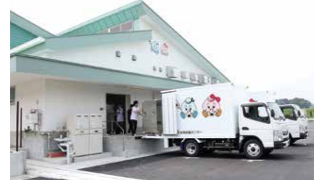
▲3校の給食をそれぞれトラックに積み込みます