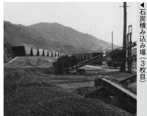
石炭積み込み場(3枚目)

国鉄添田線は、筑豊地区の他の鉄道線同様、沿線にある炭鉱から掘り出される石炭を運搬するために設けられました。大正5年に開坑された大峰三坑(現在のゴルフ場付近にあった)からは彦山川に鉄橋がかかり、炭鉱からトロッコによって石炭が運搬され、大任駅で積み込まれていました。余談ですが、大