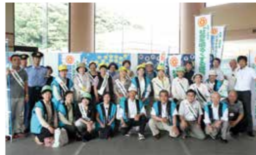
▼7月17日、パレード参加者の皆さんで集合写真

職場体験を控えた中学2年生、推薦入試や受験をひかえた中学3年生にとって有意義な教室になっていました。場面に応じたあいさつなどの礼儀を、生徒たちは熱心に学んでいました。