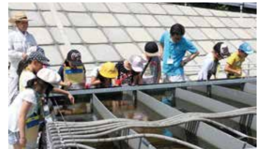
▼しじみの子どもを真剣に探す児童たち

6月19日、今任小学校3年生9人が商工会、しじみ養殖場、道の駅おとう桜街道を訪れました。