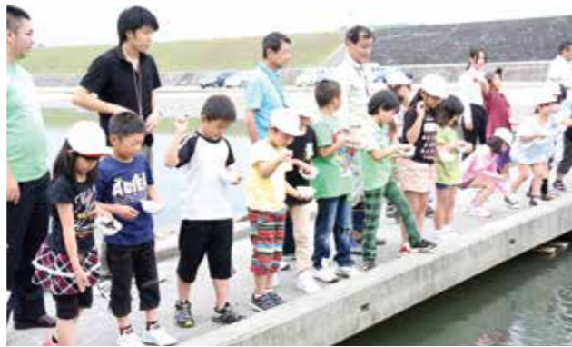
▼川のそばにズラリと並んで握りしめたしじみを大切に放流しました