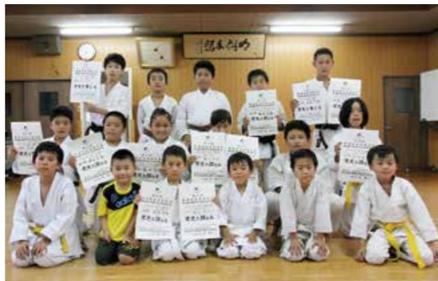
▼練習で身につけた力を出したくさんの賞を獲得した選手たち

この放流は、しじみ1個でコップ1杯分の水をきれいにするのにちなんで、子どもたちに自然の大切さを学んでもらうために昭和61年から、毎年行われています。商工会が準備した約10kgのしじみの稚貝を児童一人ひとりが両手でいっぱいにつかんで「川がきれいになりますように」と願いを込めて、次々と川に放流していました。