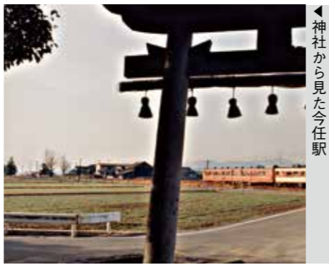
◀神社から見た今任駅

がうかがえます。遠くには三井六坑(田川市夏吉)のボタ山が写っています。今もなお、このボタ山は見る事ができます。