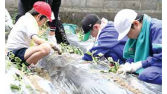
▼暑さも忘れ真剣に苗植えを行っていました

6月16日、大任小学校5年生がのぞみの里の人との交流会を行いました。この交流会は大任小学校の伝統行事の一つで平成14年から始め、今年で12年目になります。