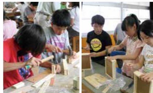
▼大任小5年生の作業風景 ▼今任小4・5年生の作業風景

7月14日と16日の2日間、町内の小学校で、まちづくり手弁当の会が主催する木工教室が開催されました。