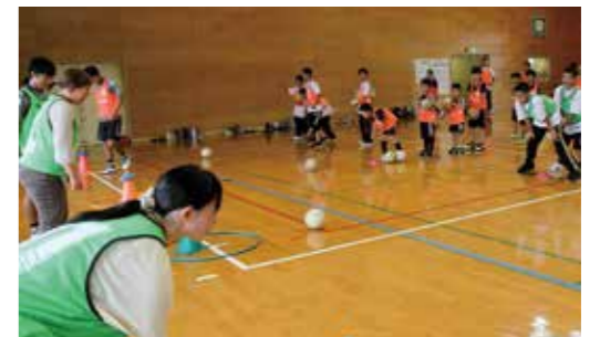
▼チームで協力し、高得点を狙っていました

7月13日、B&G体育館で健康づくり地域交流フェスタが行われました。このフェスタはアビスパ福岡のコーチと一緒に地域・世帯の交流を深めることが目的。