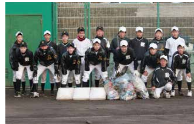
▲きれいになった球場で優勝目指して一生懸命練習を頑張ります