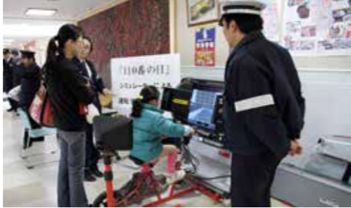
▼前後左右を振り返って安全確認をしていました

1月10日、110番にちなんだこの日道の駅おおう桜街道で田川警察署による警察の広報キャンペーンが行われました。