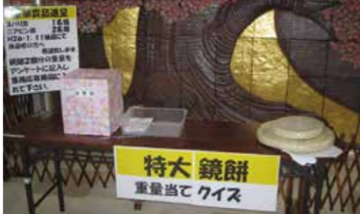
▼多くの人々が来場してクイズに参加していました

1月11日道の駅で巨大鏡もち重量当てクイズの当選者発表を行いました。特大鏡もちの重さは『8,950g』でした。