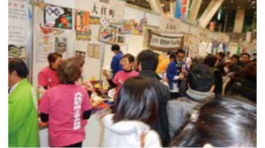
▼来場者に大任町の魅力を紹介する商工会女性部の皆さん

1月11日と12日の2日間、東京国際フォーラム(東京)で「町イチ!村イチ!2014」が開催されました。このイベントに全国から342町村が集まり、特産品など地域の魅力を盛んにアピール。