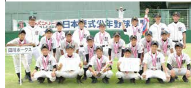
▲チームワークで3年生最後の大会を勝利で飾ることができました