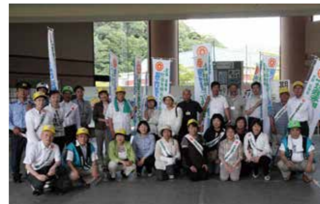
▲7月19日、役場を訪れたパレード参加者の皆さんで集合写真

犯罪や非行が生まれるのは地域社会であり、その更正を促す場も地域社会です。皆さんが、少年非行の実態を認識して、地域環境の浄化に心がけるとともに、温かい目で見守り、援助の手を差し伸べ、明るい社会を作りましょう。