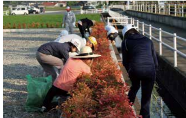
▲45リットルのごみ袋で約30個分のゴミが集まりました

大会では、追い付け追い越せと接戦を繰り広げる各チームやホールインワン賞を狙った一打などが印象的でした。また、グラウンドゴルフは、力加減が難しく、ボールが目的のところまで届かなかつたり飛ばしすぎて見失ったりしながらも、子どもたちは、競技の中でスキルアップ。喜んだり落ち込んだり豊かな表情を見せる子どもの姿に、見守る保護者たちからは笑顔がこぼれていました。