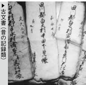
ふるさと館に集められた資料 昔の田植えの写真 古文書(昔の記録類)

まうと、元通りにならず、町の歴史を考える上で大きな損失となります。これまでも、年一回このコーナーで、情報や資料の提供について町民の皆さんへ呼びかけたところ、多数の農機具や写真などの資料とともに多くの情報が寄せられ深く感謝しています。 皆さんから提供いただいた収集資料については、清掃や燻蒸、整理作業などを経て保存、活用(公開や展示)を行っています。お寄せいただいた情報については、資料を理解するうえで重要なものもあるので、記録として残して残っています。 資料については、後世に残すことを前提にしているので、保存を最優先としています。しかしながら、保