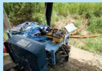
▲作業の様子を知るための機械を設置