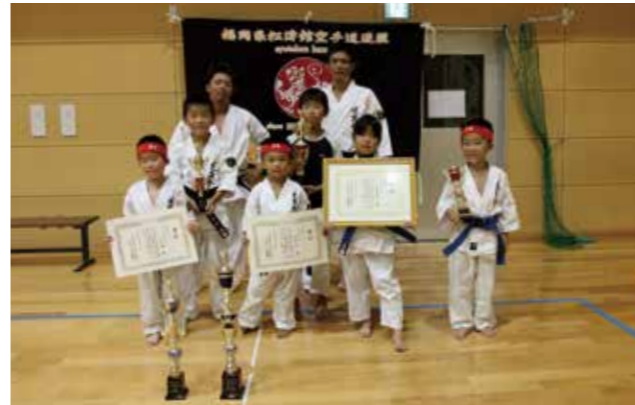
▲川崎東小学校で暑い中元気がいっぱい練習を頑張っている選手たち

この大会へは、5月に開催された福岡県消防救助技術大会で優秀な成績を修めたチームが出場できるものです。種目はロープブリッジ救出で、迅速さや安全さ、正確さを競い、29チーム中12チームが入賞。田川地区消防本部救助訓練隊も、猛暑の中、厳しい訓練を行ってきた成果を十分に発揮し、見事入賞することができました。