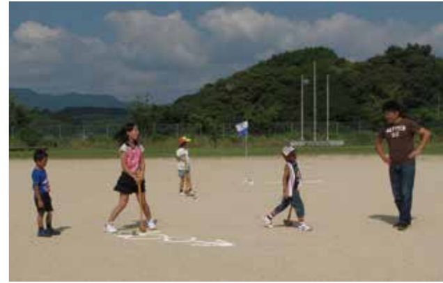
▼晴天の中ゴールをじっくり見定めて慎重な一打を狙う大会参加者

夕方とはいえ暑い中でしたが、駐車場内はもちろん、植木や溝の中まで汚れることも気にせず熱心に清掃活動を実施。今回の活動は、夏祭りの前に会場周辺をきれいにすることが目的で、参加した若い職員の一人は「せっかく遠くから来てくれる人もいるのだから、気持ちよく利用してもらいたいです。」と元気に話していました。