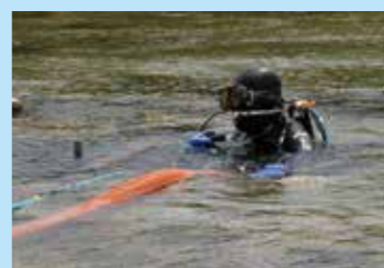
▲潜るのは1人で4人交代制の作業

町の中では一番古く、40年以上稼働し続けている中鶴水源。8月に設備のメンテナンスが行われました。これは定期的に行われている大切な作業です。簡単に紹介しますのでご覧ください。 ☎水道課 ☎63・3293 ① 水源付近に設置されたテントには、ダイバーと会話のできる機械があり、安全面にも注意を払っていました。 ② 取水井からダイバーが長いホースを持って潜り、掃除機のように使って、管内にたまった不要物を除去していました。 ③ 潜って作業している人をフォローする人が2人。ホースを延長したり、必要なものを渡したりと協力していました。 ④ たくさんの砂が吐き出される様子。管の中に不要物がたまる、水道水の供給に支障をきたす可能性があります。