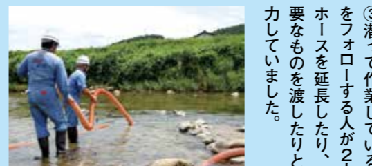
▲5日間の作業で約40m 2 のゴミを除去