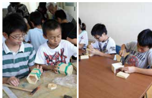
▲大任小学校5年生の作業風景 ▲今任小学校5・6年生の作業風景