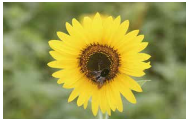
▲努力が実り見事に花開いたヒマワリに蝶がそっと身を寄せていました