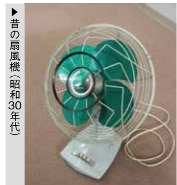
▶昔の扇風機(昭和30年代)

れ、爆発的な売り上げを伸ばしました。ふるさと館には、昔の扇風機2台が保管されています。一つは戦後すぐに造られたもので、ほとんどの部品が鉄でできています。風量調節はレバー式で芝浦製作所製のものです。もう一つは昭和30〜40年代に造られた東芝製のものです。風量調節がボタン式、羽の部分が一部むき出しで、羽の部分が子どものころ手を入れて遊んでいたら、親に怒られたのを思い出しました。