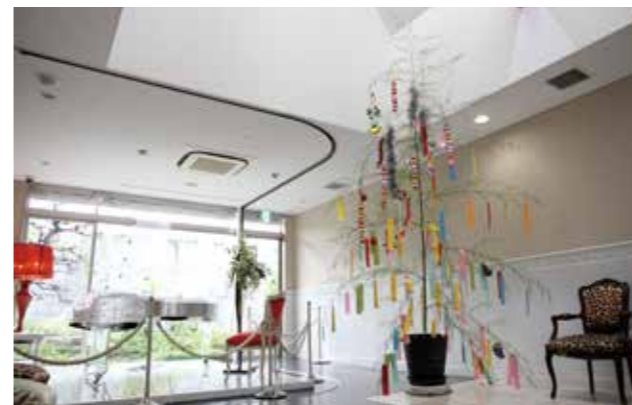
▲クリスタルピアノの側で圧倒的な存在感をみせていた美しい七夕飾り

この飾りは、町内の小学校2年生60人と道の駅おおとう桜街道の関係者など合わせて約80人が、それぞれの願いを込めて書いた短冊を吊りし、協力して飾り付けたものです。短冊には、健康に関することや将来の夢、友達のことについてなど、多種多様な願いが書かれていました。この人目を惹く飾りに、通る人も興味津々でピアノの音色をBGMに足を止めて眺めていました。