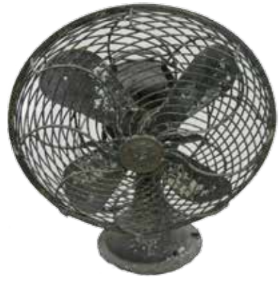
▲昔の扇風機(昭和20年代)

扇風機というと一般的に電気で動くものを言います。扇風機の歴史は、19世紀後半にモーターの発明とほぼ同じくしてアメリカで登場しました。日本では、アメリカの技術を基に明治27年(1894)に芝浦製作所(現在の東芝)が開発したものが国内における扇風機の元祖といわ