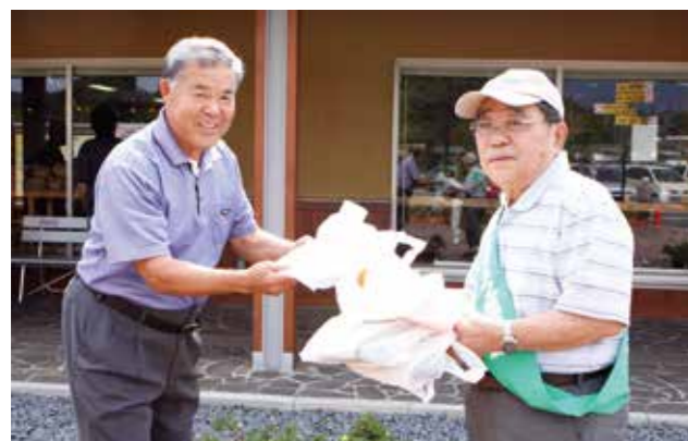
▲道の駅おとう桜街道もみじ館を中心に安全運転を呼びかけました

大任町では、21日に交通安全協会や田川警察署、町内各団体などによる交通安全啓発パレードを実施。パレードの途中道の駅で、反射材の着用や子どもと高齢者の交通事故防止などを呼びかけるチラシやグッズを配布しました。