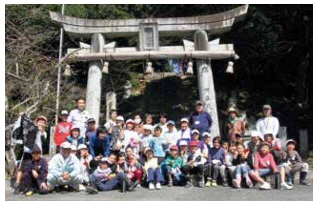
▲最後は参加者全員で笑顔いっぱいの集合写真を撮影しました

この日は、11月に予定している芋掘りのための除草作業が行われ、数人ずつ各グループに分かれて「きゃーっ変な虫取ってー」「先生分かりませーん」などと児童たちの声が響きながら、みんなで協力して作業。休憩中には、児童と通所者が好きなスポーツや食べ物などについて和気あいあいと交流していました。