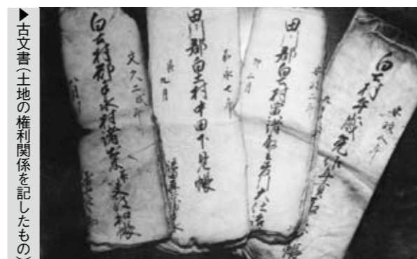
▶古文書(土地の権利関係を記したもの)