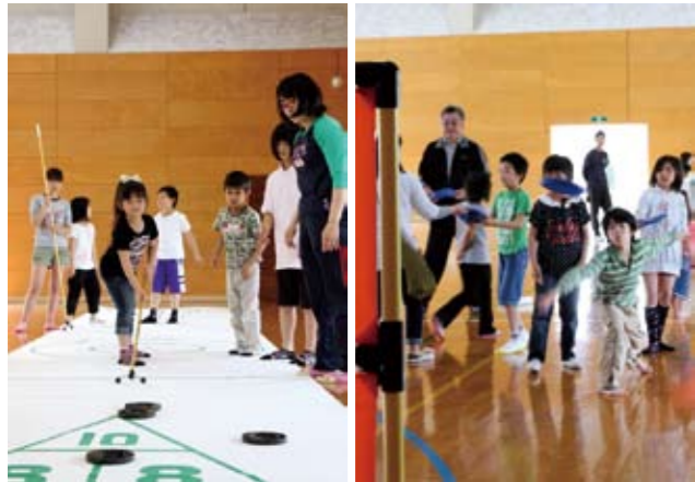
▲力加減が難しいシャッフルボード ▲狙いが大切なヒットだ・ターゲット

今回子どもたちが仲良く楽しんだニュースポーツは、ディスクをスティックで押し進めて得点を競うシャッフルボードと、1から9までの数字が書かれた的を打ち抜くヒットだ・ターゲット。会場は「やったー」「むずかしい」などと、楽しそうにはしゃぐ子どもたちの声で満ちあふれていました。