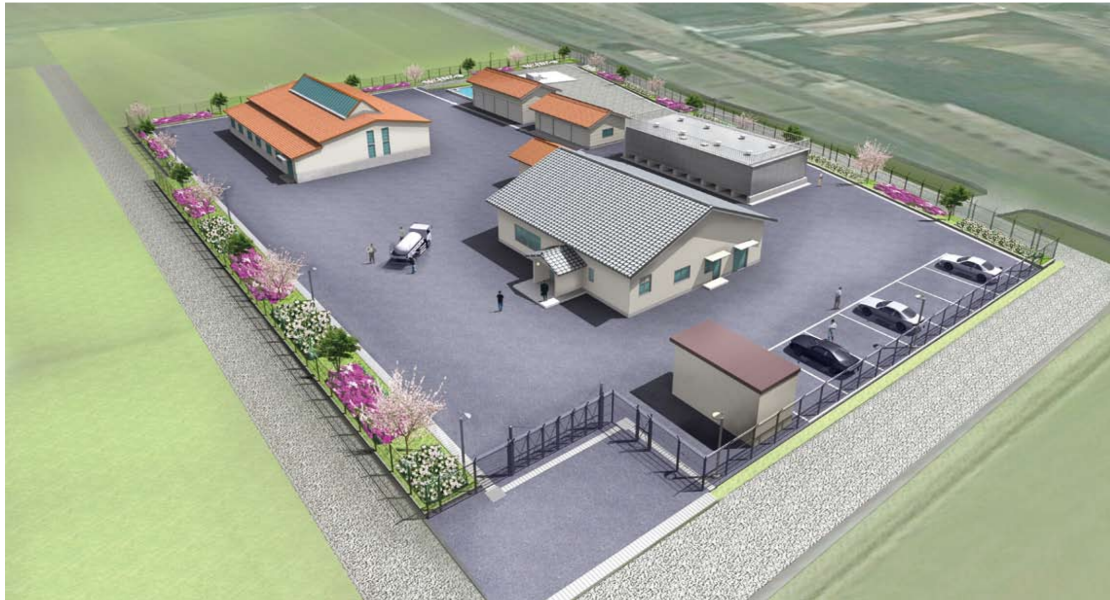
島台浄水場完成予想図

さて、今回は新しく建設中の浄水場についてです。近年、水不足や老朽化の問題で、夜間断水や水道管破損など町民の皆さまにはご迷惑をおかけしたことと思います。新たに水源を確保し、職員ともども安心・安全な水を安定供給する努力をして参りますので、よろしくお願いします。