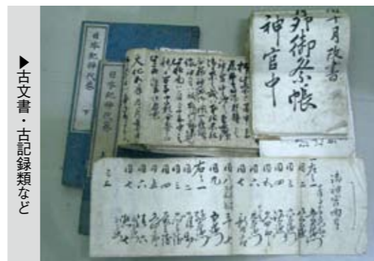
▶古文書・古記録類など

おとう史学では、町内の文化財、歴史に関するお話しについて分かりやすく紹介を行っています。今月号は、先月号の資料の提供のところで紹介した古文書についてくわしくふれてみたいと思います。古文書と一口にいっても、広い意味と狭い意味で使われます。広い意味でよく使われるのは古い文書のことをさして言う場合です。狭い意味では、通常特定の相手を対象に自分の意思を伝達するために作成されたもの、分かりやすく説明す