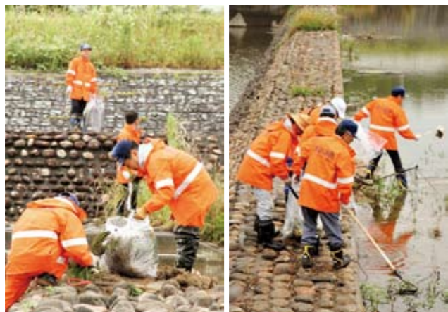
▲長靴を履き彦山川の中に入って清掃活動を行う隊員たち

約1時間半の清掃活動で集まったゴミは、空缶を中心に45リットルの袋約20枚分。「今後はもっと大きな活動にしていく予定で、一般隊員にも声をかけています。また、3ヶ月に2回のペースで続け、田川市郡8市町村を年内に回りたと思っています。」と、隊員の一人が話してくれました。