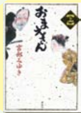
おまえさん 宮部 みゆき 編