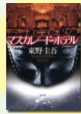
マスカレード・ホテル 東野 圭吾 著