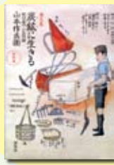
炭鉱に生きる 地の底の人生記録 山本 作兵衛 著