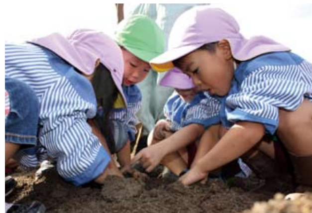
▼園児たちは短時間でたくさんのサツマイモを収穫しました