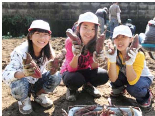
▲大切に育てたサツマイモ。こんなに大きくなりました

10月31日、大任小学校5年生の児童と精神障害者通所授産施設 のぞみの里の関係者と通所者との交流会が桑原地区で行われました。この日行われたのは、児童が大切に育ててきたサツマイモ掘り。軍手をはめた児童は、次々と土を掘り起こし、中から大きなイモが出てくるときに歓声をあげ、交流を深めながら楽しく収穫していました。