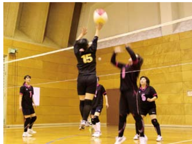
▲寒さも吹き飛ばすような試合が繰り広げられました

手に汗を握る試合の結果、Aパートはじょうやま、BパートはコラージュAが見事優勝に輝きました。