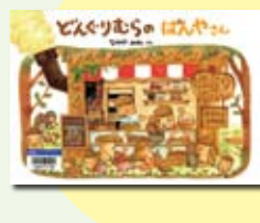
どんぐりむらの ぱんやさん なかやみわ 著