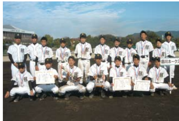
▼今大会で準優勝し大任町で活動している田川ホークスの選手たち