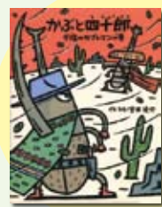
かぶと四十郎夕日の カブトマンの巻 宮西 達也 著