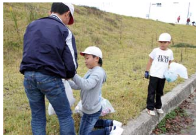
▲児童たちは町内の隅々まで丁寧にゴミを拾いました

児童たちは7つのグループに分かれて、大任町総合運動公園、柿原地区、島台地区など町内の7ヵ所でゴミ拾いを実施。隅々までゴミを拾った結果、空き缶やペットボトル、お菓子の袋など多くのゴミが集まりました。