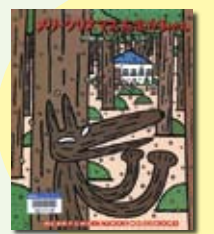
メリークリスマス おおかみさん みやにしたつや 著