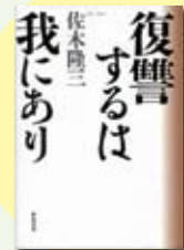
復讐するは我にあり 佐木 隆三 著