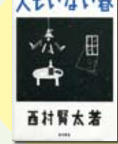
人もいない春 西村 賢太 編