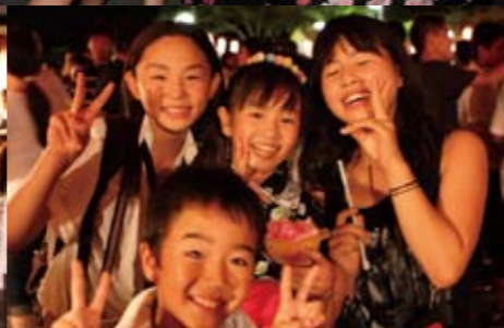
口説きと太鼓の音が響き渡る中、盆踊り花火大会の会場には、たくさんの方が訪れ思い思いに祭りを楽しんでいました。