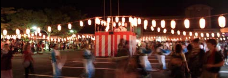
踊り愛好会、商工会、町民のみなさんが盆踊りを踊りだすと、やぐらのまわりは大きな輪が出来上がりました。