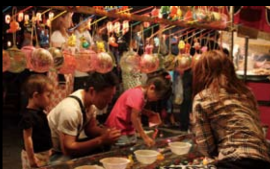
会場には夜店が並び子どもたちは大興奮。

8月18日、「盆踊り花火大会」が開催され、あいにくの曇り空でしたが、会場となったレインホールは熱気帯びていました。夕暮れ時、会場には綿菓子やくじ引きなど夜店が立ち並び、祭りの雰囲気醸し出していました。辺りが薄暗くなるにつれ、会場に飾られたちょうちんの明かりが浮かび上がり始めると、浴衣姿の家族連れや友達同士、恋人同士の人たちで会場はにぎわいました。