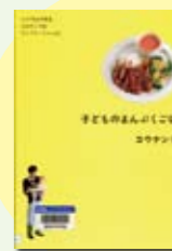
まぶくごほん コウケンテツ著