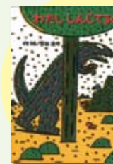
わたししんじてるの 宮西達也著