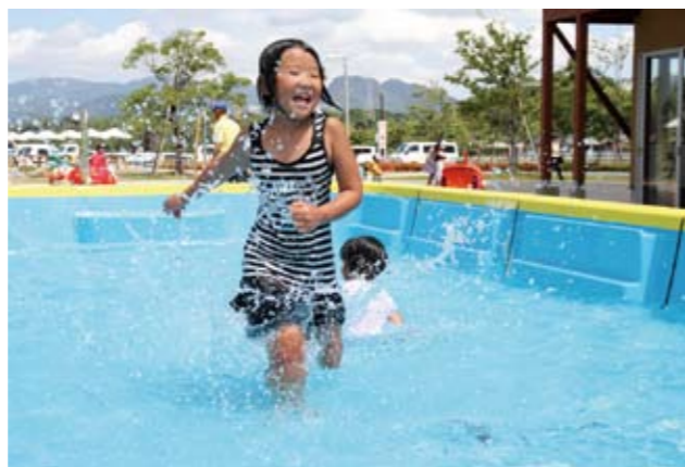
▼子ども広場のキッズプールで夏を満喫する子どもたち

競技の結果、見事優勝したのは、道善子ども会チーム、準優勝は峰子ども会チームでした。なお、優勝・準優勝チームは、8月21日に大任町民グラウンドで行われる、田川郡子ども球技大会へ出場し、優勝を目指します。