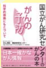
がんの予防 津金昌郎監