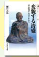
変貌する清盛 樋口大祐作