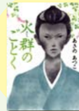
火群のごとく あさのあつこ著