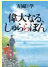
偉大なる、しゅららぼん 万城目学著