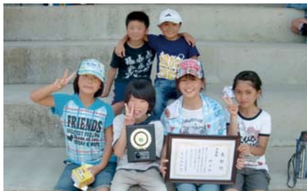
▲優勝した道善子ども会(写真上)、準優勝した峰子ども会(写真下)