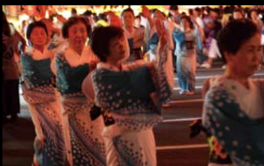
おおう音頭やきよしのソーラン節なども踊られました。