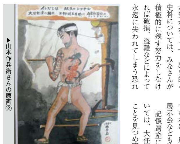
山本作兵衛さんの原画① 山本作兵衛さんの原画②