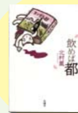
飲めば都 北村薫著