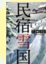
民宿雪国 樋口毅宏 著