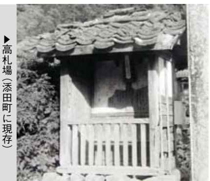
▶高札場(添田町に現存)

田川地区にはお触書を掲示する高札場が香春、油須原、添田、猪膝、採銅所の5カ所にありました。高札場は、縦横1間(1.8メートル)、奥行き3尺(0.9メートル)ほどの大きさの建物で、その中に御触書が掲示されていました。田川地区に