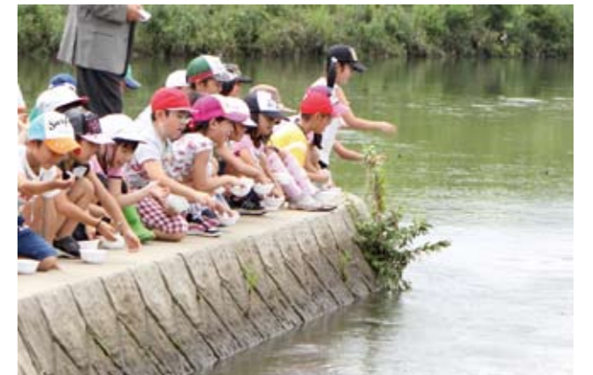
▼児童一人ひとりの願いを込めてしじみを川へ放流しました