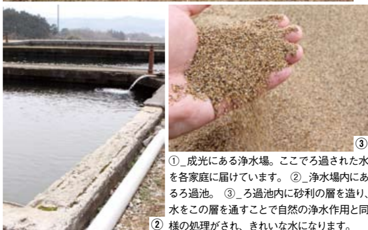
① 成光にある浄水場。ここでろ過された水を各家庭に届けています。② 浄水場内にあるろ過池。③ ろ過池内に砂利の層を造り、水をこの層を通すことで自然の浄水作用と同様の処理がされ、きれいな水になります。