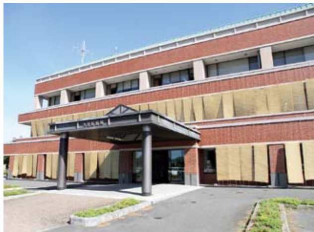
▲空調の使用を控えるため、庁舎に取り付けられたすだれ

期間中、これらの制限により、みなさんにご迷惑をおかけしますが、ご理解とご協力をお願いします。