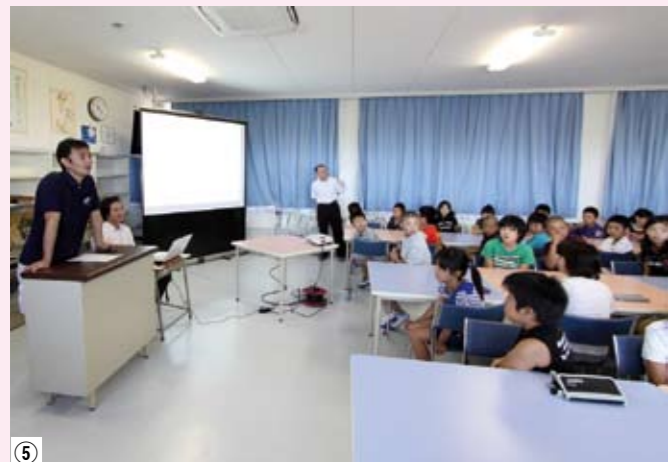
④⑤⑦⑧_大任・今任小学校の5、6年生を対象に被災地の悲惨な状況、今被災地に必要なことなどの話が行われ、真剣な面持ちで聞く児童。 ⑥_震災の犠牲者のめい福を全員で祈りました。