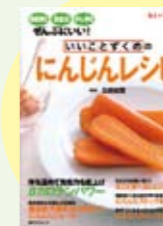
いんじんとレシビ 石原結實 監