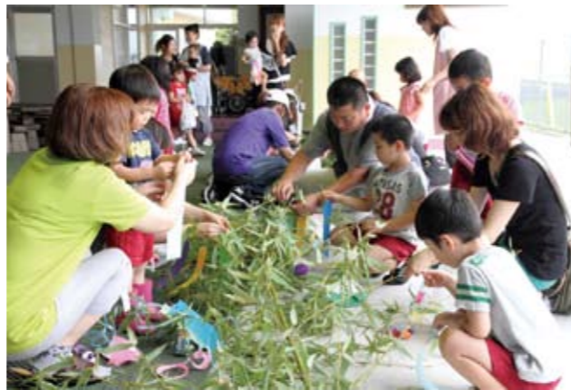
▼願いがかなうようにと心を込めて短冊をササに結びました