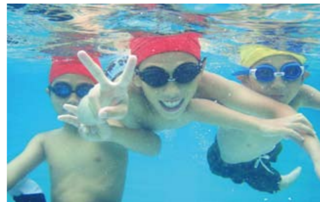
▲21日は、曇り空でしたが子どもたちは元気にプールで遊んでいました

例年、今任小学校では夏休み中にプールの開放を行っています。大任小学校では昨年校舎などの耐震補強工事のためプールの開放は見送られていましたが、今年から両小学校で夏休み中のプールの開放が始まりました。7月21日、大任小学校のプールが開放され夏休みが始まった子どもたちは、プールに訪れ「冷たい」などと声を上げて元気いっぱい水遊びをしていました。なお、プールの使用は行政区で割り当てがありますので、小学校で確認してご利用ください。