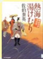
熱海湯けむり 佐伯泰英 著