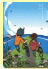
県庁おもてなし課 有川浩 著