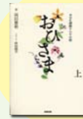
おひさま 岡田恵和 著