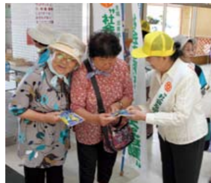
▼道の駅でチラシを配り理解と協力を呼びかけました