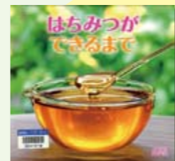
はちみつができるまで 藤原誠太 監