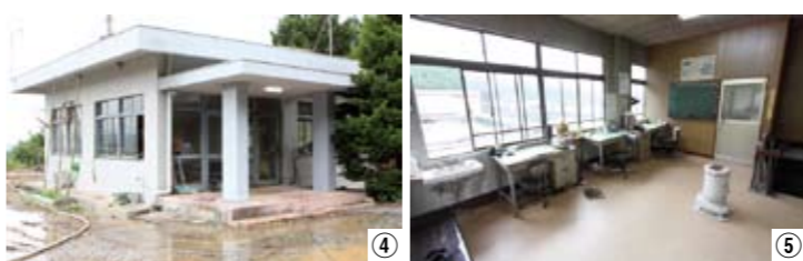
④⑤ 浄水場の管理棟。職員が交代で常駐し、水道水に含まれる塩素濃度などを検査しています。また、配水管からの水漏れがないかなどの保守点検をしています。