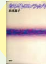
ホワイトエレファント 出光真子 著