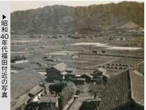
▶昭和40年代福田付近の写真

りにならず、町の歴史を考へるうえで大きな損失となります。これまでも、このコーナーで、資料の提供について町民のみならずへ呼びかけたところ、多数の農機具や写真などの資料とともに多くの情報が寄せられ深く感謝しています。 みなさんから提供していただいた収集資料については、清掃、燻蒸、整理作業などを経て保存、活用(公開、展示)を行っています。 資料については、後世に残すことを前提にしているので保存を最優先としています。しかしながら、保存するだけではせっかくの貴重な資料を見ていただくことができない