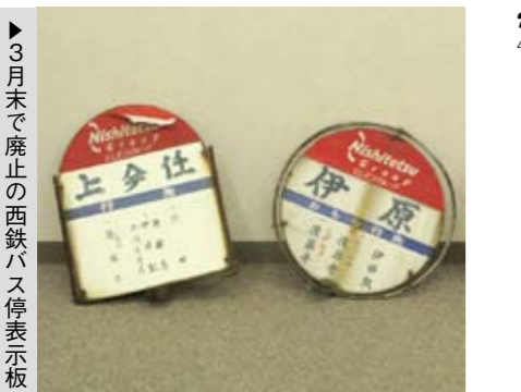
▶3月末で廃止の西鉄バス停表示板

りにならず、町の歴史を考へるうえで大きな損失となります。これまでも、このコーナーで、資料の提供について町民のみならずへ呼びかけたところ、多数の農機具や写真などの資料とともに多くの情報が寄せられ深く感謝しています。 みなさんから提供していただいた収集資料については、清掃、燻蒸、整理作業などを経て保存、活用(公開、展示)を行っています。 資料については、後世に残すことを前提にしているので保存を最優先としています。しかしながら、保存するだけではせっかくの貴重な資料を見ていただくことができない