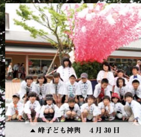
▲峰子ども神輿 4月30日