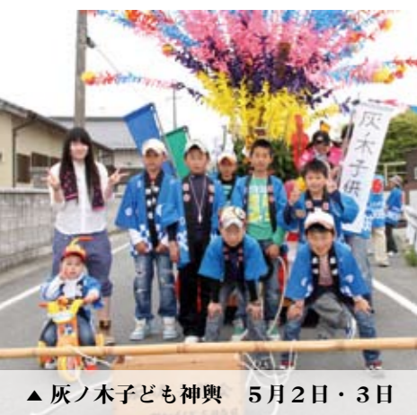
▲灰ノ木子ども神輿 5月2日・3日