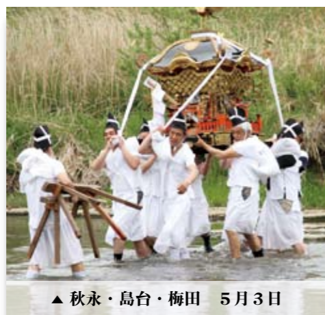
▲秋永・島台・梅田 5月3日