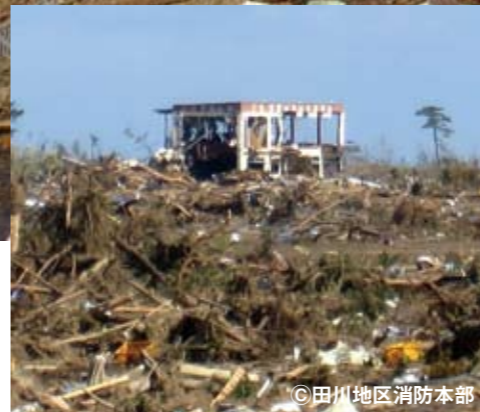
▲津波で家屋などは流され、自動車学校の建物だけ残された被災現場の写真。

日本中に激震が走った 東北地方 太平洋沖地震 もうすぐ3カ月が経過する「東北地方太平洋沖地震」。現在も各方面でさまざまな支援活動などが行われています。今回、現地で救助活動を行った田川地区消防本部の5人の隊員から取材させていただきました。