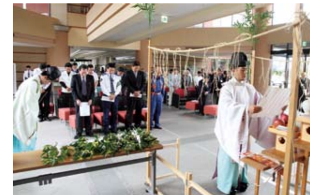
▲交通事故防止の決意を新たに、今年1年の交通安全を祈願しました

式典終了後は、町内の街頭パレードなどを行い、運転中の人たちに交通安全を呼びかけました。一人ひとりが交通マナーを守り安全運転をお願いします。