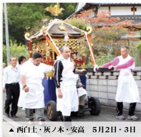
▲西白土・灰ノ木・安高 5月2日・3日