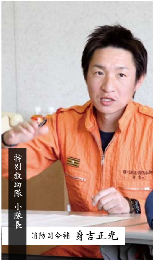
特別救助隊 小隊長