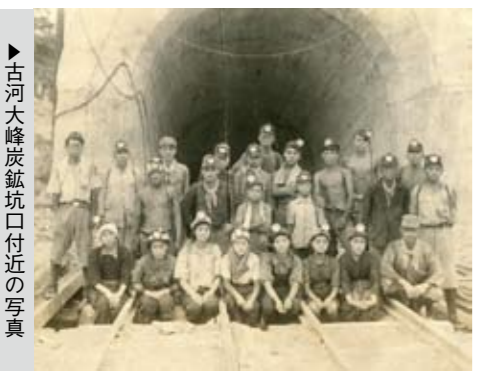
▶古河大峰炭鉱坑口付近の写真

これらの資料については、近年家の建て替えや古いものの整理や処分などで一度に大量に失われてしまいます。一度失われてしまうと、元通