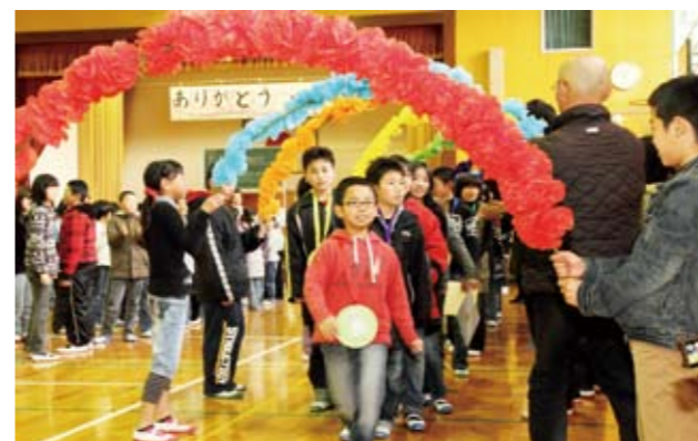
▲1年生から5年生の催しは6年生にとって最高の思い出になりました

その感謝の気持ちに6年生は、合奏や合唱を披露。催しの最後は1年生から5年生でアーチを作り、保護者も盛大な拍手で6年生を見送りました。