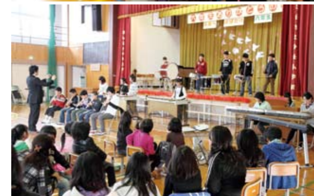
▲6年生も感謝の気持ちを込め、合奏や合唱などを披露しました