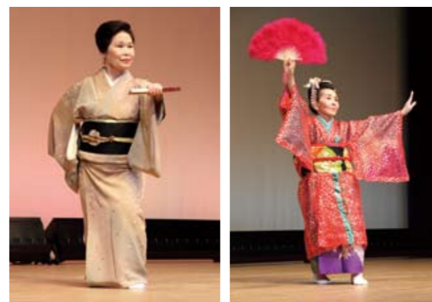
▲日ごろの練習の成果を發揮し、会場に訪れた人を楽しませていました

また、少しでも被災地のためにと、会場には義援金箱が設置され募金を募っていました。