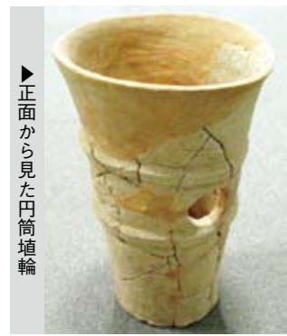
▶正面から見た円筒埴輪

朝顔形埴輪は町内唯一の前方後円墳である狐塚1号墳(平成19年7月号 おおとう史学20話)のすぐ近くで出土したものです。高さ