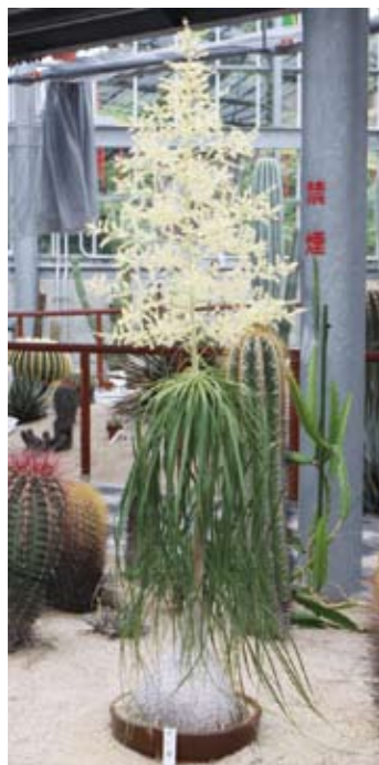
▲見事な花を咲かせサボテンハウスでひととき目立っていました

6月中旬から7月上旬の間、サボテンハウス内で数十年たたないと花をつけない珍しい「トックリラン」の花が、今回初めて開花しました。