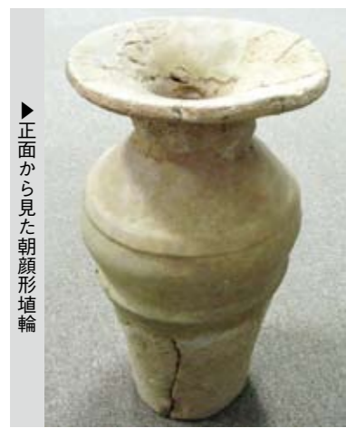
▶正面から見た朝顔形埴輪

埴輪は、日本の古墳時代(今から1700年前から1300年前)に使われたものです。古墳時代特有の素焼きの焼きもので、古墳の上に立てて使われました。埴輪は大きく円筒埴輪、形象埴輪の2種類に