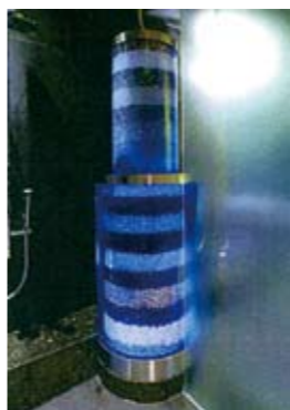
▶薬石ミネラルシャワー

薬石浴で出る汗は皮脂腺からもです。皮脂腺から出る汗は重金属などの有害物質を排出します。体内の有害物質を排出できれば、美容と健康が回復します。皮脂腺から出る汗は塩分がないためサラサラですが有害物質がふくまれていますのでミネラル湯または温泉できれいに洗い流してください。皮脂腺の開いているときだけは石けんシャンプーなどはつかわないようにおすすめします。