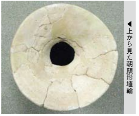
◀上から見た朝顔形埴輪

分けられます。円筒埴輪は円筒形をしたもので、古墳の盛り土の土留めと、お墓という聖域を区画する役割を持っていると考えられています。 今回取り上げる朝顔形埴輪は円筒埴輪の一種です。形象埴輪は人物や動物、家、器財(武器や道具)をかたどったもので、古墳の埋葬者の生前の生活をあらわしたものと考えられています。