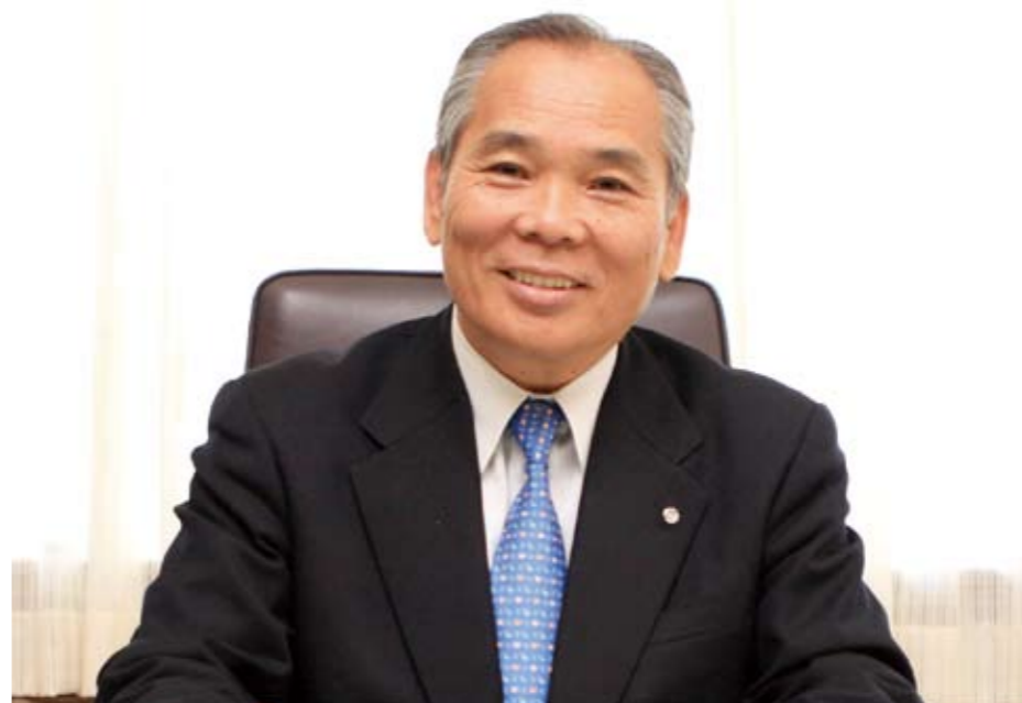
地方から県、そして国へ。田川地域の活性化につながるまちづくりを進めていきます。

田川郡の町村長と協力し合いながら田川地域の活性化の原動力となり、より一層役務を果たしていきます。