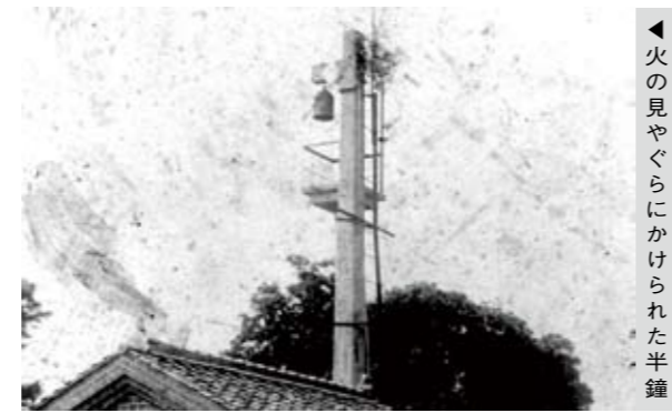
◀火の見やぐらにかけられた半鐘

半鐘は高さ52センチ、直径30センチ、重さ24キログラムほどの大きさで、銅製です。