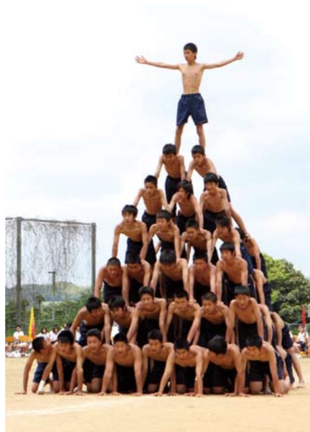
▲みんなで一致団結し見事7段ピラミッドを完成させました

今回、種から育ててきたマリーゴールドとコスモス、アゲラタムの3種類をポットに移植。中学3年生が中心となって、慣れない手つきの児童や園児たちに優しい指導のもと、一緒に仲良く花の苗の植え替えを行いました。