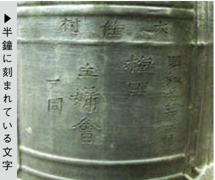
▶半鐘に刻まれている文字