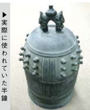
▶実際に使われていた半鐘

半鐘は小型の釣鐘のことで、火の見やぐらの上部にかけられ、火事や洪水などの災害時、消防団の召集や人々に危険を知らせるためのものです。戦時中には空襲警報を知らせる時にも使われました。地城によっては時報を知らせたりもし