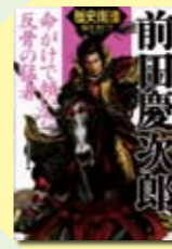
前田慶次郎 歴史街道編集部編