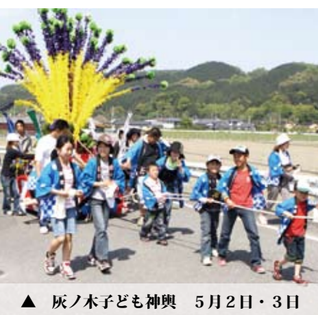
▲ 灰ノ木子ども神輿 5月2日・3日