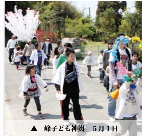
▲ 峰子ども神輿 5月1日