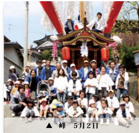
▲ 峰 5月2日