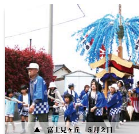
▲ 富士見ヶ丘 5月2日