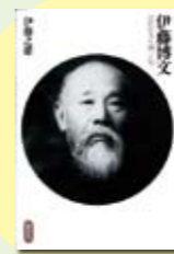
伊藤博文 伊藤之雄著