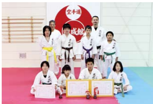
▲ 練習の成果を十分に発揮し好成績を残した武成館