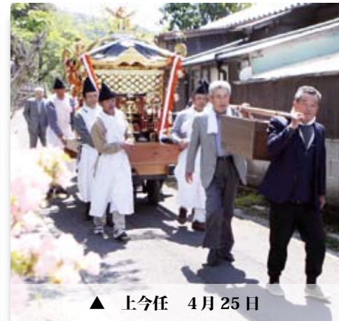
▲ 上今任 4月25日