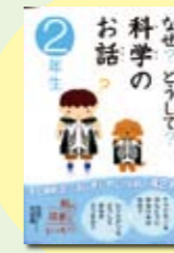
なぜ? どうして? 科学のお話 コスモピア著