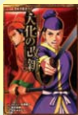
大化の改新 水合俊樹著