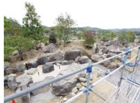
▲北側から見た建設途中の露天風呂