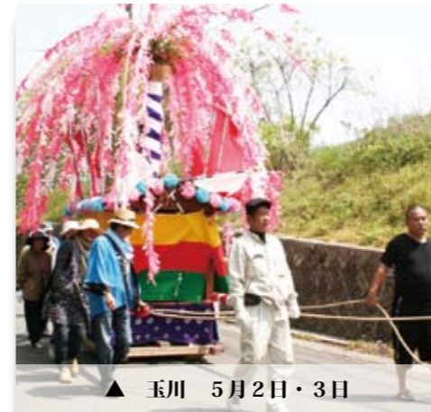
▲ 玉川 5月2日・3日