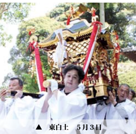
▲ 東白土 5月3日