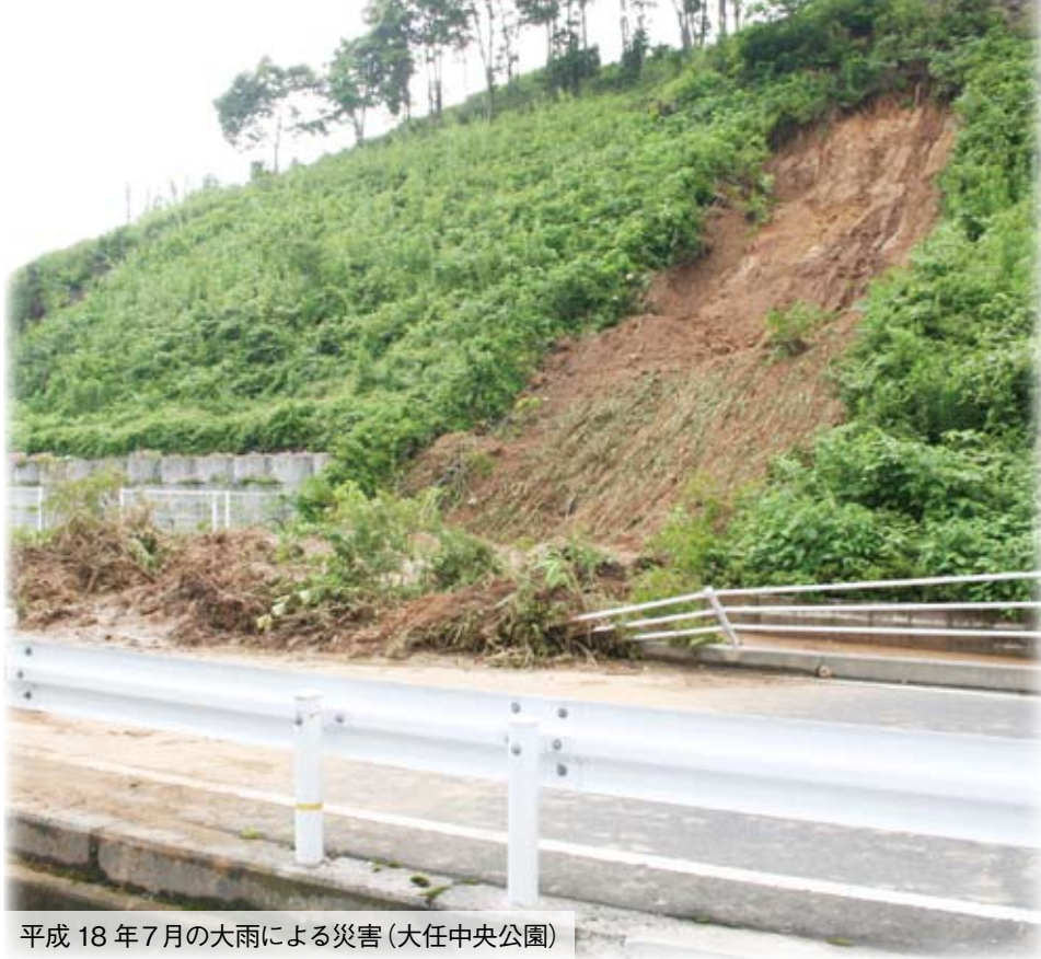
平成 18 年 7 月の大雨による災害 (大任中央公園)