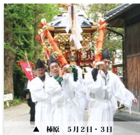
▲ 柿原 5月2日・3日