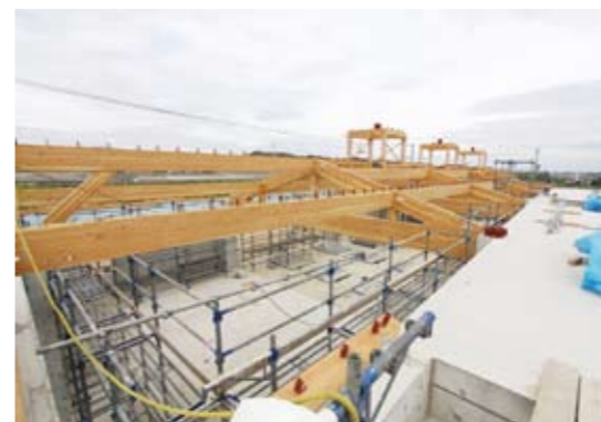
▲温浴施設内のできる休憩・食事処の工事風景