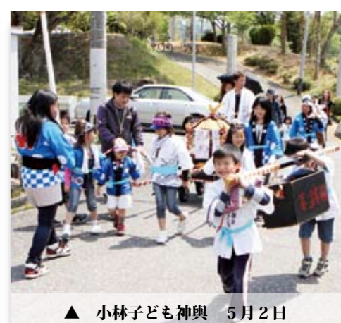
▲ 小林子ども神輿 5月2日