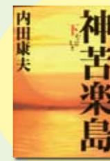
神苦楽島(下) 内田康夫著