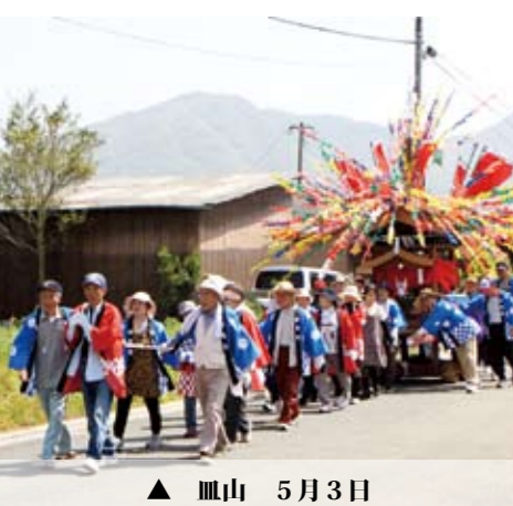
▲ 皿山 5月3日