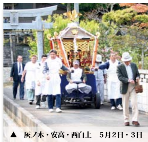
▲ 灰ノ木・安高・西白土 5月2日・3日