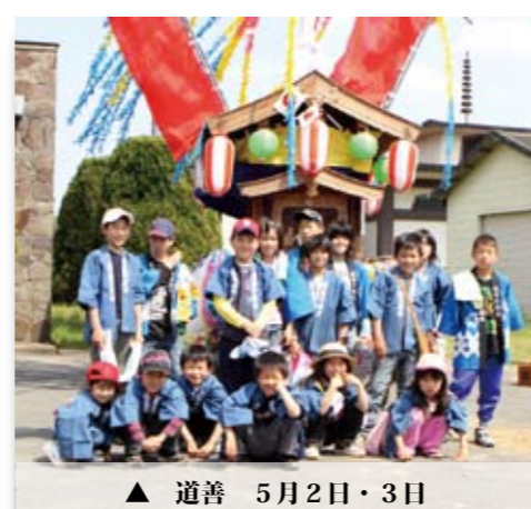
▲ 道善 5月2日・3日