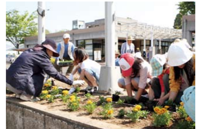
▲ 一つひとつ丁寧に花壇に植えていきました

今年も多くの人たちが協力してくれたおかげで、作業は短時間で終わりました。この花がレインボーホールや公園に訪れた人たちを癒してくれるでしょう。