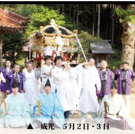
▲ 成光 5月2日・3日