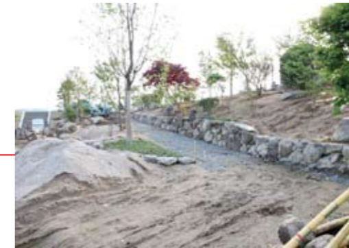
▲物産館から温浴施設につながるスロープ

建設工事が始まってもう半年。現在、温浴施設・物産館の屋根工事や、露天風呂造園工事が急ピッチで進行しています。工事の進行状況は写真のとおりとなっております。