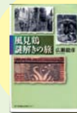
風見鶏謎解きの旅 広瀬毅彦著