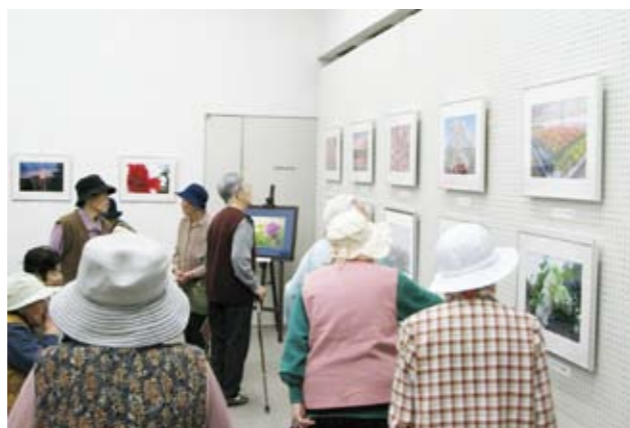
▲ 写真を見ながら町内に咲いたきれいな花に感動する見学者たち

開催中は町内外から300人以上の見学者が来場。訪れた見学者たちは写真を見入っていました。