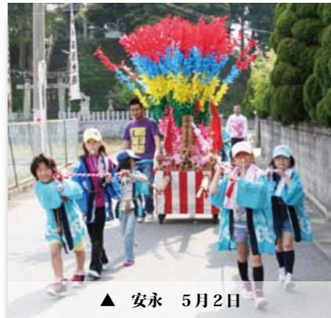
▲ 安永 5月2日