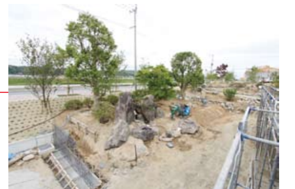
▲物産館施設(食事処)から見た造園工事風景