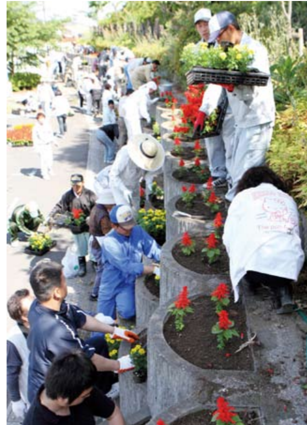
▲ 中央公園の花壇にもたくさんのきれいな花を植えました