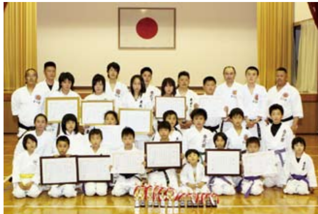
▲ 5月から新たに3人が入門し、さらに活気にあふれた春武館