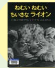
ねむいねむい ちいさなライオン マーガレット・ワインライオン 著