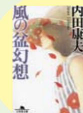
風の盆幻想 内田 康夫 著