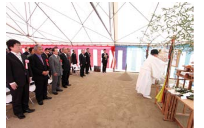
▲平成22年秋のオープンに向け工事中事故がないよう祈願しました

工事期間中、町民のみなさまには大変ご迷惑をおかけいたしますがご理解とご協力をよろしくお願い致します。