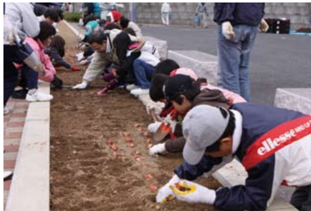
▲きれいなチューリップが咲くようにみんなで協力して植えました

作業は1時間で終わり、この日に植えられた球根は、春には鮮やかな色の花を咲かせて、道行く人の目を楽しませてくれるでしょう。