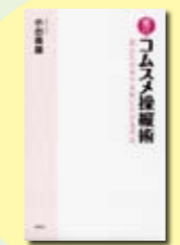
愛のコムスメ操縦術 小出 義雄 著