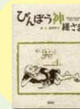
びんぼう神 高草 洋子 文