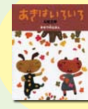
あきはいろいろ 五味 太郎 著