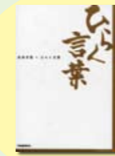
ひらく言葉 武田 双雲 著