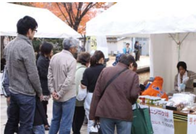
▲公園に多くの人が足を止め、特産品を買い求めていました

大任町もこのイベントに参加し、ゆずこしょうや手作りお菓子など特産品の販売や観光パンフレットの配布などを行いました。公園には買い物客など多くの人が足を止め、特産品を買い求めていきイベントは大盛況でした。