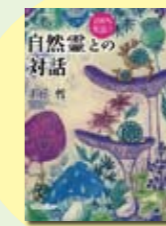
自然靈との対話 上丘 哲 著