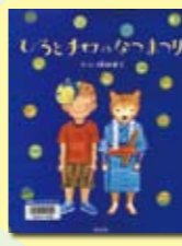
ひつじのなまじり 成田 雅子 作