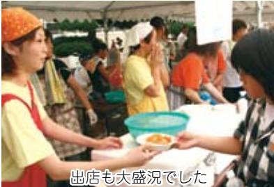
出店也大盛況でした