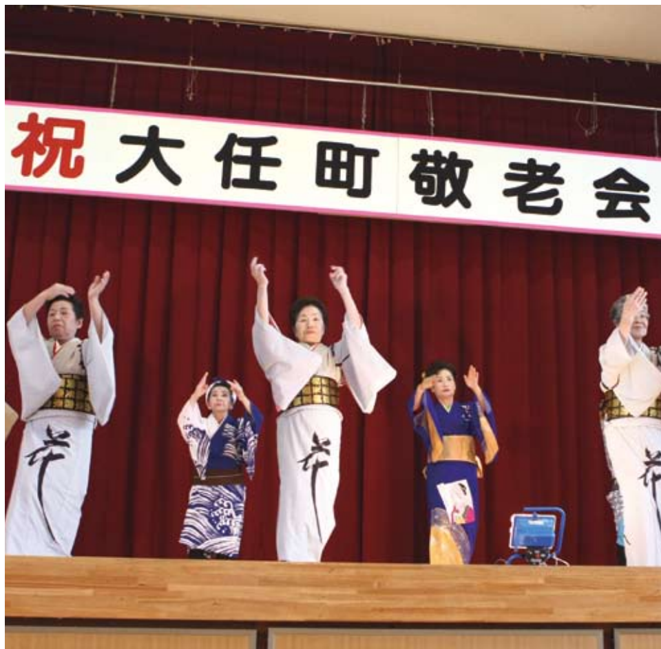
踊り愛好会のみなさんは華麗な舞で お年寄りの長寿を祝いました

また、111を横書きにすると「川」とも読めるため、111歳のお祝いを川寿 せんじゅ ともいいます。