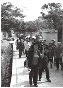
▲昨年度のバスツアー