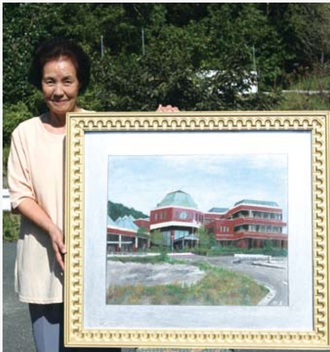
▲ 昨年の大任町文化祭に出展した作品。制作期間2カ月の大作です