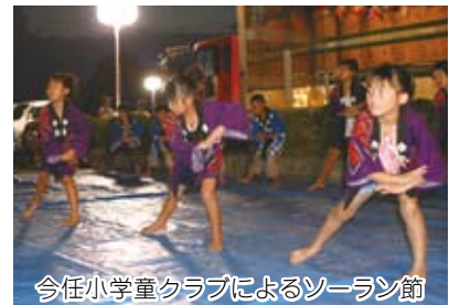
今任小学童クラブによるソーラン節