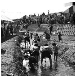
▲しじみ祭り当日は、年に一度のしじみ採りの解禁日