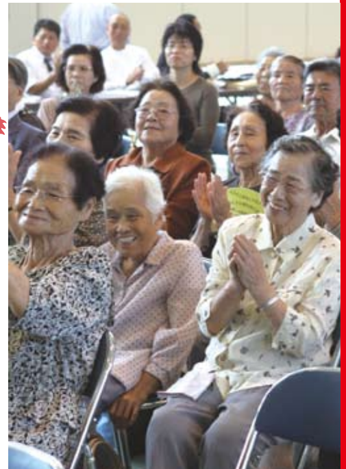
会場に訪れたお年寄りは、多彩な余興に拍手喝采(かっさい)。笑顔がこぼれます

明治、大正、昭和、そして平成。 年齢とともに刻んだシワ。 そのひとつひとつに歴史があります。 大任町の75歳以上の高齢者は883人。 健康長寿は町の誇りです。