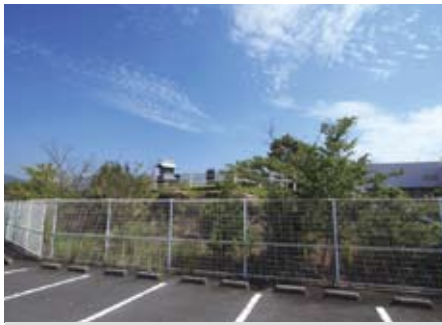
▲ 現在の御船岩。中央上部に祠が見えます

(にぎはやひのみこと)が乗っていたとされる天の磐舟が石に化したものとい伝えられています。