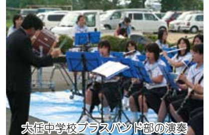
大任中学校ブラスバンド部の演奏