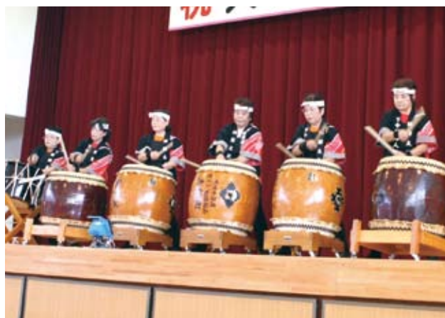
華麗なハチさばきで「天河」と「並の鼓」を披露した蛇面太鼓(右)。息を合わせて「これから音頭」を踊った健康体操舞姫(左)