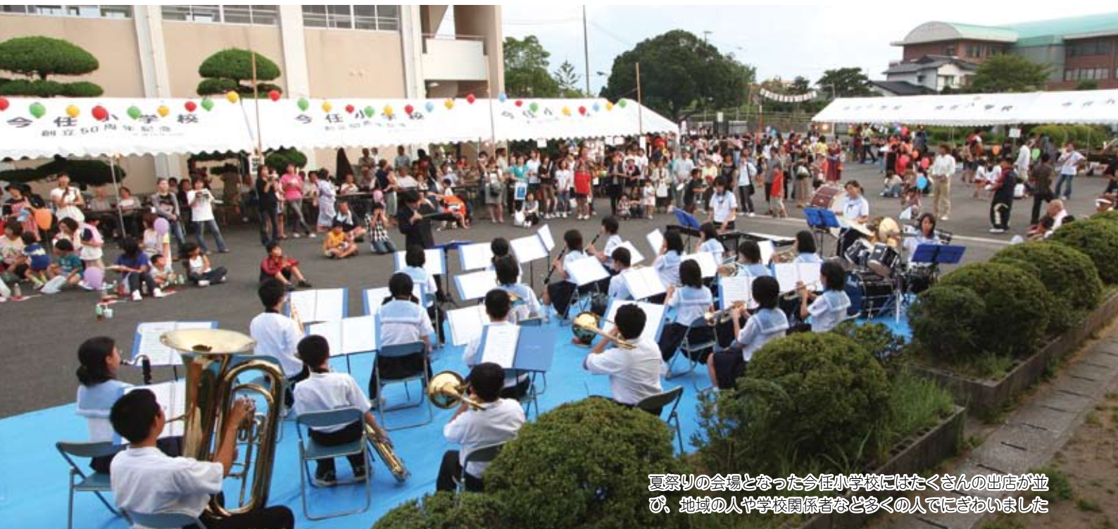
夏祭りの会場となった今任小学校にはたくさんの出店が並び、地域の人や学校関係者など多くの人でにぎわいました