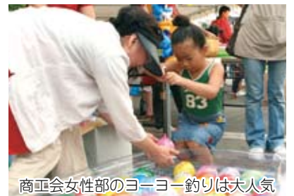
商工会女性部のヨーヨー釣りは大人気