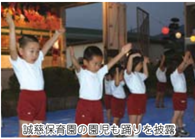
誠慈保育園の園児も踊りを披露