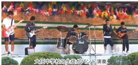
大任中学校の生徒がバンド演奏