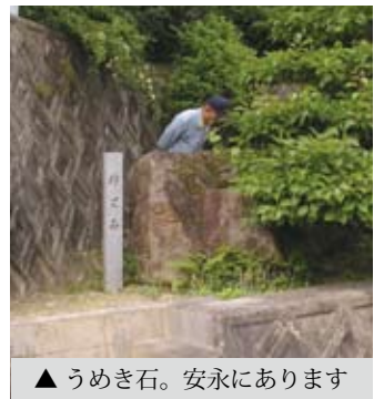
▲ うめき石。安永にあります

昔は今の県道は無く、安永地区の中を通って川崎の方へ行き来していました。この付近は家