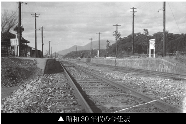
▲昭和30年代の今任駅