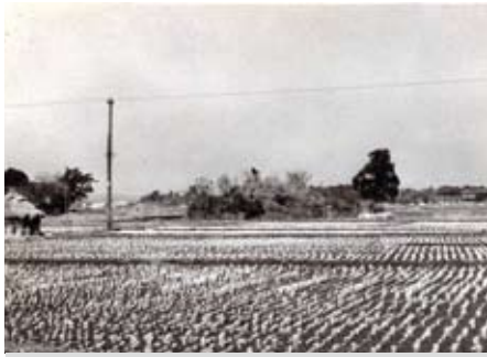
▲ 昔の御船岩。田んぼの中にぽつんとあります