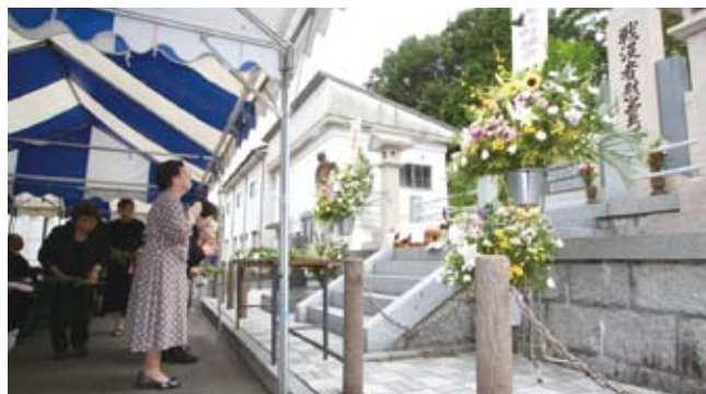
▲ 戦争の悲惨さを改めて再認識し、戦没者の冥福を祈りました

式典の最後には、参列者一人ひとりが慰霊塔前に用意された献花台に菊の花をささげ、戦没者の冥福を祈りました。