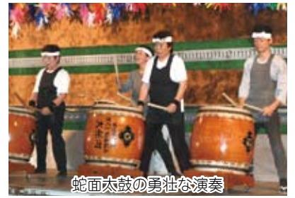
蛇面太鼓の勇壮な演奏

最後は会場に集まった人たちを交えての盆踊り。手作りで行われた今任地区の初めての夏祭りは、大盛況のうちに幕を下ろしました。