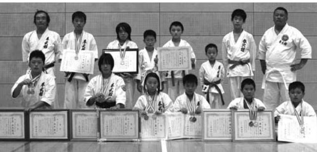
▲ たくさんの賞状とメダルを獲得しました