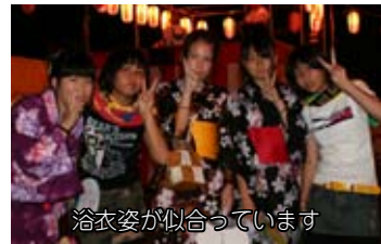
浴衣姿が似合っています