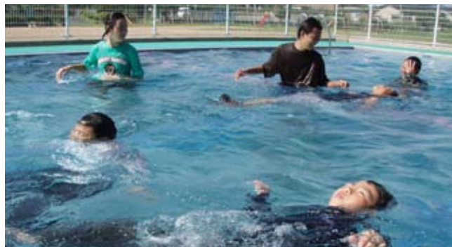
▲ 服を着て靴も履いたままで、いかに長く浮けるかがポイントです