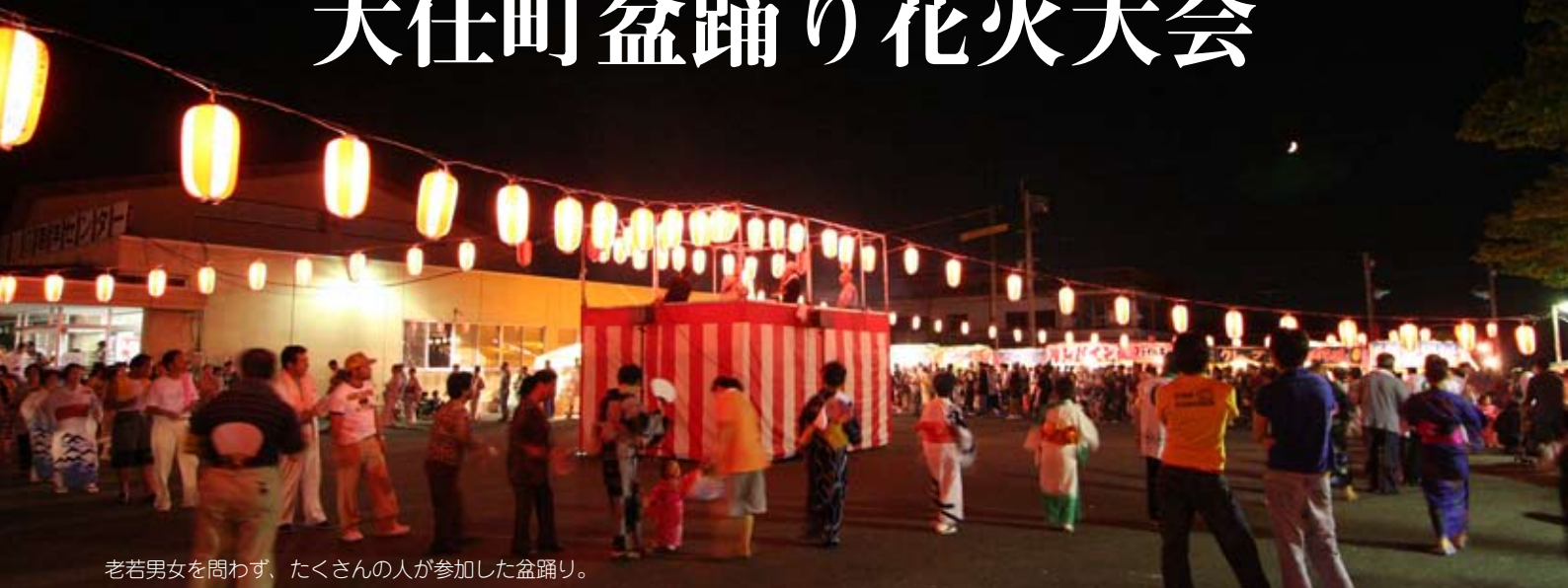
老若男女を問わず、たくさんの方が参加した盆踊り。