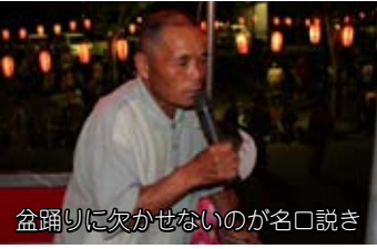
盆踊りに欠かせないのが名口説き