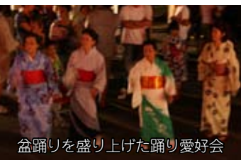
盆踊りを盛り上げた踊り愛好会