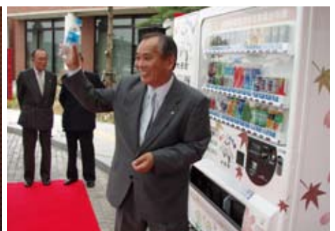
▲ 早速、永原町長自ら水を購入