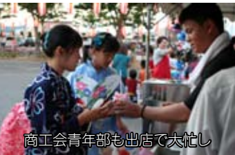
商工会青年部も出店で大忙し