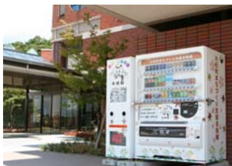
▲ 第1号機は、役場の西側に設置