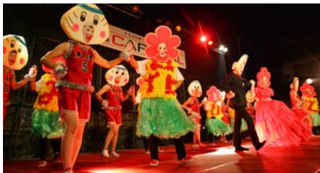
▲ 大任町をアピールした替え歌に合わせ、華麗な踊りを披露しました

結果は堂々の準優勝（賞金5万円）。商工会メンバーは「2週間ですべてを準備しました。賞金は商工会の敷地に時計台を設置する費用に充てたいです」と話してくれました。