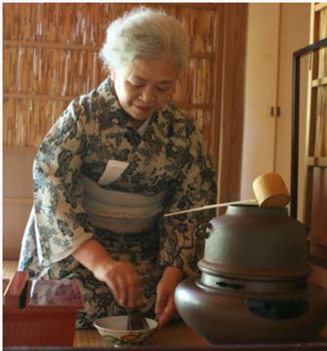
▲ 流派は表千家。茶道の名前は宗法。茶室の名前は幸法庵