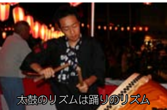
太鼓のリズムは踊りのリズム

夏の風物詩、盆踊り花火大会。 笑顔とともに踊る人々、夜空を彩る大輪の花……。 そこには確かに伝統の祭りがあった。 熱かった大任の夏の夜をレポート。