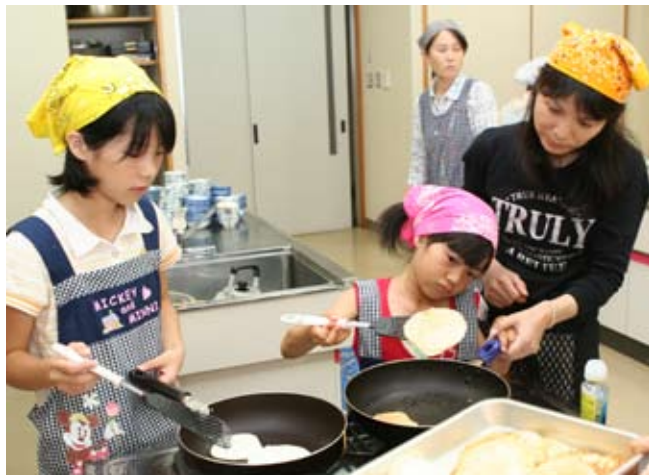
▲ お豆腐パンケーキ作り。ちゃんと焼けてるかな～？

7月26日、役場調理室で小学生とその保護者を対象に「親と子の料理教室」が行われました。この料理教室には、小学生児童9人とその保護者3人が参加。児童たちは慣れない手つきながらも、食進会の人たちや料理講師の先生の指導のもと、親子で協力して計4品の料理を作りました。作り終わった後は全員で試食を兼ねた昼食タイム。自分たちで作った料理の味はひとしおだったようで、みんな口々に「おいしい」と言いながら食べていました。