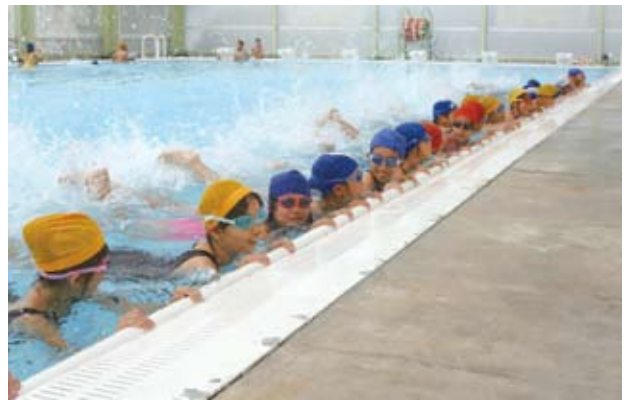
▲ 水泳の基本はバタ足から