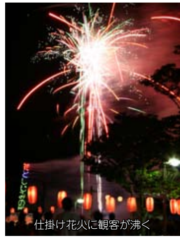
仕掛け花火に観客が沸く