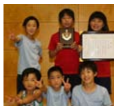
▲ 優勝した柿原チーム