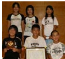
▲ 優勝した道善チーム