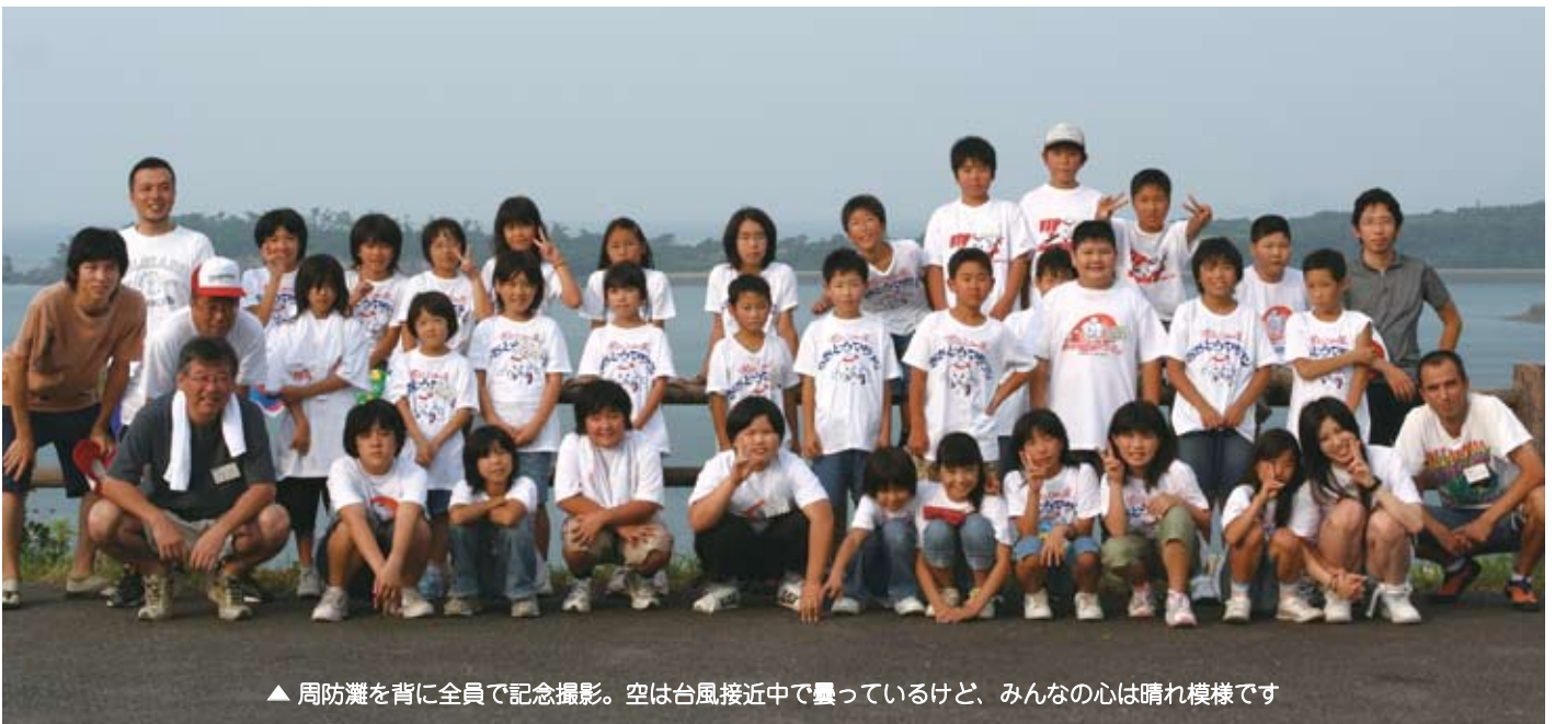
▲ 周防灘を背に全員で記念撮影。空は台風接近中で曇っているけど、みんなの心は晴れ模様です