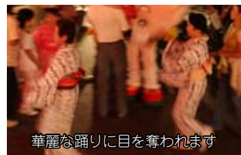
華麗な踊りに目を奪われます