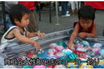
商工会女性部出店のヨーヨー釣り