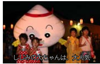
しじみの大ちゃんは、大人気