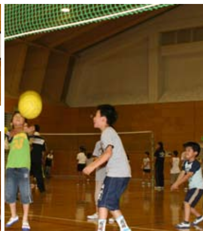
▲ 子どもたちはいつだって真剣勝負