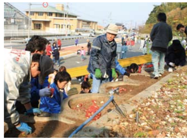
▲ 多くの方が訪れる中央公園も春に向けて準備完了です

12月2日、レインボーホールと中央公園花壇でボランティアによるチューリップの球根植えと草取りが行われました。球根植えには町民や町内の各団体など約320人が参加。協力して次々と草を抜き、花壇やプランターに約25,000個のチューリップの球根を植えました。「花いっぱいのに」とみなさんが思いを込めて植えた球根は、春には色とりどりの花を咲かせ、人々の心を和ませてくれることでしょう。ご協力ありがとうございました。