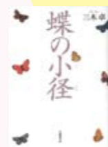
蝶の小径 三木卓著