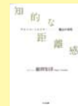
知的な距離感 前田知洋著