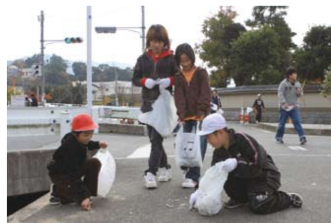
▲ 1年生から6年生までが一緒になってゴミ拾いを行いました

11月28日、大任小学校の全児童が、レインボー縦割り活動で7つの班に分かれ、校区内のゴミ拾いを行いました。児童たちは家から持ってきたビニール袋を片手に、燃えるゴミを捨てる人や燃えないゴミを捨てる人に分かれ、それぞれゴミを拾っていきました。道路や側溝に多く捨てられていたのはタバコの吸い殻。ゴミを拾っていた児童も「タバコのゴミが多い」と言いながら拾っていました。大人が捨てたゴミを子どもが拾わなくてすむように、タバコのポイ捨てはやめましょう。