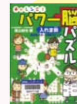
チャレンジ！パワー脳パズル入れま数 魔方陣パワーで暗算力アップ 横山 駿也 著