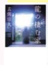
龍の棲む家 玄侑宗久著