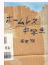
ホームレス中学生 田村裕著