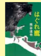
はぐれ鷹 熊谷達也著