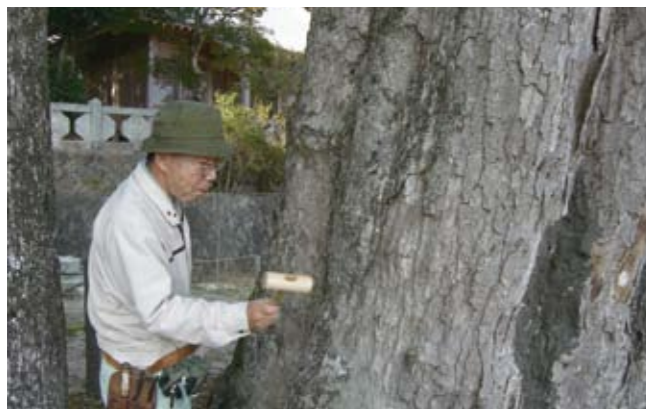
▲ 木づちでイチイガシの表面をたたき、異常がないかを調べました

11月14日、西白土にある菅原神社のイチイガシ（福岡県天然記念物）で樹木医の診断が行われました。イチイガシは、平成8年に県の天然記念物に指定され、平成9年に治療を行いました。その後の経過を見るために2～3年に1回樹木のお医者さんである樹木医に診断してもらっています。診断では、木づちで木の表面をたたいたり、土の硬さや土壌分析を行ったりしました。診断の結果、今のところは問題ないとのこと。町では、今後も貴重な文化財であるイチイガシを見守っていききたいと思います。