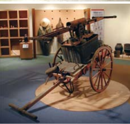
▲資料館に展示している消防ポンプ車

ポンプ車といっても自動車のポンプ車ではなく、持ち運び式のポンプ車です。正式には腕用ポンプ車といって、振り子状の腕を上げ下げすることにより、給水と同時に放水する仕組みです。ポンプ車は、長さ3.16cm、幅1.15cm、高さ1.58cmで、上部のポンプ部分と下部の荷車部分に分かれます。移動する際にはポンプ部分を荷車部分に載せ、火事場へ到着するとポンプ部分を下ろして使いました。現在、ポンプ車は町内に3台