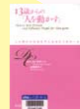
13歳からの「人を動かす」 ドナデル・カーネギー著