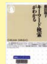
キーワード検索 藤田節子著