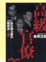
高級官僚 本所次郎著