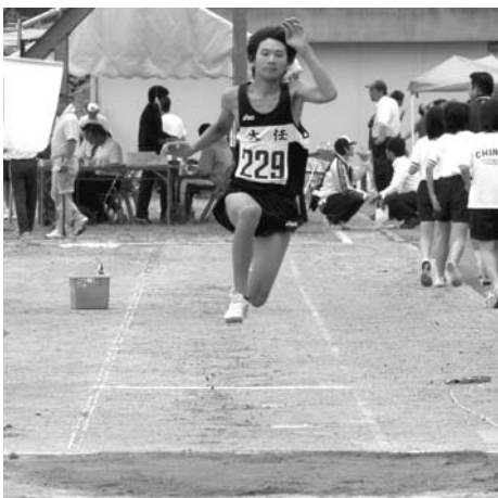
▲まるで背中に羽があるかのようです