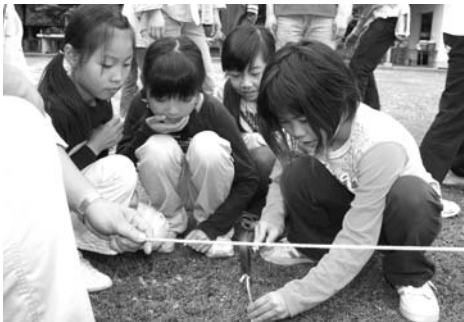
▶慎重に確実に杭を打ち込みます