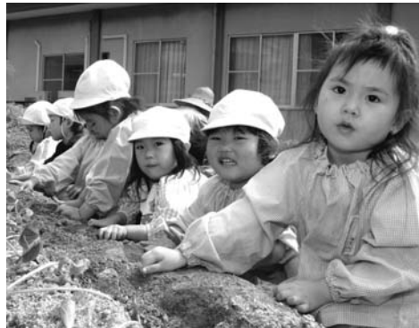
▲見て見て、上手に植えたでしょ？

6月8日に、なのはな保育所で春の芋植えがありました。芋植えに参加した園児は、ゆり組(4歳、5歳)の10人と、たんぼ組(3歳)の6人、計16人の園児たち。 園児たちは、先生に教えてもらいながら、園内の畑に次々と芋の苗を植えていきました。 今回植えた芋は、秋にみんなで収穫する予定です。おいしいお芋がたぐさんでできるといいですね。