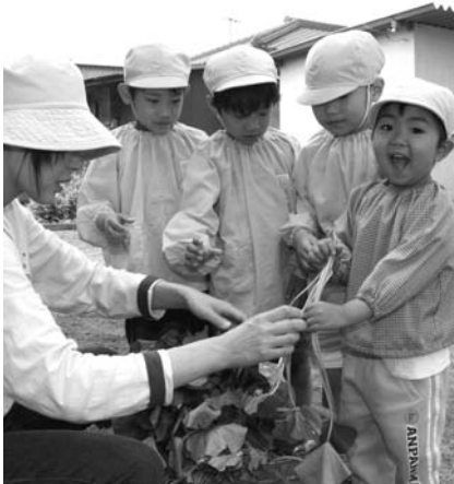
▲これがお芋になるなんて不思議だな～