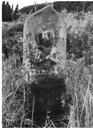
▲ 不動明王が鎮座した馬頭観音

町内各所では、どこの農家も田植えが一段落したようです。今は農作業も大半が機械化されていますが、昭和30代ごろまではあまり機械もなく、ほとんどが手作業。動力といえば牛や馬といった家畜が中心でした。農家は必ずといっていいほど牛か馬を飼っていて、田んぼを耕すときは、牛や馬の力を借りていました。今でも動力の単位を示すときに何馬力と呼ぶのはそのときの名残です。