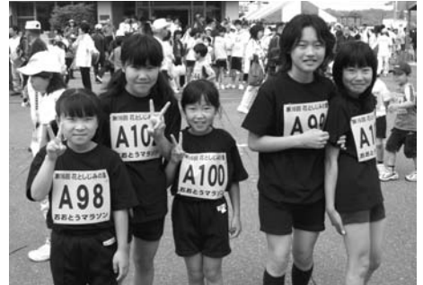
▲ 友達と仲良く参加。マラソンの前にパチリ