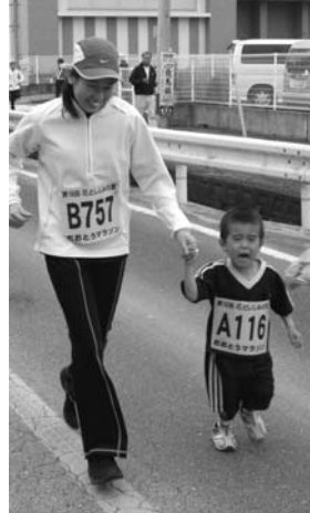
▲ 花火に驚いたのかな？

マラソンの距離は、それぞれ2キロ、5キロ、10キロの部に分かれていて、2キロから順にスタート。スタートの合図と共に一斉に選手が駆け出し、沿道からは家族や応援者が熱い声援を送りました。 自己ベストタイムの更新を目指して一生懸命走る選手。マイペースでのんびり走る選手。仲良く家族や友達と一緒に走る選手。 仮装で楽しませてくれる選手…今年もたくさんさんの選手が、それぞれのスタイルに合わせて大任路を走りました。 また会場内では、無料のしみじみ汁やポンポン菓子も振る舞わ