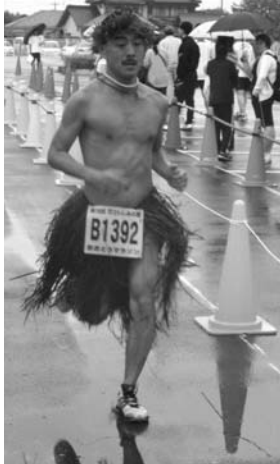
▲ アロハ姿で10キロを完走