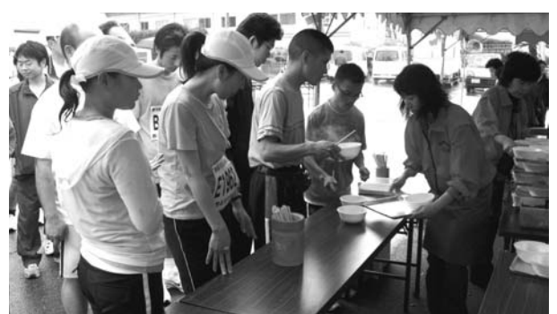
▲ 会場内の無料しみじみ汁には長蛇の列ができていました