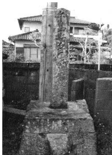
▲ 縦長の石柱型の馬頭観音

馬頭観音は福田地区に2つ残っているほか、上今任地区にも1つ残っています。福田地区のものは、2つとも台座の上には不動明王が乗っています。台座に馬頭観音と刻まれています。いずれも長年風雨にさらされているため、表面が風化し像がはつきりしません。像の1つに安政3年(1856年)とあるので、今から150年ほど昔に建てられたものであることがわかります。