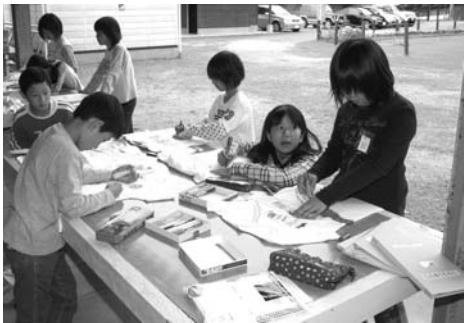
▶思い思いの絵を描きました