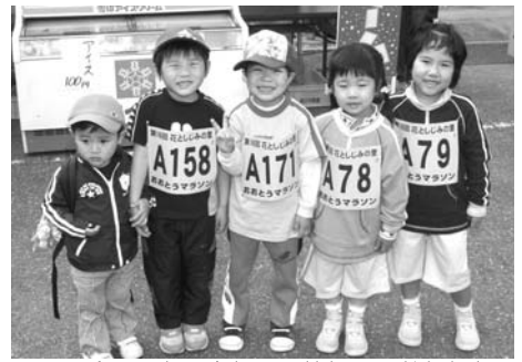
▲ 2キロの部に参加する笑顔の子どもたち