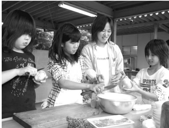
▲料理に慣れた児童もいれば、包丁を初めて使う児童もいました

6月17日・18日の2日間、大任町キャンプ場で、第17回少年野外スクールが開校しました。今年度の参加者は、大任小学校の4年生から6年生までの22人が参加。