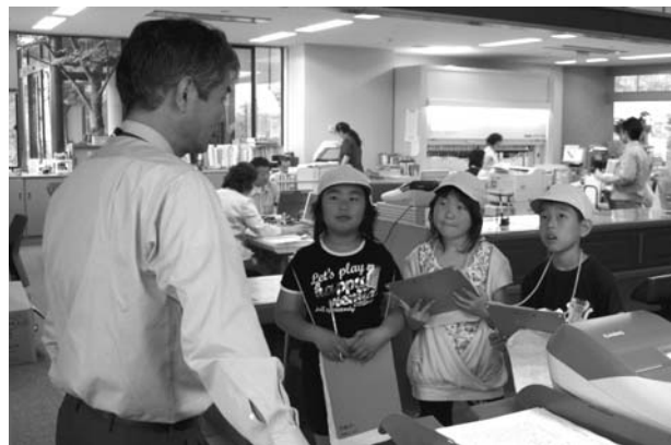
◀役場の中に、興味津々の子どもたち