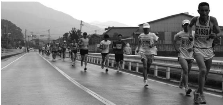
▲ 小雨の降る中、ゴールを目指して走ります（10Kmの部）

れ、選手や応援者を喜ばせていました。 大会のフィナーレを飾ったのはお楽しみ抽選会。次々と当選番号が発表され、景品が当選者の手に渡っていきま ました。なかでも、司会者から1位、3位の景品が、旅行券やデジタルカメラ、ゲーム機と発表されると、会場の雰囲気が一変。 当選番号が発表されるたびに、会場内では大きなどよめきと歓声が起こっていました。 大盛況のうちに幕を閉じたイベント。来年も多くの人が参加してくれることを願っています。