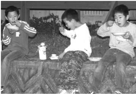
▶野外で食べるカレーは最高です