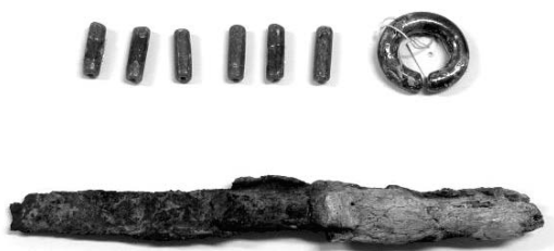
▲ 管玉 (左上)、耳環 (右上)、鹿角装刀子 (手前)

身長は160センチほどなので石室がそれほど小さいわけではありません。入口はふさがれ、天井が開いた状態で、中から刀2本や鉄鏃、矢じり、刀子、小刀、耳環、イヤリング、管玉、ネックレスなどが手つかずで見つかりました。通常、このような場合は中の品物が持ち出されていることが多いのですが、土が入りこんでいたため、幸運にも残っていたと思われるです。