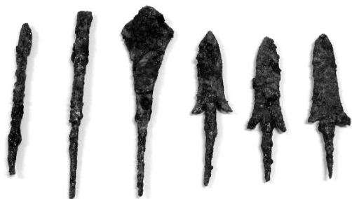
▲ 出土品。矢の先に使う鉄鏃