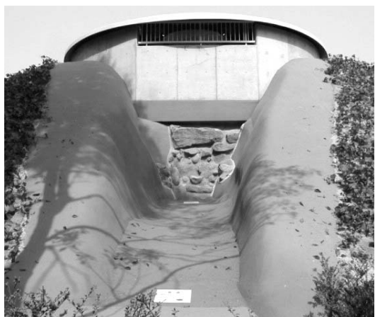
▲ 古墳の入口 (中央の石積み付近)

平成5年に発掘調査が行われ、古墳の中から死者を葬った石室が見つかりました。石室は2つの部屋があり、死者を葬った部屋は2メートル四方の正方形をしていました。狭く感じるかもしれませんが、当時の人の平均