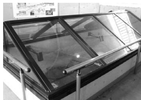
▲ 中に何があるかは、見てのお楽しみ

見学できます。現在、古墳周辺は公園として整備されています。古墳も復元され、古墳の中がガラス越しに見学できます。