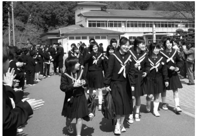
▲ 3年間の思い出が詰まった学びやを巣立っていきます

式終了後は在校生や保護者に拍手で見送られ、記念撮影をしたり、後輩から記念品を贈られる姿がありました。