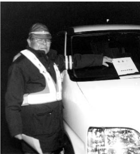
▲ 警告のチラシを貼って回り、住民のみなさんに危険性や迷惑性を説明しました