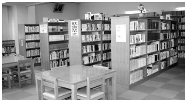
▲ ジャンルごとに分かりやすく整理された本棚