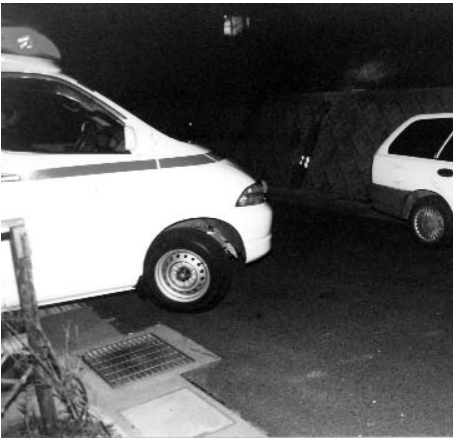
▲ これでは救急車が曲がるできません。う回するため、到着時間が遅れてしまいます