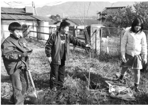
▲友達と協力して植えた桜は一生の思い出です