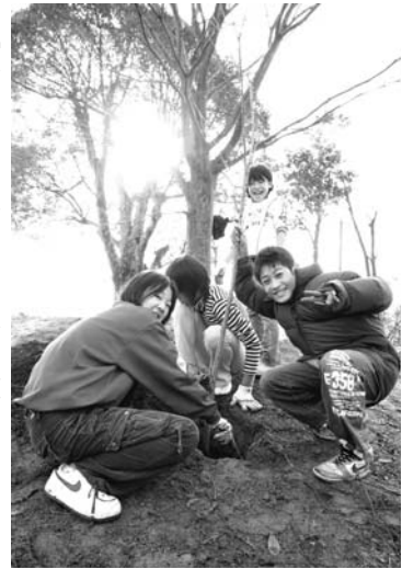
▶「大きく育ててね」と心を込めて植えました

その後、児童たちは桜の木に、1人につき1本ずつ、自分たちの名前が書かれた札を掛けました。 今回植えた桜の木は、児童たちの成長とともに大きく育ち、立派な花を咲かせることでしょう。