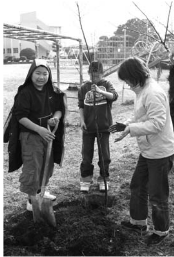
▶手を土で真っ黒にしながらか植えました