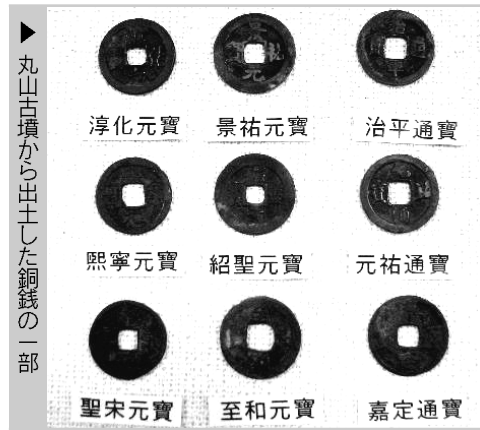
丸山古墳から出土した銅銭の一覧表