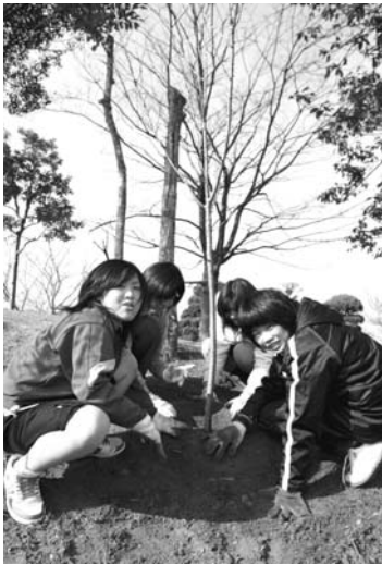
▶土で木の周りを囲って水がたまるようにしました