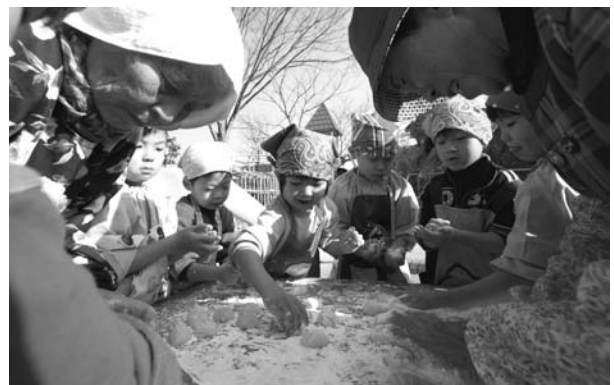
◀ ほろ、きれいに丸められたでしょ？