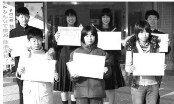
▲添田警察署で表彰を受けた7人

クローズ・アップ Close-up! — school guard leader — vol.12