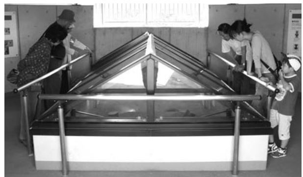
▶石室の内部を見ることが出来ます