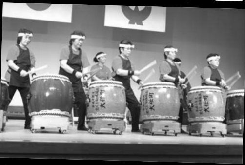
▲ 蛇面太鼓 「天河」「波の鼓」「今任ばやし」