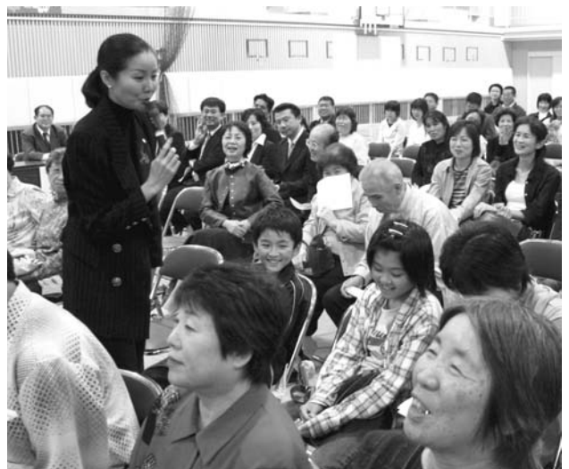
▲トレードマークの博多弁と軽快なトークで会場は大盛り上がり

そのほかにも、自らが出演するテレビ番組での体験談や裏話なども話してくれ、集まった聴衆を大いに楽しませてくれました。