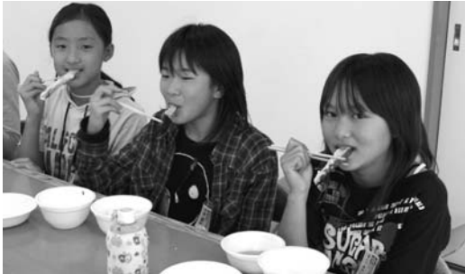
▶芋の天ぷら、おいしいよ