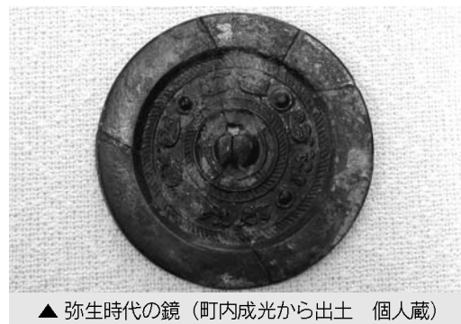
▲ 弥生時代の鏡（町内成光から出土 個人蔵）

鏡の形はあまり変化がありませんが、安土桃山時代（今から430年前）のころになると、鏡に柄がつく柄鏡が普及していきます。これは重く携帯に不便だった鏡が、柄がつくことよって持ち運びやすくなり、庶民に普及し始めた証拠です。以上、鏡について紹介してきましたが、私たちの生活に身近な物にも、こんなエピソードがあることを知っていただきたいです。