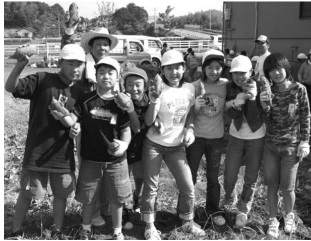
▲見て見て、こんなに大きなイモが取れたよ

11月1日、大任小学校の5年生と、精神障害者通所授産施設のぞみの里との交流会が行われました。この交流会では芋掘りや食事会、親ほく会などが行われました。