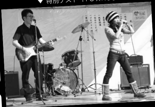
▼ 創作炭坑節を披露した「輪月」