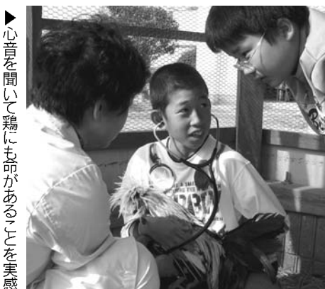
▶心音を聞いて鶏にも命があることを実感