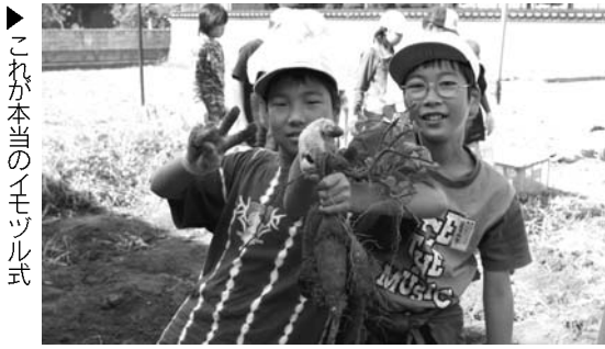
▶これが本当のイモツル式

食事会のあとは、みんなでゲームをしたり、児童たちが歌を披露したりして、楽しい交流会は幕を閉じました。