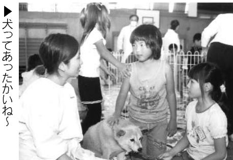
▶犬とあつたかいね

10月17日、今任小学校で1・2年生の児童を対象に、動物ふれあい教室が行われました。 まず最初に、田川市郡の動物病院の獣医たちが、犬にかまれないための対処法などを説明。 その後、実際に犬やうさぎとふれあい、心臓音の聴診、さわり方や抱き方などを体験しました。 この教室では、初めて犬に触ることができた児童もいました。 また11月14日には、鳥小屋の飼育委員の5・6年生8人を対象に飼育教室が行われました。 児童たちは鶏やインコの飼育方法を学んだり、聴診をしたりしました。 そして最後はみんなで鳥小屋をきれいに掃除しました。