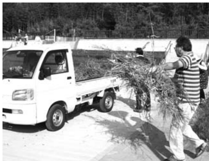
▲ ゴミ拾いや除草作業を行いました

10月28日朝、役場職員組合の約30人が、ボランティア活動を行いました。今回、除草清掃作業を行ったのは、レインボーホール横の道路と、建徳寺古墳公園内。職員たちは、約2時間にわたって花壇などをきれいにしました。