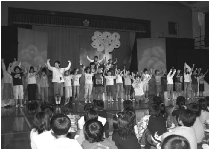
▲ 「わたしと小鳥とすずと」「きのう悲しみに出会った君は」の2曲を熱唱