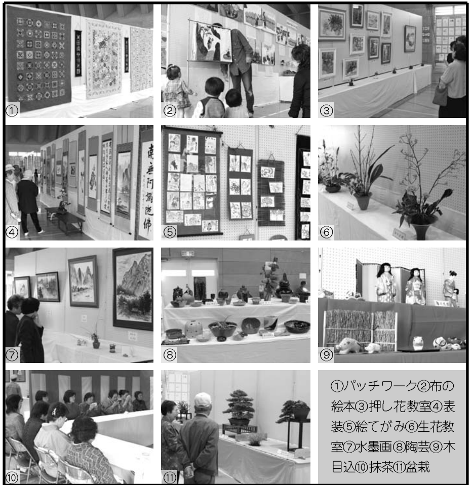
①パッチワーク②布の絵本③押し花教室④表装⑤絵てがみ⑥生花教室⑦水墨画⑧陶芸⑨木目込⑩抹茶⑪盆栽