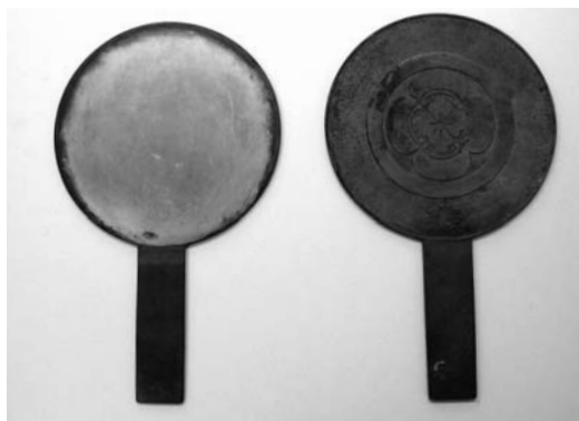
▲ 江戸時代終わり～明治時代の鏡 左が表、右が裏

よく間違われるのが鏡の表裏です。文様が描かれている方を表側と間違える人がいますが、写す方が表側で、文様がある方は裏側です。