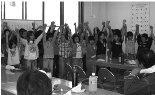
▶華麗な歌と振り付けを披露