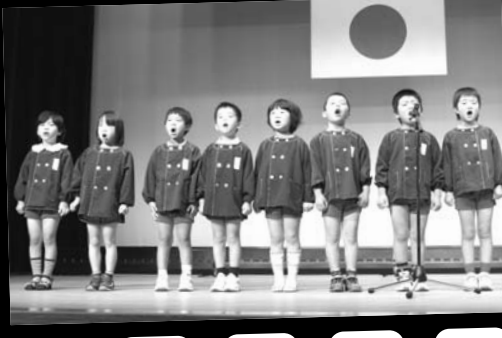
▲ どんぐり保育園 詩吟「富士山」