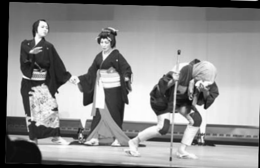
▲ 創舞 「恋のみちゆき」