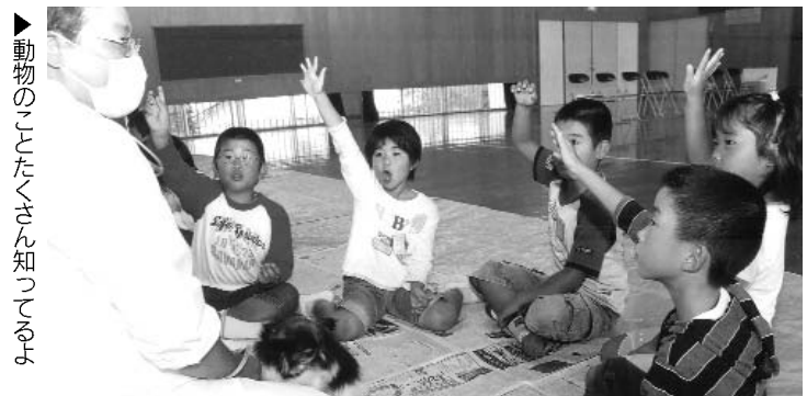
▶動物のことをたくさん知ってるよ