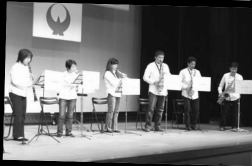
▲ 管楽器演奏 「ル・キアーヴェ」の皆さん