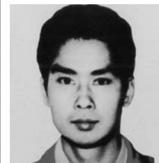
たかはし かつや 高橋 克也 地下鉄サリン事件

事件内容 (6月中) 自動販売機荒らしと自動車盗が今任原でそれぞれ1件発生しました。