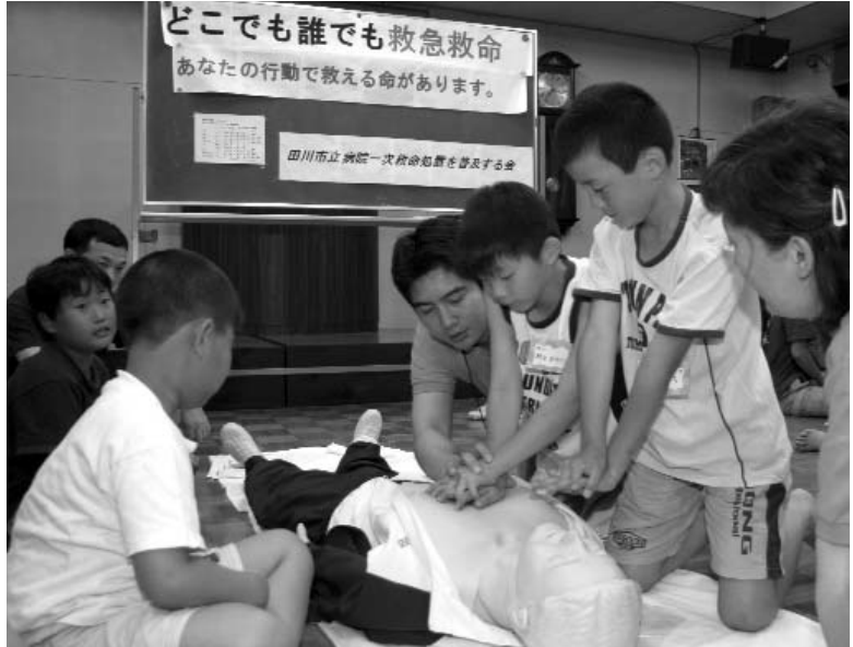
◀ 「ひびきまじすくぐくして…」と丁寧に指導してもらいました