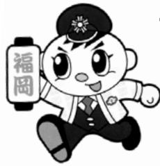
県警マスコット「ふっけい君」