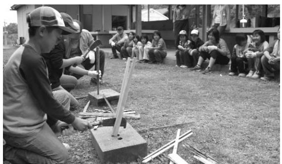
◀ みんなが注目しているマキ割り に挑戦。見事に真っ二つです

集団生活を通して、子どもたちの自主性や協調性を養う野外スクール。10月まで毎月1回の野外活動を体験し、また一段と成長した姿を見ることができそうです。