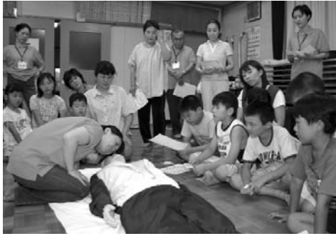
▲ お手本を見る表情もみんな真剣です