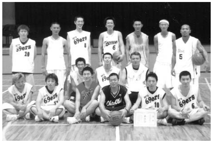
▲ 「一度、見学に来てください」と皆さん

練習は、大任中学校体育館で毎週水・土曜日の19時30分から22時まで行っています。