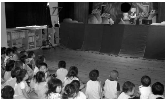
◀ おむすびを追いかけて、穴にもぐると、たくさんのおむすびが…

夏休みまであと一か月となった6月18日、下今任公民館で「どこでもだれでも救急救命・あなたの行動で救える命があります」と題した救急救命講習会がありました。講師は田川市立病院一次救命処置を普及する会の皆さん。 この講習会に下今任地区の子どもとその保護者など約20人が参加しました。 心停止から1分ごとに救命率が10%心ずつ低下していき、一刻も早い救命措置が不可欠とされています。この日は心臓マッサージや人工呼吸、AED（自動体外式除細動器）について講義や実技で学びました。 「もし、友だちが倒れても、今日習ったことで助けてあげたいです」と参加した子どもの1人が話してくれました。