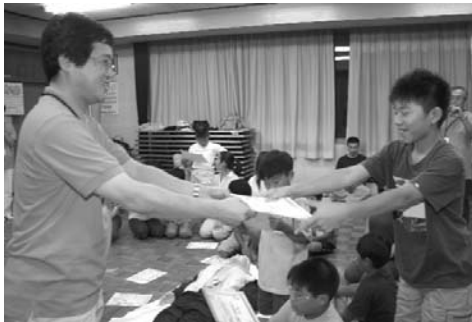
▲ 最後に1人ずつ修了書をもらいました