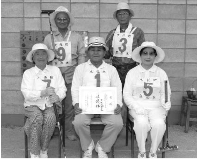
▶ 惜しくも準優勝だった灰ノ木チームのみなさん。だけど、笑顔は金メダル級です。

「優勝チームと得失点差で1点だったから悔しかったんよ。練習？ 毎日2時間くらいやりようですね。まだまだ、若い人たちには負けられんですよ。そのためには、練習ですね」とさわやかな笑顔で語ってくれたのは、灰ノ木チームのみなさん。これからも頑張ってください。