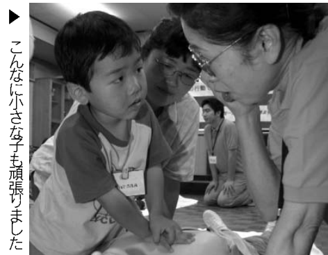
▶ こんなに小さな子も頑張りました