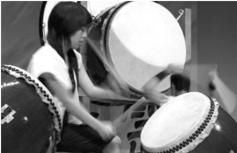
▲ ダイナミックな腕振りや早打ち…。様々なバチさばきも太鼓ならではの魅力です