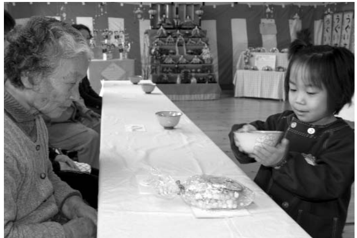
▲ 「はい、どーぞ」と、お行儀良くお茶を渡しました

この日は、保護者や地域の人たちなど約20人が集まり、園児たちが運んでくるお茶とお菓子を楽しましました。慎重にゆっくりとすり足で抹茶の入った碗を運んでいく園児たち。その一生懸命な姿を保護者たちは、優しい眼差しで見守っていました。