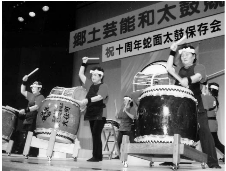
◀ 力強い演奏で観客を沸かした蛇面太鼓の皆さん