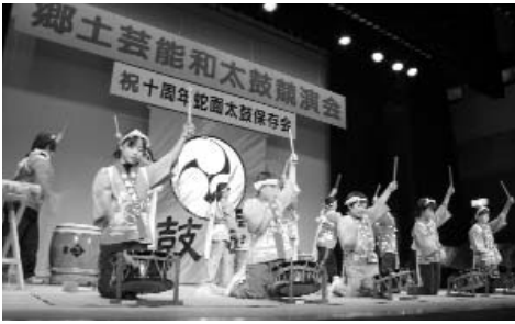
▲ トップバッターは今任小音楽クラブの児童たち。見事、大役を果たしました