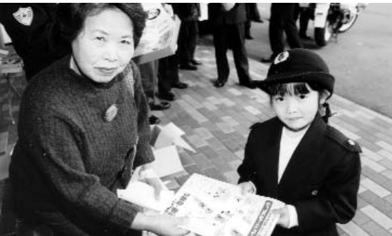
▲ 「気をつけてください」とかわい い警察官に思わず「ごっころ」