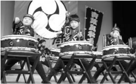
▲ 本当に保育園児？ と思ってしまうほど、りりしい顔で決まっています