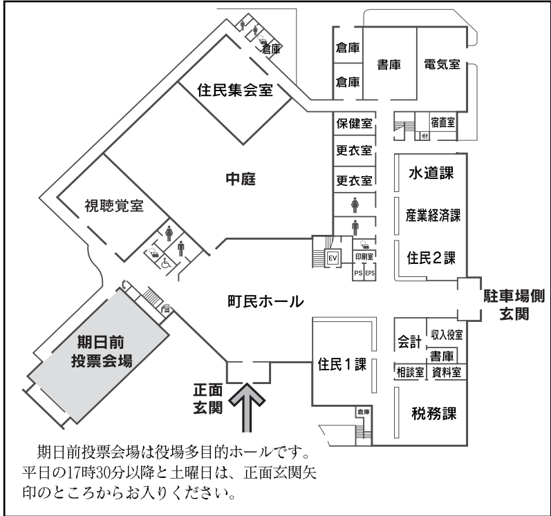
期日前投票会場は役場多目的のホールです。平日の17時30分以降と土曜日は、正面玄関矢印のところからお入りください。