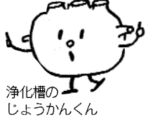
浄化槽の じょうかんくん

合併処理浄化槽の設置を補助をします。受付窓口は住民1課衛生係です。また、すでに設置している人は保守点検・清掃・法定検査を必ず受けましょう。