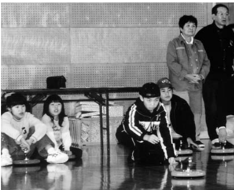
▶ 力を加減して、的を狙います