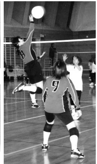
▲ すてい跳躍力。打点の高いアタックです