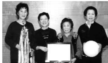
▲ 上今任チーム、大健闘の準優勝