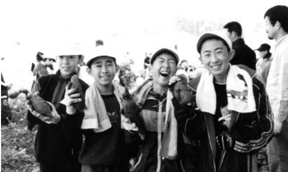
▶ みんなで掘ったイモを手に、大満足の子どもたち

「1年を通して収穫できたのは、みなさんの努力のたまもの。この経験を将来に役立ててほしい」と交流会最後に、のぞみの里利用者の一人は語ってくれました。