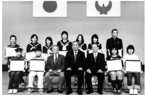
▶ 子どもたちの主張は、町のホームページで見ることができます

約200人の聴衆の前で発表したのは、町内小中学校から選ばれた11人の若い演説者。環境問題や差別問題、平和、夢、そして日々の生活で感じる事...、それぞれ独自の視点でテーマをとらえ、作文を発表しました。大会終了後はB&G体育館でカローリングを行い、楽しく盛り上がりました。