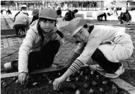
▲ きれいな花が咲きますように