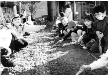
▲ みんなで協力して球根を植えました