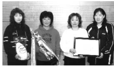
▲ 総合優勝は大任フレンズBです

試合は、Aパート1位の上今任チームとBパート1位の大任フレンズBが決勝戦を行い、総合優勝は大任フレンズBという結果となりました。