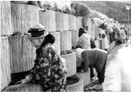
▲ 駐車場もチューリップで埋め尽くされます