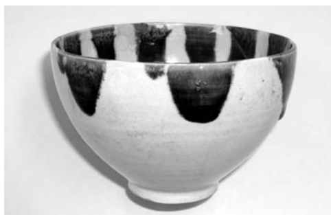
▲ 陶器製のおわん。これと同じ物が上野焼でも見つかっています

化財の保護について考えていただければ幸いです。今月は、町内上今任にあった『田香焼』について紹介します。田香焼は、江戸時代後期の70〜80年間、町内上今任と香春町高野で焼かれた陶器を主とする焼き物で、操業期間が短かったため、幻の焼き物と言われています。 窯跡が町内に2カ所残っており、町の史跡に指定されています。平成6年度から9年度に発掘調査が行われ、約400箱もの焼き物が発見されました。製