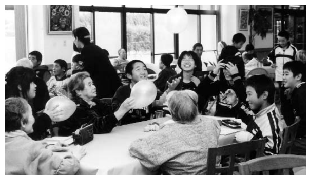
◀ 笑顔あふれる風船遊び