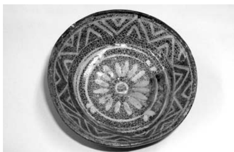
▲ 陶器製の小皿。福岡県立美術館の収蔵品にもこれと同じ物があります

化財の保護について考えていただければ幸いです。今月は、町内上今任にあった『田香焼』について紹介します。田香焼は、江戸時代後期の70〜80年間、町内上今任と香春町高野で焼かれた陶器を主とする焼き物で、操業期間が短かったため、幻の焼き物と言われています。 窯跡が町内に2カ所残っており、町の史跡に指定されています。平成6年度から9年度に発掘調査が行われ、約400箱もの焼き物が発見されました。製