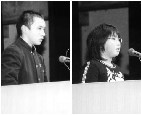
▶ 緊張と興奮の中、熱く語りました