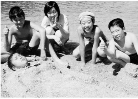
▲ 砂の彫刻完成。題名は浜の人魚姫？