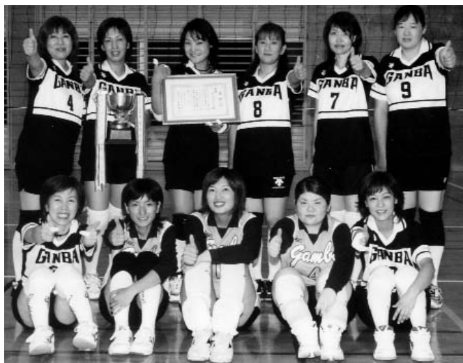
▲ 毎週火曜日と金曜日の20時からB&C体育館で練習しています。一度、見学に来てくださいと皆さん