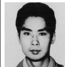
たかはし かつや 高橋 克也 地下鉄サリン事件

特徴/昭和33年生まれ。身長172センチくらい。眉毛が濃く、頭が大きい。近視(眼鏡使用あり)である。