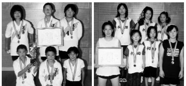
▲ 男子の部優勝・道善Aチーム ▲ 女子の部優勝・向田チーム

結果、女子の部では向田チームが、男子の部では、道善Aチームが優勝。両チームとも春の球技大会に続いて2連覇を達成しました。