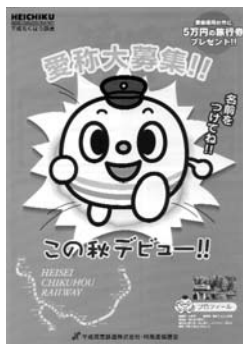
▶ たくさんの応募を待っています