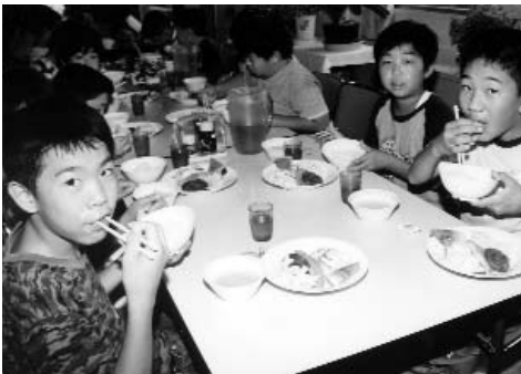
▲ たくさん遊んだ後はお待ちかねの食事タイム