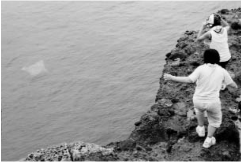
▲ ゆうゆうと泳ぐエイにしやされました