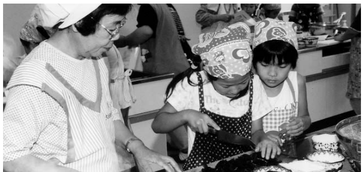
▲ 包丁を使うときは慎重に…とみんな真剣です

今回は「和食」に挑戦 夏休み親子の料理教室 7月27日、役員住民集会所で食生活改善推進委員会が、夏休み恒例「親子の料理教室」を開催しました。今回は大任小学校学童保育クラブの児童と指導者合わせて24人が参加。挑戦したメニューは4色ごんがり、豆腐わかめサラダ、夏の具たぐさんみそ汁、白玉冷やししるこ和食ぞろいの計4品。 野菜を切る不器用な手つきをハラハラしながらの見守る大人たちとは対照的に、とても楽しそうに調理をする子どもたち。——1時間半後、料理が完成し、お待ちかねの試食。自分たちで作った料理は格別だったようです。