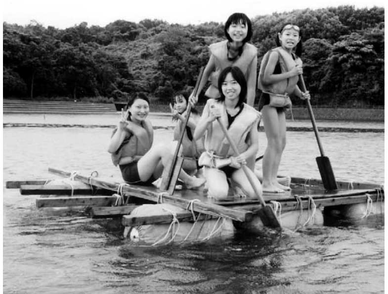
◀ いかだに乗って大海原へ。気分は「気持ちいい、最高！」