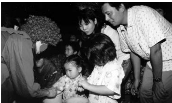
◀ お楽しみへの引き。何が当たるかな？

雨の中でいかだに乗ったこと、ハイキング先で偶然エイを見つけただこと、きれいな夕日を見て感動したこと…。みんな貴重な体験となったのではないだろうか。 夏のキャンプといえは海——というわけで今回の野外スクールでは、8月3日から5日までの2泊3日で、大分県立少年自然の家で活動を行い、参加した28人の子どもたちは夏の海を満喫しました。 途中、雨が降ったり、やんだり不安定な天候だったときもありましたが、予定どおりの活動ができました。いかだ乗りやハイキングなどハードスケジュールだった野外スクールIN香々地。しかし活動がきつかった分、一段とたくましくなったようです。真っ黒に日焼けした子どもたちの顔は、充実感に満ちあふれていました。