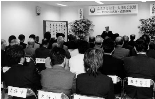
式典には多くの人が参加しました

5月21日、町公民館で大任町誌「ふるさと大任」発刊記念式典と公民館改装披露が行われました。町誌編集委員や公民館改装に関わった方々など約60人が出席し、町誌完成と公民館改装を祝いました。 式典では、町長から町誌完成と公民館改装に尽力した関係者たちに感謝状が贈られました。その後、出席者たちは、公民館の中を見学しました。 きれいになって使いやすくなった公民館。皆さんもぜひ、利用してください。町誌の販売については裏表紙をご覧ください。