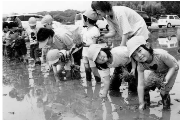
慣れない作業に四苦八苦しながら園児たちは一生懸命植えていました