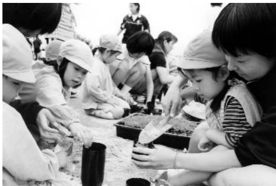
ほのほとした雰囲気、作業は行われました

5月26日、大任中学校の駐車場で「花の日」が開催され、町内保育園や小学校など約300人が参加。マリゴールドとアゲラタムの苗を約9,000個のビニールポットに約1時間半ほどかけて移植しました。 「ねえ、ねえ、これどうやってするの?」と園児たちの問いかけに中学生が優しく教える光景があちらこちらで見られ、和やかな時間を過ごしました。 移植された苗は後日、参加者たちに配布され、地域の美化に役立てられます。花が開花する7月が楽しみです。