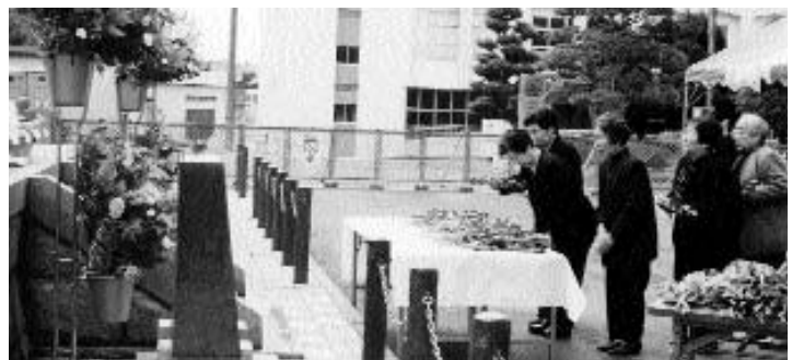
▲ 参列者は若くして戦争に旅立った故人を思い出しているようでした