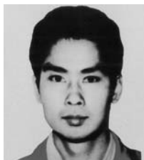
たかはし かつや 高橋 克也 地下鉄サリン事件

特徴/昭和33年生まれ。身長172センチくらい。眉毛が濃く、頭が大きい。近視(眼鏡使用あり)である。