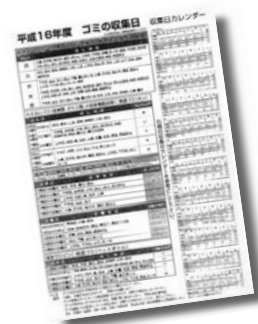
▲ カレンダーは住民1課衛生係窓口にあり

4月からごみ収集日が変わりました。燃えるごみ以外の収集日が変わっています。また、土曜日の収集がなくなり、祝日の収集を実施しています。