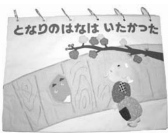
▲ 昨年度の講座で作られた作品。縦75cm、横95cmもある力作です

レインボーホール図書室では、今年度も次のとおり「布の絵本作製ボランティア講座」を開催します。 布の絵本は独自の温かい手触りといろいろな仕掛けが楽しい手作りのメディアとして、近年注目を集めています。手作りならではの楽しさがいっぱいこの『布の絵本作製』に、あなたも参加してみませんか。