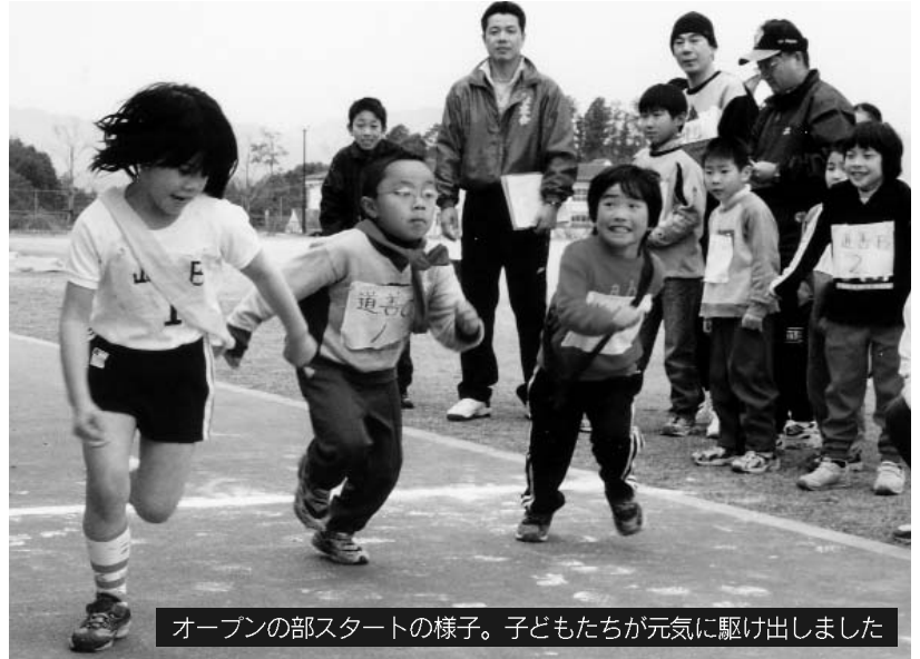
オープン部のスタートの様子。子どもたちが元気に駆け出しました