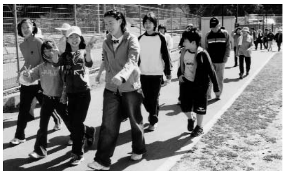
▶ 参加者たちは小春日和の中で、ウォーキングを楽しんでいました

ウォーキングは、いつでも、どこでも、だれにでもできる運動としておすすめです。これから、みなさんも始めてみませんか。